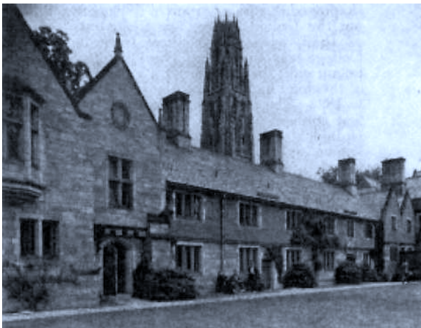
2. Yale-ko Unibertsitatea (ikus 89 orria)

Era digitalez sinatutako dokumentuaren frogazko balioaz jardun baino lehen, oso komenigarria iruditzen zait bere funtzionamenduaren berri ematea, sintesi labur bat bada ere, gaiarekin trebaturik ez dagoen irakurlea orientatzeko asmoz. Sistemaren deskribaketa, beraz, txit osagabe eta azalekoa izango da ezinbestez. Sinadura digital izeneko erabideen bitartez norbaitek mezu informatiko bat enkriptatzen du berak bakarrik ezagutzen duen giltza pribatu batez, eta hartzaileari sarean zehar igortzen dio, berari, aldi berean ala ondorenean, giltza publiko bat ezagutaraziz, zeinen bidez hartzaileak mezua deskriptatzen baitu igorlearen nortasuna eta mezuaren edukiaren autentizitate edo kautotasuna egiaztatuz. Sistema edo erabide honetan funtsezkoa da konfidantzazko hirugarren pertsona baten eskuharmena, maiz Ziurtapen edo Zertifikazio Izakunde deitua (alemaniar Zuzenbidearen kasuan Zertifizierungsstelle izenekoak, administral ikuskapen eta onarpenari azpiezari edo menpetuak). Hirugarren pertsona honi dagokio ziurtatzea korrespondentzia edo kidesun osoa dagoela giltza publikoaren eta bere burua giltza honen titulare gisa identifikatzen duen pertsonaren artean.