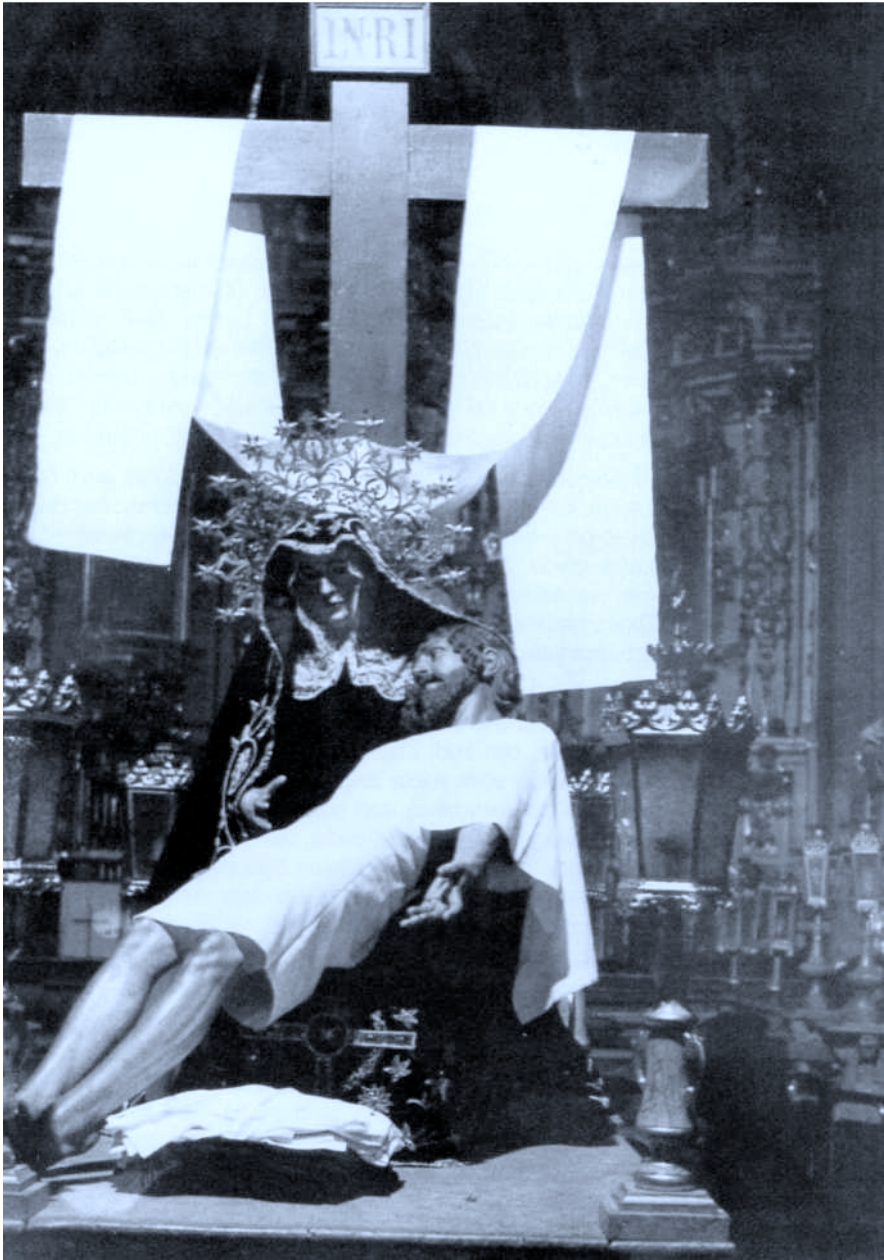
7. Lamina. Azkoitia. Pietatea.