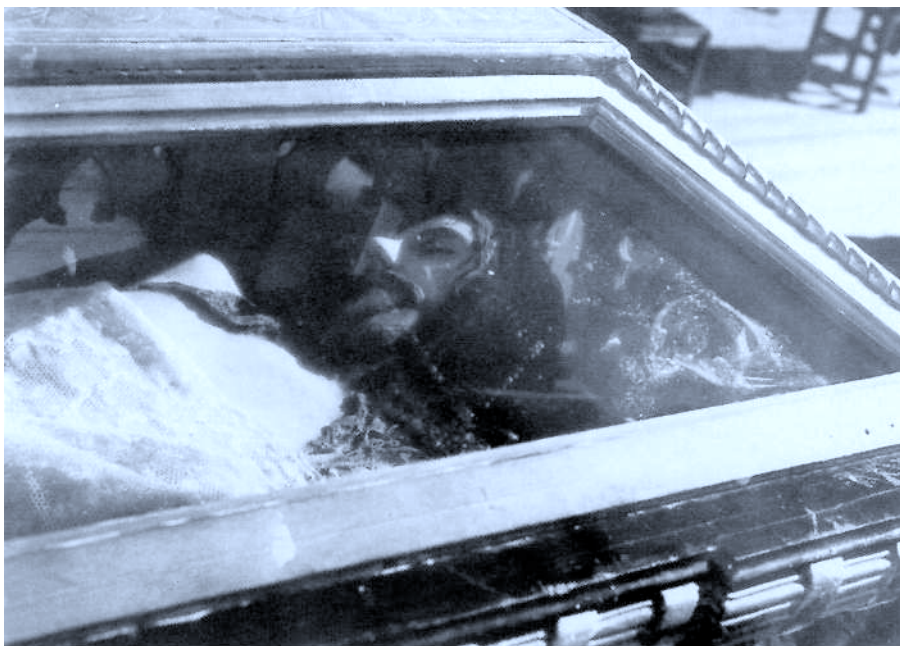
8. Lamina. Azkoitia. Kristo etzanda.

Kristo etzanda: dirudienez, irudi hau (8.lamina) XVI. mendeko erdialdean egina dago. Irudiaren neurriari dagokionez, 2 m. ditu, eta zerraldoak berriz 2,35 m. Gorputza ez dago ondo modelatua, xehetasunik jasotzen ez delarik. Bere egilea ezezaguna bada ere, garbo dago bere interes guztia Kristoren aurpegian zegoela. Sudur zorrotza du, bekain meheak eta ondo marraztuak. Azkenik, gezurrezko ile eta bizarrak egiazko itxura ematen diote, kontuan harturik gorputz gehiena estalita duela. Bi herrietako pasoen zikloa hemen bukatu behar dugu, geroagoko eskenarik ez bait dago.