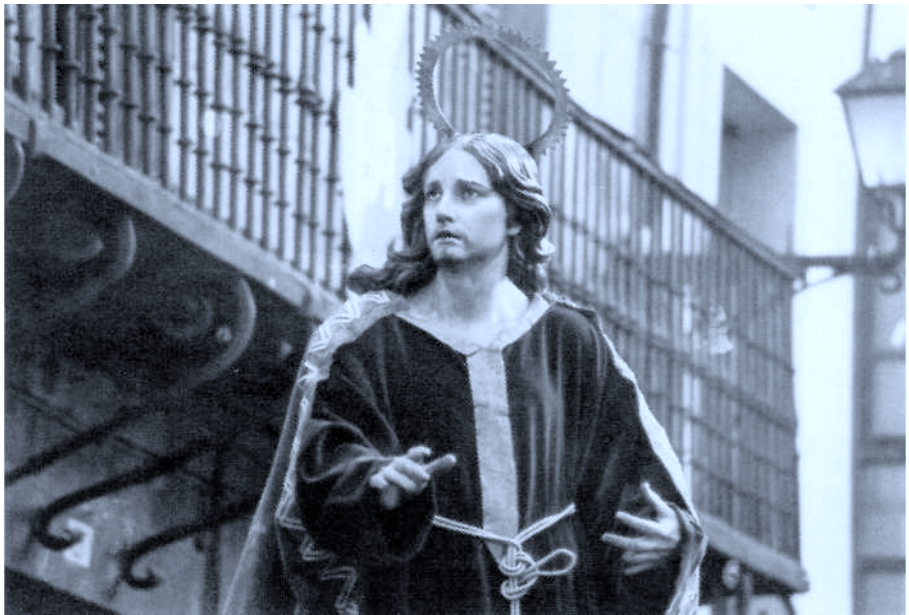
5. Lamina. Seguru. San Joan Bataiatzailea.

San Joan Bataiatzailea: Herri bietan ditugu bere irudiak, Segurakoa benetan azpimarragarria delarik. Dokumentazioak esaten digunez, irudi hau XVIII. mendean egina dago, Madrilen hain zuzen ere, zeren «mandado hacer en dha Corte de Madrid que se reduce a caveza, Manos, pies, Armazon y vestido de seda u otra tela, y su traida, despues que estubiese perfeccionada de encarnacion y de mas que necesitare» zegoela dakigu 1750. urtean (12). Irudia ikusterakoan (5.lamina), garbi dago aipatutako nahi hori beteta ikusi