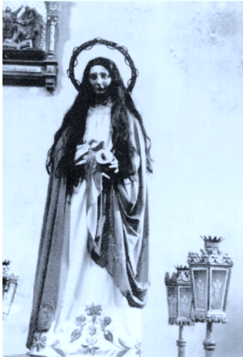
6. Lamina. Azkoitia. María Magdalena.

Maria Magdalena: Azkoitian dugu irudi hau (6.lamina), eta bere burua Elgoibarretik ekarrita dago, San Frantzisko komentutik aterata. Eraberrituta badago ere aurpegia, XVIII.