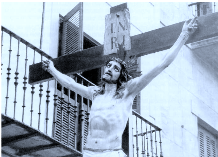
4. Lamina. Seguru. Gurutzikatua.

Gurutzikatua: Segurako irudia (4.lamina) mende honetakoa dugu, bere egituraz jakin dezakegunez. Hiru iltzez josita dago eta Kristo bizirik dago, bere ezkerretara burua inklinatuta. Hiloihal handia du, ia izter biak estaltzen dizkiolarik. Gora begira dago, Aitari begira egongo balitz bezala. Gorputzaren tratamenduan, apur bat eskematikoa geratu bazen ere bere egilea, oro har, irudi polita dela esan dezakegu. Arantzeko koroa darama, odol tantak erortzen zaizkiolarik eta ahoa piska bat zabaldua duelarik, sufrimenduaren exponente bezala. Biniés-en lanekin gonbaratzen badugu (11), irudi baten aurkezpena mendeetan zehar nola aldatzen den konturatuko gara, gorputzaren tratamenduan eta jarreraren batipat, Segurakoa askoz ere baretsuagoa delarik.