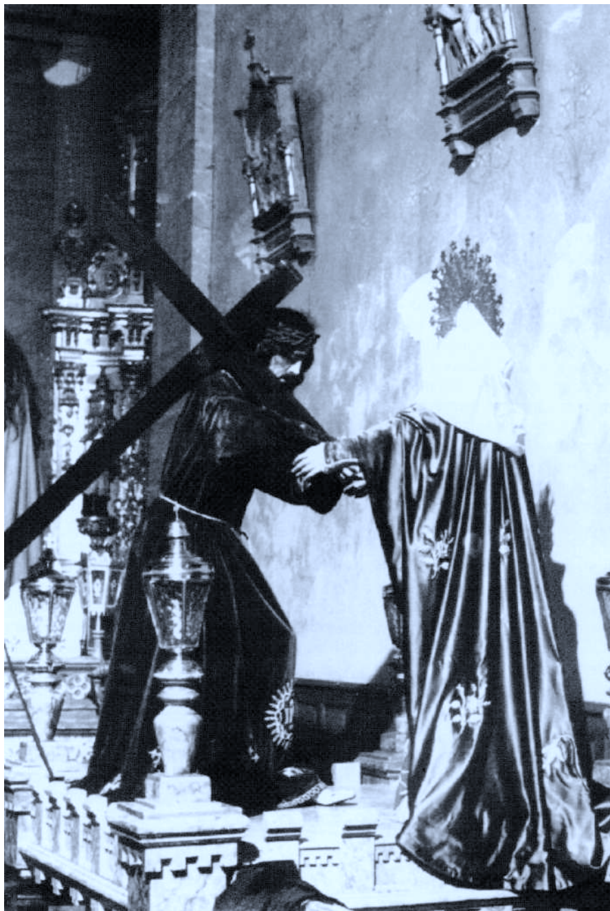
3. Lamina. Azkoitia. Aurkitzea.