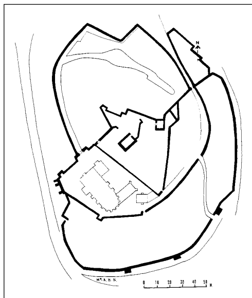
Castillo de San Vicente de la Sonsierra.

La villa de San Vicente de la Sonsierra es una villa riojana que durante gran parte de la Edad Media estuvo vinculada al reino de Pamplona, llamado más tarde de Navarra.