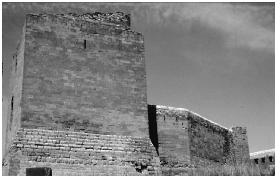
Torre mayor del castillo de San Vicente de la Sonsierra.

La portada, que se abre en el lado Sur de la nave, es muy sencilla, apuntada y sin otro ornamento que un sobrio guardalluvias. La misma autoridad se aprecia en los modillones que soportan el tejazoz 19 .