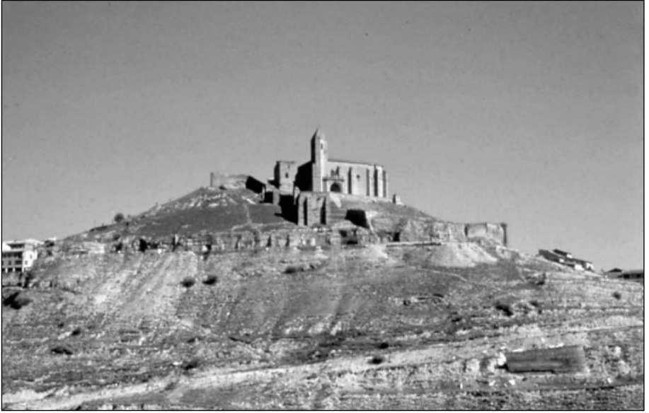
Villa-fortaleza de San Vicente de la Sonsierra.

Por un documento, datado entre 1.167 y 1.172, mediante el que Enecón de Lotza donaba sus casas de Doroño 5 al monasterio de San Miguel de Ripa 6 , sabemos de la construcción del castillo de San Vicente, ya que en él se dice: Factum est hoc donatium anno quo Ferrant Moro tenebat Sanctum Vicencium et faciebat castellum 7 .