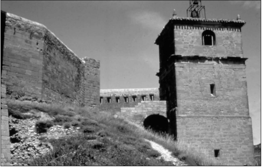
Torre albarrana del castillo de San Vicente de la Sonsierra.