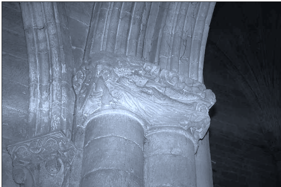
Lám. 4. Catedral de El Salvador en Santo Domingo de la Calzada (La Rioja). Capitel de la primera pilastra empotrada en el muro externo de la girola. Embocadura de la girola por el lado de la Epístola. Asunción de la Virgen.

sagrada. En el románico adoptará la de las doncellas o matronas de Roma-Bizancio y no aparecerá nunca con la de tipo regional o palestiniano. Va a consistir en túnica, manto, velo que cubre tanto cabeza como peinado, calzado y a veces corona. A pesar de los cambios de moda, este atavío permaneció inalterado y adquirió carácter sagrado 19 .