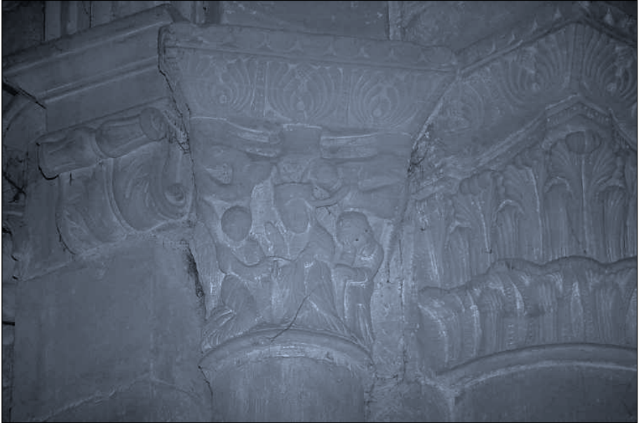
Lám. 3. Catedral de El Salvador en Santo Domingo de la Calzada (La Rioja). Capitel de la tercera pilastra empotrada en el muro externo de la girola. Lado del Evangelio. Anunciación-Coronación de la Virgen.

única diferencia reside en que en el citado asunto es el alma la que asciende, con forma de figurita humana desnuda, mientras que en la iconografía de la Asunción, es su propio cuerpo el que lo hace, ya que según la teología cristiana, María ascendió al cielo en cuerpo y alma. En el capitel calceatense se ha prescindido del momento de la Muerte o Dormición para resaltar únicamente su Tránsito o viaje a las moradas celestes.