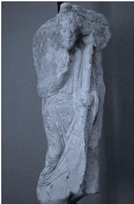
Lám. 1. Iglesia Imperial de Santa María de Palacio en Logroño (La Rioja). Fragmento pétreo con un Ángel de Anunciación.