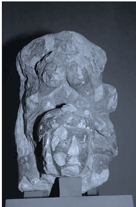
Lám. 2. Iglesia Imperial de Santa María de Palacio en Logroño (La Rioja). Fragmento pétreo con la Coronación de la Virgen.

adosado a un haz de cuatro columnas torsas, con sus correspondientes capiteles tallados con motivos vegetales, similares a los que se conservan en otros fragmentos escultóricos de la iglesia, que al igual que sucede con éste, desconocemos cuál fue su ubicación.