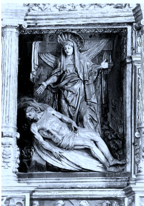
Quinta Angustia. Retablo Mayor de San Juan de Estella. Fray Juan de Beauves.

Se trata de una cantidad muy elevada, lo que indica la importancia de la obra que fue elogiada por Ponz cuando la visitó hacia 1780. “El retablo mayor de la iglesia de los P.P. Dominicos es en estilo medio, digno de consideración por sus baxos relieves y cuerpecitos de arquitectura. No es poco que no haya tenido mal paradero, como otros infinitos de esta clase; y del que estuvo amenazado, para poner en su lugar una mamarrachada, como es la arquitectura de los otros retablos” 22 . Tres años más tarde que Don Antonio Ponz visitase esta iglesia el retablo fue reformado en su estructura de acuerdo con el gusto barroco 23 . Por su abundante obra conservada y estudiada Fray Juan de Beauves puede considerarse el escultor más sobresaliente de un momento de transición del Primer Renacimiento al período de la Contrarreforma.