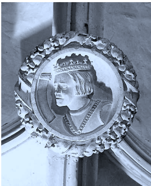
Fig. 5. Coro de Santa María de Salvatierra. Clave de la bóveda. Felipe II niño.

Muy cerca de éste, en el tercelette que va a parar a la clave de Santiago, se representó un joven niño de la Casa de Austria, de corta melena y coronado. Estamos, sin duda, ante una de las manifestaciones infantiles más tempranas de Felipe II (Fig. 5), que a la sazón no contaría sino nueve años en 1536. En línea con la imagen, otro emperador romano.