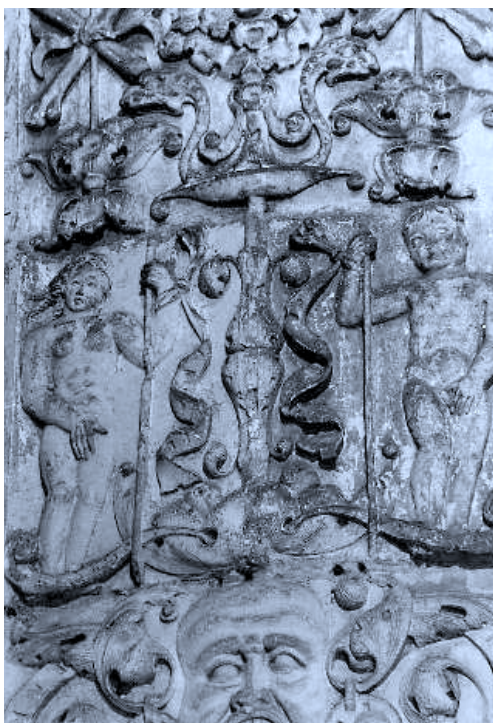
Fig. 1. Coro de Santa María de Salvatierra. Frente meridional. Adán y Eva.

Las figuras de Adán y Eva, bien cuando la tentación, bien tras la caída, aparecen profusamente en el arte renacentista. En la escultura es usual encontrarlas en los retablos, muy a menudo relacionados con el Calvario, manifestando que la Redención del pecado original de los primeros padres tuvo lugar cuando Jesucristo murió en la cruz. Tampoco son desconocidos en el arte funerario, donde normalmente se solían incluir como una alusión al carácter mortal de la persona 10 . Para Panofsky, en los ambientes