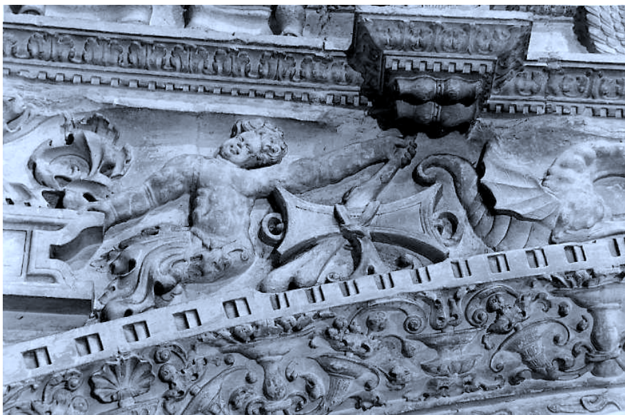
Fig. 2. Coro de Santa María de Salvatierra. Frente oriental. Hércules niño.

Durante el Renacimiento se asistió a una innovación total del mito de Hércules, convirtiéndose en la fábula moral por excelencia, sin soslayar la fuerza física y los triunfos de la gloria. Era el primero entre los "uomini famosi", al que Petrarca cantó como tal, el hombre de la virtud, irresistible y vengadora 20 . A través de su figura se alegorizaban la fortaleza, la gloria y el triunfo. Para el Marqués de Villena, en su libro Los Doze Trabajos de Hércules (1483) era el representante de la justicia y caballeridad, lo concebía como un caballero bienhechor, protector de pobres, damas y desvalidos 21 . La referencia a Hércules se convirtió en un tema recurrente en la iconografía monárquica del siglo XVI, que no ha de atribuirse exclusi-