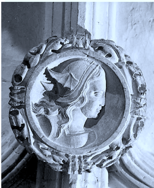
Fig. 6. Coro de Santa María de Salvatierra. Clave de la bóveda. Minerva.

Como lo acabamos de indicar, pocos años antes que en Salvatierra se había realizado una de las primeras manifestaciones plásticas de esta concepción dinástica del imperio, que después se hizo ineludible en los programas de exaltación de Carlos V. Fue la de la chimenea del Palacio de Justicia de Brujas, diseñada en 1529 tras el triunfo de Pavía de 1525 40 . Allí, como posteriormente en los claustros de Oñate, Irache, Valbuena, Santa María de