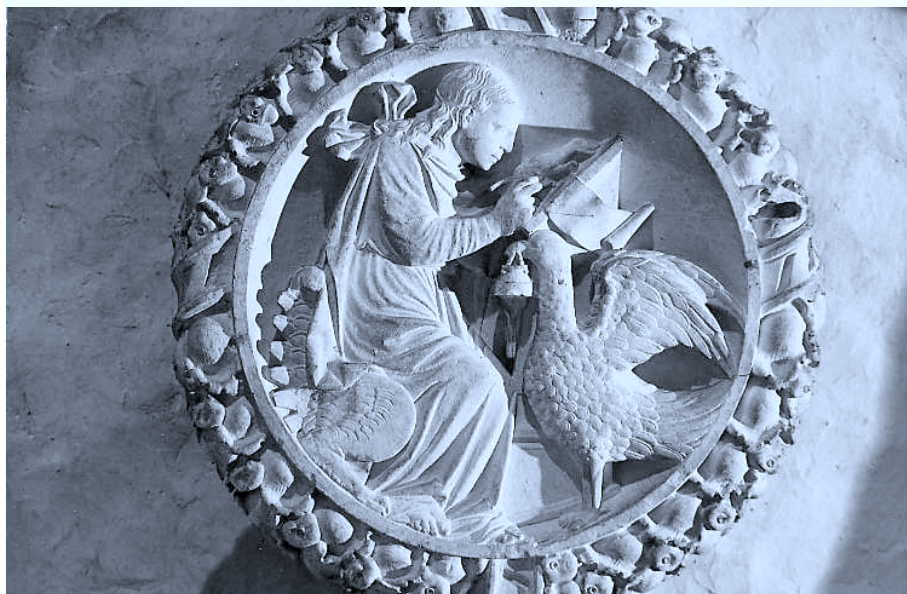
Fig. 4. Coro de Santa María de Salvatierra. Clave de la bóveda. San Juan Evangelista.

San Juan (Fig. 4), con los extremos del manto anudados sobre el hombro derecho, se asienta sobre una silla muy parecida a la de San Mateo. Fue figurado en el mismo momento en que escribe sobre el pergamino al cual sujeta con la mano izquierda sobre la mesa. El águila le ofrece el tintero colgado del pico.