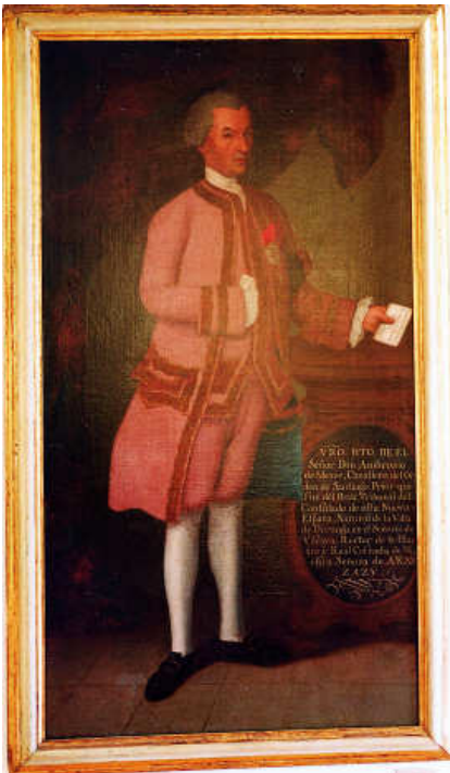
Retrato de Ambrosio de Meave, (Museo de Arte e Historia, Durango).

En el retrato de Meave las principales diferencias se encuentran en el contenido de la cartela, en la disposición de la cortina y en el pliego que sostiene con su mano izquierda.