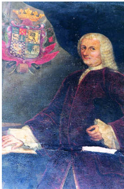
Retrato de Francisco de Echeveste (detalle).

consignado el cuadro 8 . Sin embargo, dado que en diciembre de ese mismo año ya se hace referencia a la obra en relación con el referido envío es de suponer que, efectivamente, llegó en aquella fecha.