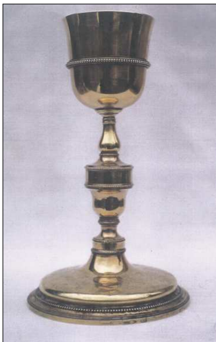
Fig. 1. Cáliz de Peñacerrada (Álava). Martínez, 1792.

Respecto al cáliz de Peñacerrada, pieza que damos a conocer por vez primera, y que se encuentra entre las escasas piezas que conocemos con su marca personal, responde a uno de los mejores modelos que interpretaron el Neoclasicismo de la primera etapa. El cáliz mide 25x14x8 cm., y lleva estampadas en el borde del pie tres marcas la personal del artífice, con una z/M (la zeta de perfil redondeado) y las marcas de Villa y Corte de Madrid con la cronológica 72.