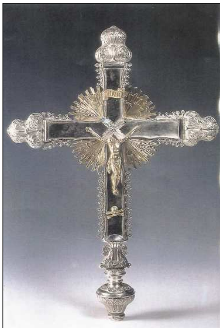
Fig. 6. Cruz procesional. Peñacerrada (Álava). Fábrica Martínez. 1857.

En cuanto a la cruz procesional, realizada en plata en su color y con el Crucificado dorado a fuego y en los vértices ráfagas de distinto tamaño. Está toda ella bordeada por una crestería de florones, los remates de los brazos y en la macolla en forma acorazonada decorada con grandes hojas de distinto tamaño. Lleva estampadas las marcas de 1857, al igual que las piezas anteriores pero dentro del modelo neoclásico, nos presenta un paso más hacia los modelos neogóticos. Los ciriales y acetre, enviados junto con la cruz, y marcados con la misma marca de la Platería z/M y fecha -57- destacan además las bandas de cuadrilóbulos entrelazados. Fig. 6.