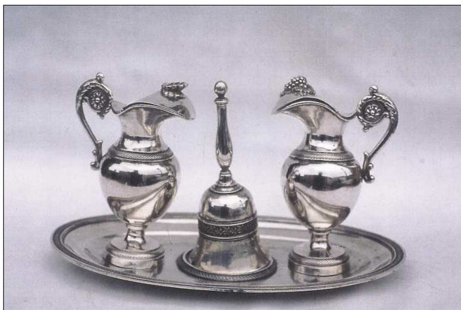
Fig. 5. Juego de vinajeras con campanilla. Fábrica Martínez. 1857.