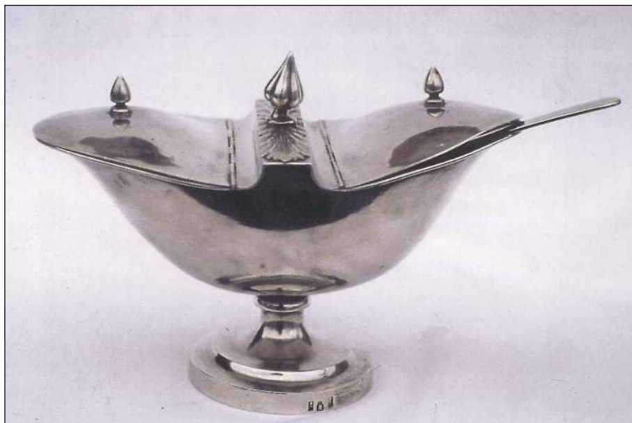
Fig. 4. Naveta. Peñacerrada (Álava). Fábrica Martínez. 1857.