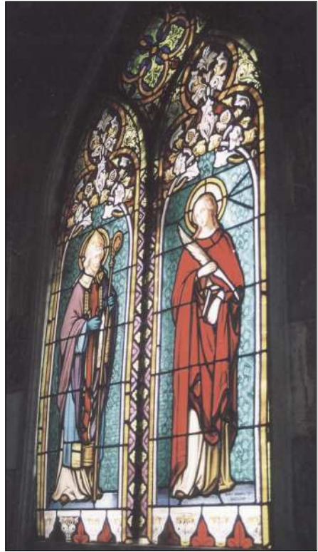
Fig. 9. Vidriera con la firma de Rigall, Granell y Cía., 1910.

La Fig. 9 recoge una de las vidrieras de la sepultura-capilla construida en 1910 42 , vidriera realizada por el taller Rigall, Granell y Cía con domicilio en Barcelona tal como aparece firmada. El reconocimiento de esta firma tal vez llegara a la ciudad de la mano del arquitecto J.B. Lázaro, ya que Rigall formaba parte del equipo de vidrieros que trabajó con dicho arquitecto en la restauración de las vidrieras de la Catedral de León que, como anteriormente hemos comentado, será este mismo arquitecto el que cubra los ventanales del Buen Pastor.