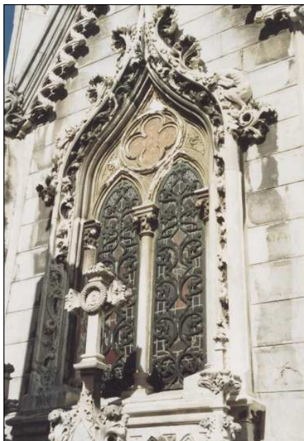
Fig. 7. Detalles ornamentales. Obra de Domingo Eceiza y Tomás Altuna, 1902.

Por el contrario en color blanco se ejecutarán los elementos ornamentales que tienen la función de mostrarse como elementos ingravidos que se elevan ante la visión del espectador: pináculos, perfiles de gabletes, figuras de seres alados o enmarques festoneados de vanos, figuras de animales monstruosos que consiguen con ese blanco marmóreo imprimir un halo de misterio a todo el conjunto al mismo tiempo que posibilitar la ascensión del familiar allí enterrado. La finalidad de este juego cromático es la búsqueda de la expresión 41 .