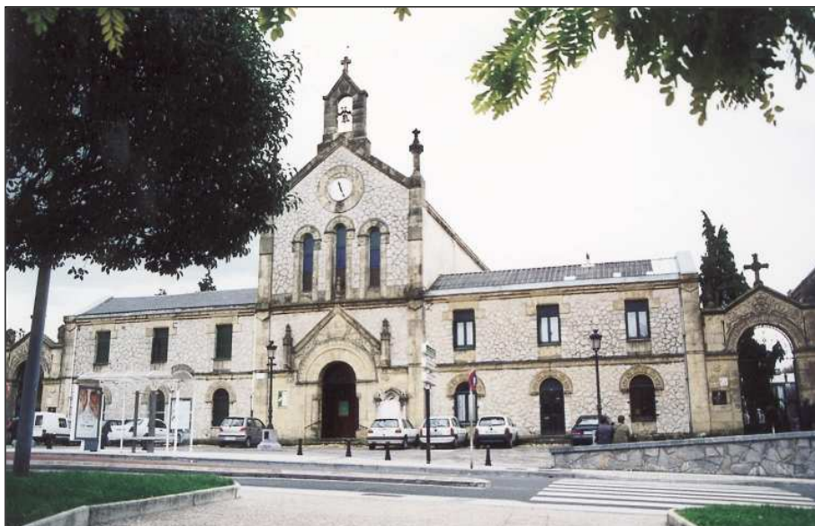
Fig. 1. Muro principal de acceso al cementerio de Polloe.