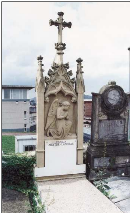
Fig. 5. Tumba proyecto del maestro de obras. José Clemente de Osinalde, 1880.

yecto Manuel Echave viaja a varias ciudades europeas comisionado por su cargo de Arquitecto Provincial. Un punto en su recorrido es la ciudad, entonces alemana, de Mülhausen próxima a ciudades como Friburgo, Ulm... A través de ellas entra en contacto con la característica común de las catedrales del suroeste de Alemania: torre única, elevada sobre el acceso y con remate en torre calada de aguja sobre una base de planta cuadrada según característica del siglo XIII. El viaje de Echave tal vez coincidiera con la terminación de la torre de Ulm en el último tercio del siglo XIX.