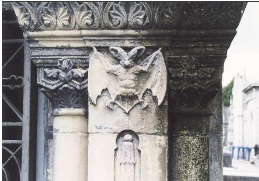
Fig. 4. Detalle ornamental.

No será hasta el inicio del siglo XX, concretamente en el periodo 1902-1910, y por influjo del ambiente que rodeó la construcción de la Catedral del Buen Pastor, cuando se van a levantar en la necrópolis de Polloe las magnas capillas que reunieron a imitación de aquella para su ejecución elementos definidores del estilo ojival.