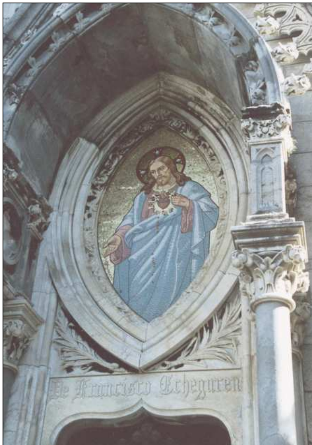
Fig. 10. Capilla-Panteón. Motivo ornamental de Teselas, 1902.

De otra manera debemos de proceder a la hora de reflexionar sobre el arte figurativo creado por mosaicos que nos aporta la revisión arqueológica del mundo bizantino y que a la capital guipuzcoana llega de la mano de la firma francesa Hermanos Maumejean.