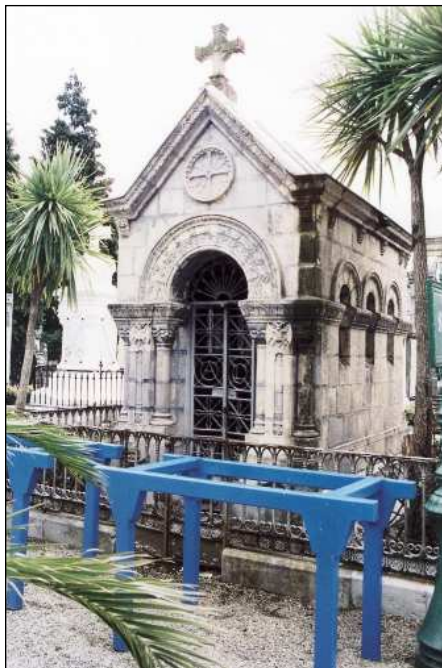
Fig. 3. Capilla Panteón, 1879. Obra de Antonio Córdazar Gorria.

Esta obra es un ejemplo de la tendencia del movimiento romántico hacia lo fantástico y alegórico (Fig. 3). Se trata de una capilla de planta rectangular con fachada principal formada por acceso en arco de medio punto. El resto de las fachadas presentan vanos tipo saeteras. Todo el muro está recorrido por la línea de imposta que presenta motivos de hojarasca de palmetas. La cubierta es a dos aguas y en el frontón se ha labrado un rosetón ciego.