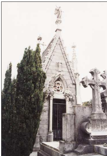
Fig. 8. Capilla-panteón. Obra de Domingo Eceiza y Tomás Altuna, 1910.