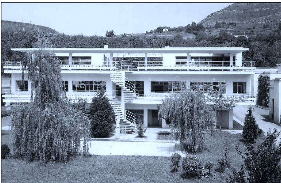
Jantokien eraikina Laborde Anaien Lantegian. Andoain.

Baina estilo berri hau hemen sortu ez zenez, kanpotik etorri eta hedape- na hainbat bideen bitartez gauzatu zen 13 . Ohikoenak beste ikerlariak aipatu izan dituzte. Inchausti argitaletxeak Madriletik hogeigarren hamarkadaren amaieran arkitektura modernoari buruzko hainbat liburu argitaratu zituen –R. Neutra, S. Giedion edota G. A. Platz bezalako arkitektoak idatziak– razionalis- moa eta funtzionalismoa defendatzen zutenek. Liburuetatuz hitz egiten dugu- nez, Le Corbusier berak Vers une architecture liburuaren bitartez bere ideak plazaratu zituen eta Madrilgo arkitektura eskolako programazioak estilo berri- tzailea jasotzen ez bazuen ere, ikasle gazteen artean 1925eko bigarren argi- tarapena eragina handia izan zuen.