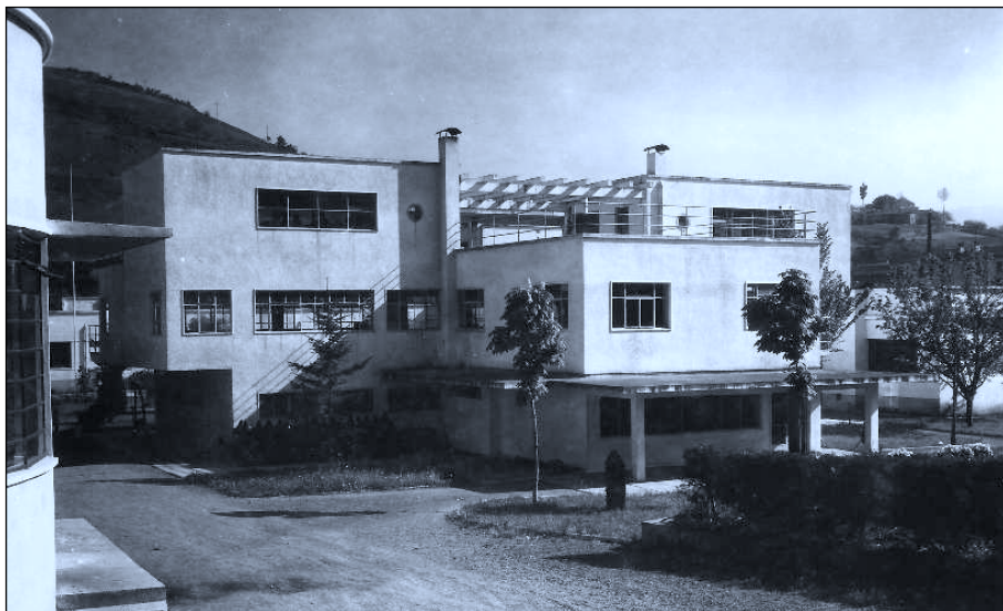
Jantokien eraikina Laborde Anaien Lantegian. Andoain.