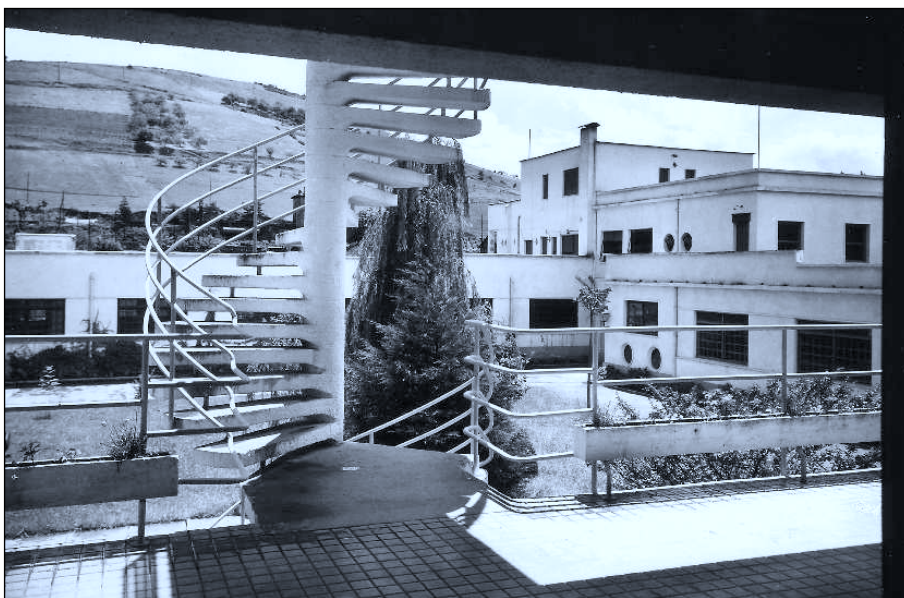
Laborde Anaien Lantegia, jantokien eraikinetatik ateratako ikuspegia. Andoain.

Aldaketa ez zen bat batekoa izan, baizik eta XIX. mendearen amaieratik XX. mendeko hirugarren hamarkada bitartean gertatu zen. Denbora honetan herrialde desberdinetako hainbat arkitekto “abentura” honetan parte hartu zuten, eta aldaketa honi izenburua ipintzeko orduan abentura hitza erabiltzen badugu garaiko eta geroko historiografia arkitektonikoak garai honetan modernitatearen alde apostu egin zuten arkitektoak heroi moduan tratatu dituztelako da. S. Giedion, L. Benevolo, R. Banham, R. Hichcock edota K. Frampton 1 bezalako historiaegileak, aldaketa guzti hauek laburtu eta zabaltzeko nahian, askotan zaila eta konplexua izan zen ibilbidea ikuspegia sinplistegietatik erakutsi dute. Hala ere, onartu behar da arkitektura modernoa edo razionalista deitzen dugun estiloa, arkitekto heroi hauei esker zabaltzeko dela eta Gipuzkoaren kasuan –Euskal Herria eta Espainia osoan bezala– estilo berri hau beranduago helduko bada ere –hogeigarren hamarkadaren amaieran–, gehienbat garaiko komunikabidei esker izango da.