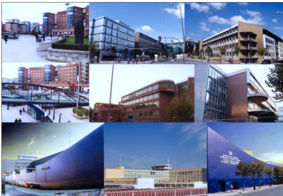
Figura 5 a|c|d a, b) Complejo hospitalario de Cruces (arquitecto Marcide) con su entorno urbano regenerado recientemente (2003). b|e|f c, d) Sucesivas ampliaciones y edificios anexos en la Escuela de Ingenieros (J. Basterretxea), aspecto actual en 2005. g|h|i e, f) Instituto de Bachillerato Gabriel Aresti (A. Libano, J. D. Fullaondo), edificios contiguos entre 2002 y 2004. ..... g-i) Escuela de Náutica, Portugalete (L. Zanón, L. Laorga). Destaca el mantenimiento de la estética simbólica y referencial conjugada e imbricada con la funcionalidad tras la restauración del edificio y los históricos muelles del entorno al inicio del siglo XXI.