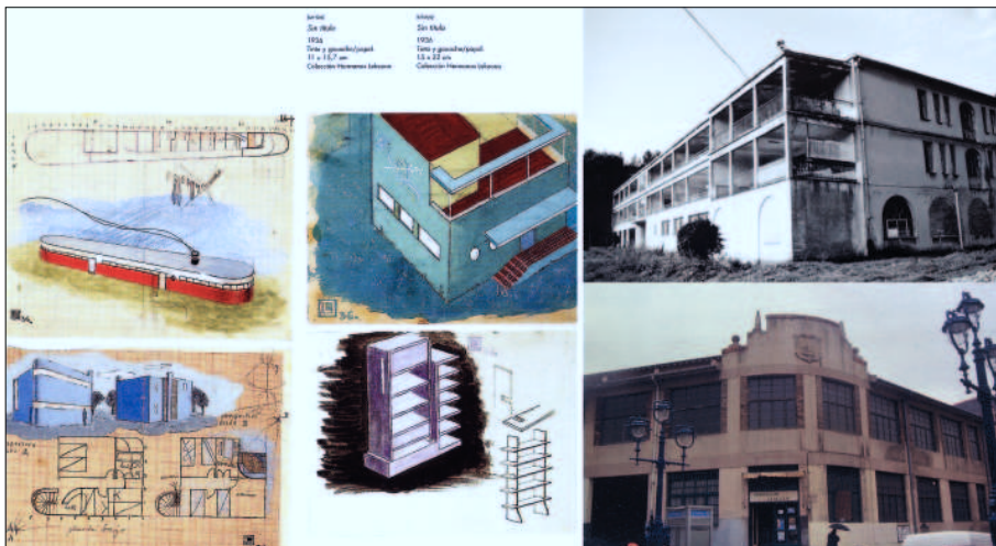
Figura 1 | b a) Dibujos y diseños para edificios y mobiliario del artista vasco Nicolás Lekuona. a | c b) Sanatorio de Santa Marina, Bilbao (E. Aguinaga). c) Mercado de Portugalete (Santos Zunzunegui).

Entre tanto, una vez desterrados los ecos del GATEPAC (impulsor de la arquitectura racionalista de anteguerra en España, sobre todo en Cataluña y con menos intensidad en el País Vasco), continuaron también vigentes los téc- nicos y artífices de la llamada 'generación del 17' (que aunque de ideología conservadora, enlazaba y asumía de algún modo los postulados del racionalismo no-ortodoxo o alejado de las premisas fundamentales que regían la arqui- tectura centroeuropea del primer tercio del siglo XX), manteniendo su forma- ción académica y su actividad constructiva. El modernismo de principios de siglo se transmutaría en una arquitectura nacional de realizaciones estatales y 'regiones devastadas' con cierta influencia en casas burguesas. Mientras tanto, la recuperación de los regionalismos se produciría sobre todo en viviendas unifamiliares y realizaciones institucionales cuando la componente regional folclorista sin 'interferencias' de nivel político así lo requiera. Por último, la arquitectura religiosa se encontraba muy activa con lenguajes revivalistas neo- medievales, preferentemente con el fin de significar la religiosidad más pura entre el 'arqueologismo' y la 'visión esencialista'. No obstante, es justo señalar en sintonía con los autores aludidos que en estos proyectos se encubren estructuras de hormigón de magnífica tradición, cuya depuración estructural únicamente se visualizará por un espacio de tiempo en las edificaciones fabri- les más funcionales.