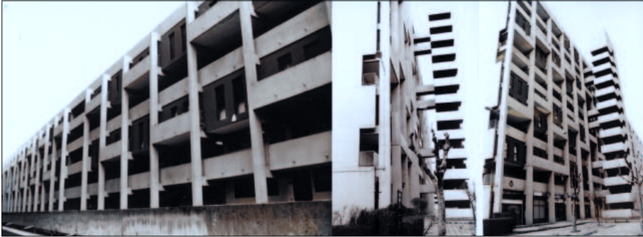
Figura 4 a) b) c) Viviendas en Deusto-San Inazio (R. Basañez, J. Lareza, J. Argáyate), aspecto de la manzana en 2001.

1964, que originó un singular bloque de reminiscencias cercanas a Le Corbusier [fig. 4a-c] ( Unité d'habitation ' lecorbuseriana pero 'reducida' nos dirá J. A. Sáenz Esquide), caracterizada por un vanguardismo neo-racionalista incipiente de cara al último tercio del siglo XX