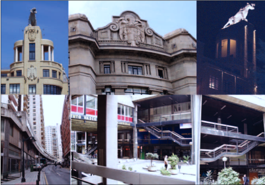
Figura 6 a|b|c a-c) Perpetuación de 'símbologías emblemáticas' que tienen su reflejo en edificios restaurados de la ciudad (Bilbao). d|e|f d-f) Torres de Zabalburu (E. M e de Aguinaga), el deterioro y abandono es palpable en todo el complejo residencial.

Con todo, el balance de la arquitectura que se auguraba en esas décadas no fue positivo, tal y como a observado J. A. Sáenz Esquide. Se insiste en la nefasta incidencia en Bilbao de la 'arquitectura de la especulación' que aún perduraba en la época del 'desarrollismo decadente'. La asunción de los patrones comerciales ata el proceso creativo en arquitectura, que queda relegado a las construcciones públicas e institucionales que dan mayor margen para la experimentación (palacios de justicia, vivienda pública, museos y centros de ocio, escuelas, hospitales, arquitectura cuartelaria, etc.). De modo parejo, J. González de Durana sintetiza los inmediatamente siguientes años subsumidos en una fase final del desarrollismo, donde la tonalidad constructiva general se inscribe en la omnipotencia de los promotores y constructores que tienden a concebir la ciudad de espaldas al entorno circundante, fuera de toda 'escala humana'. El lenguaje 'impersonalmente mercantilizado' reina en la mayoría de las promociones de nuevas viviendas sin ningún interés formal resueltas a contrapasa y en aras de la especulación, la cual ve que se le están escapando los años más fructíferos (muchos arquitectos para ganarse su sustento se vieron obligados a participar en estos descalabros urbanísticos) 16 . Además, la gravedad se extrapola si