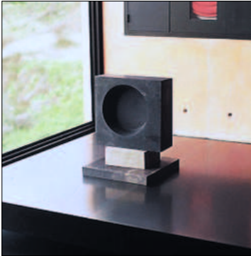
Escultura Homenaje Padre Donostia , 1957. Fundación Museo Jorge Oteiza.

La Estela funeraria era una escultura moderna. Y en la praxis de Oteiza se situaba en un límite. Por su apariencia 38 (fotos 5 y 6), desde una primera apro-