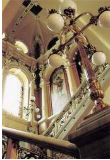
Cuerpo de escalera.

En el proyecto que presentan los Hermanos Gargallo incidían aún más en este aspecto puesto que la ponencia habla de modificar o sustituir unas cabezas de leones ya que el lugar elegido para su colocación dificultaban el paso 15 .