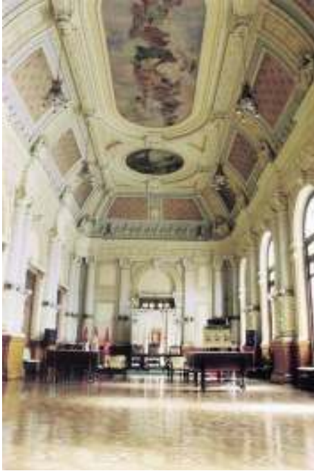
Salón de Fiesta.

Cinco puertas sencillas dan paso al Salón de Fiestas . Julio Gargallo califica a esta sala como la más importante del edificio y por ello debía de mostrarse como la de mayor riqueza y suntuosidad . Este taller parece que quería asegurarse su decoración pues envían una reproducción a escala de 0'10 por metro ya que con un relieve se hacen mejor a la idea del proyecto.