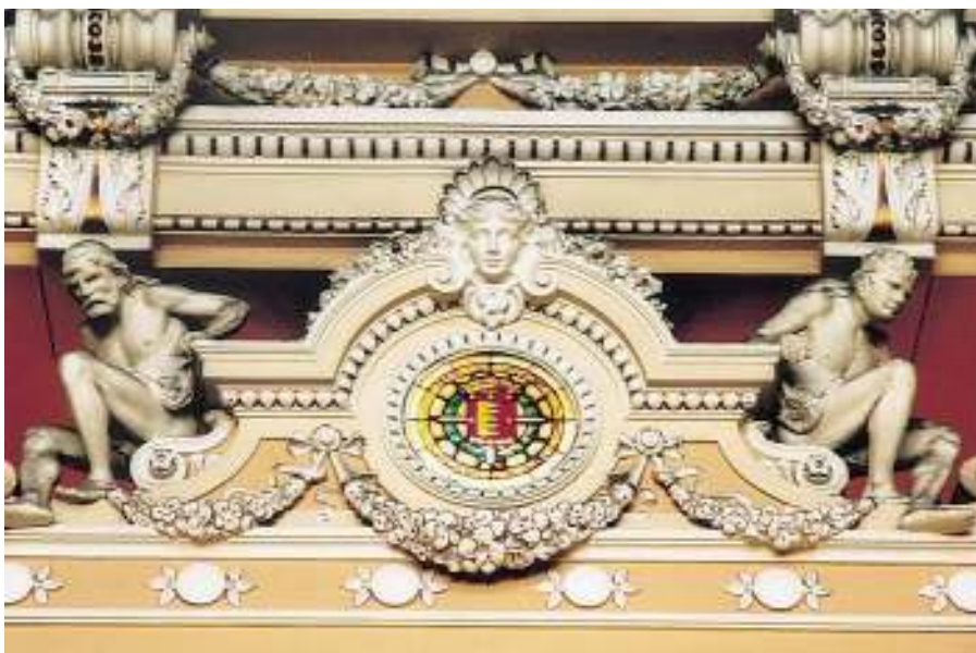
Detalle decorativo del montante. Galería superior.