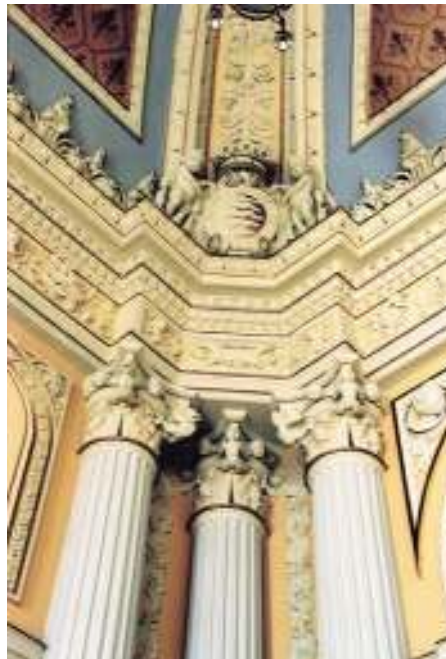
Salón de Fiesta. Detalle de uno de sus ángulos.

Para el techo Julio Gargallo propone representar en tres paneles aquellos episodios más relevantes ocurridos en la ciudad como la fundación de la ciudad por el Conde Ansúrez, quien portaría los planos de ésta -única propuesta admitida- y el bautismo de Felipe II y la entrada de Carlos V. Éstos dos últimos relacionados con el periodo arquitectónico que los enmarca 22 .