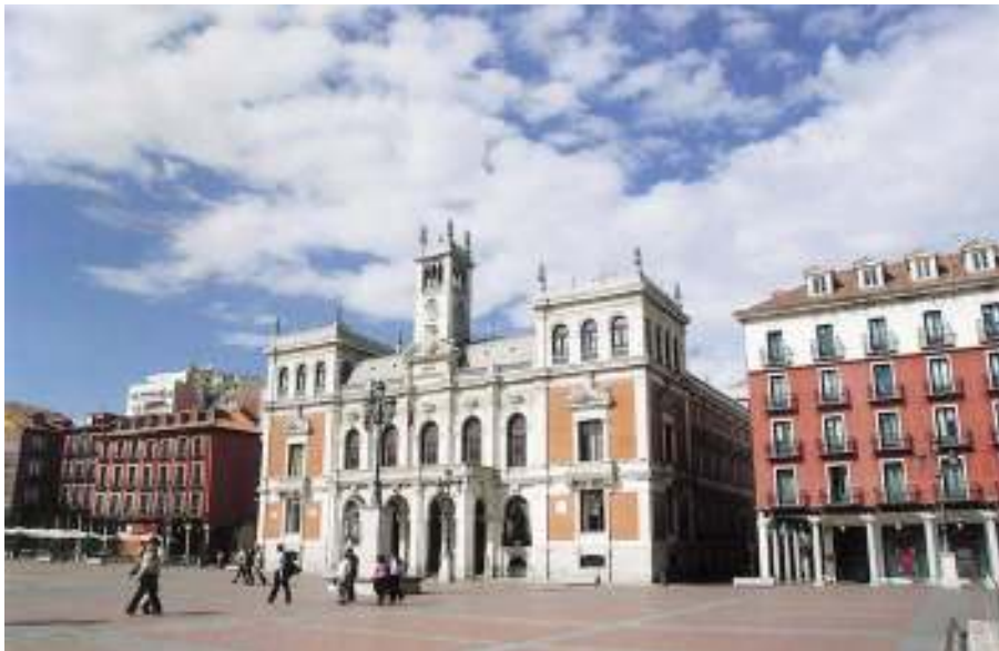
Ayuntamiento de Valladolid.

En 1901 el arquitecto Enrique Repullés y Vargas fue elegido para la construcción del nuevo Ayuntamiento 1 . Proyecta un edificio con doble función: lugar en el que tengan que resolverse asuntos civiles así como celebraciones festivas. Ambas cuestiones se resuelven perfectamente con la elección de la tipología arquitectónica. En las trazas sigue la tendencia artística y de estructura del renacimiento español y concretamente en su variante más reproducida, el Palacio de Monterrey de Salamanca con un aditamento, el soportal.