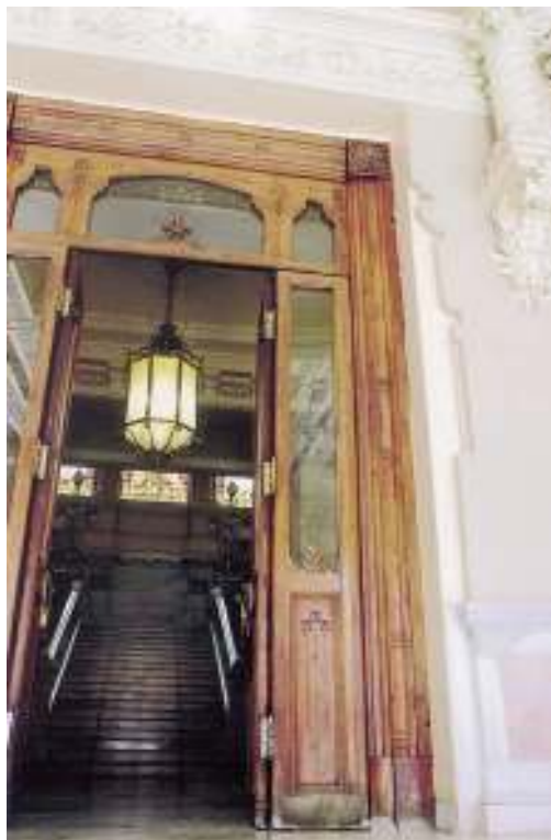
Vista desde la galería superior.

La tonalidad de sus muros era blanca con toques dorados. Hoy predomina el tono marfil y ocre siguiendo el dorado en el realce de perfiles de alguno de los elementos decorativos. A la variedad cromática de los elementos decorativos se unen los colores vivos de las vidrieras que junto con el juego del blanco-gris del mármol y la policromía de las pinturas, hace del cuerpo de escalera un espacio activo.