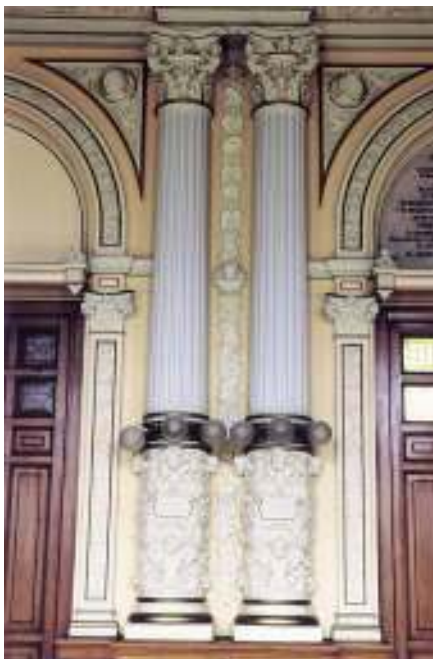
Salón de Fiesta. Elementos decorativos.