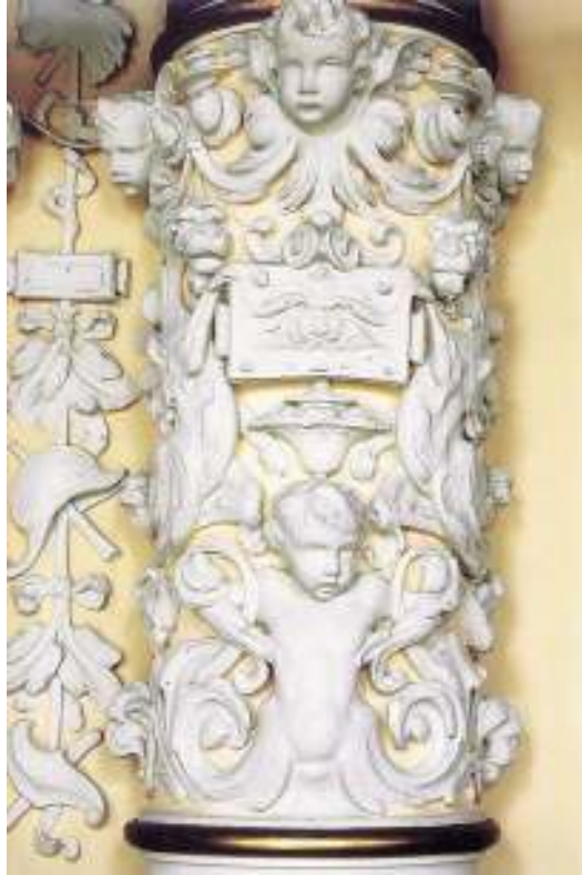
Salón de Fiesta. Decoración del tercio inferior de una de sus columnas.