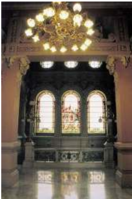
Vista de la escalera principal desde el primer vestíbulo.

A través de la Escalera Principal se accede a la planta noble del edificio localizándose allí las salas principales de asuntos relacionados con el municipio y la destinada a celebraciones festivas. Esta pieza tiene que convencer de la autoridad del municipio en ambas empresas por lo que el propio Julio Gargallo la describe como monumental por su fuerza decorativa.