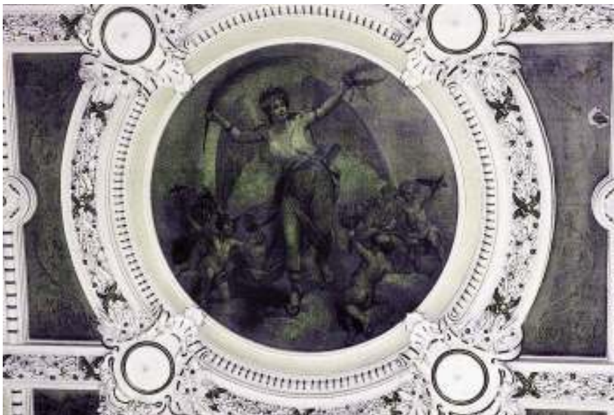
Techo de la escalera principal. Escena alegórica.