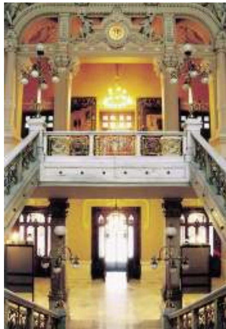
Vista del segundo vestíbulo y de la galería superior desde la meseta de descanso.