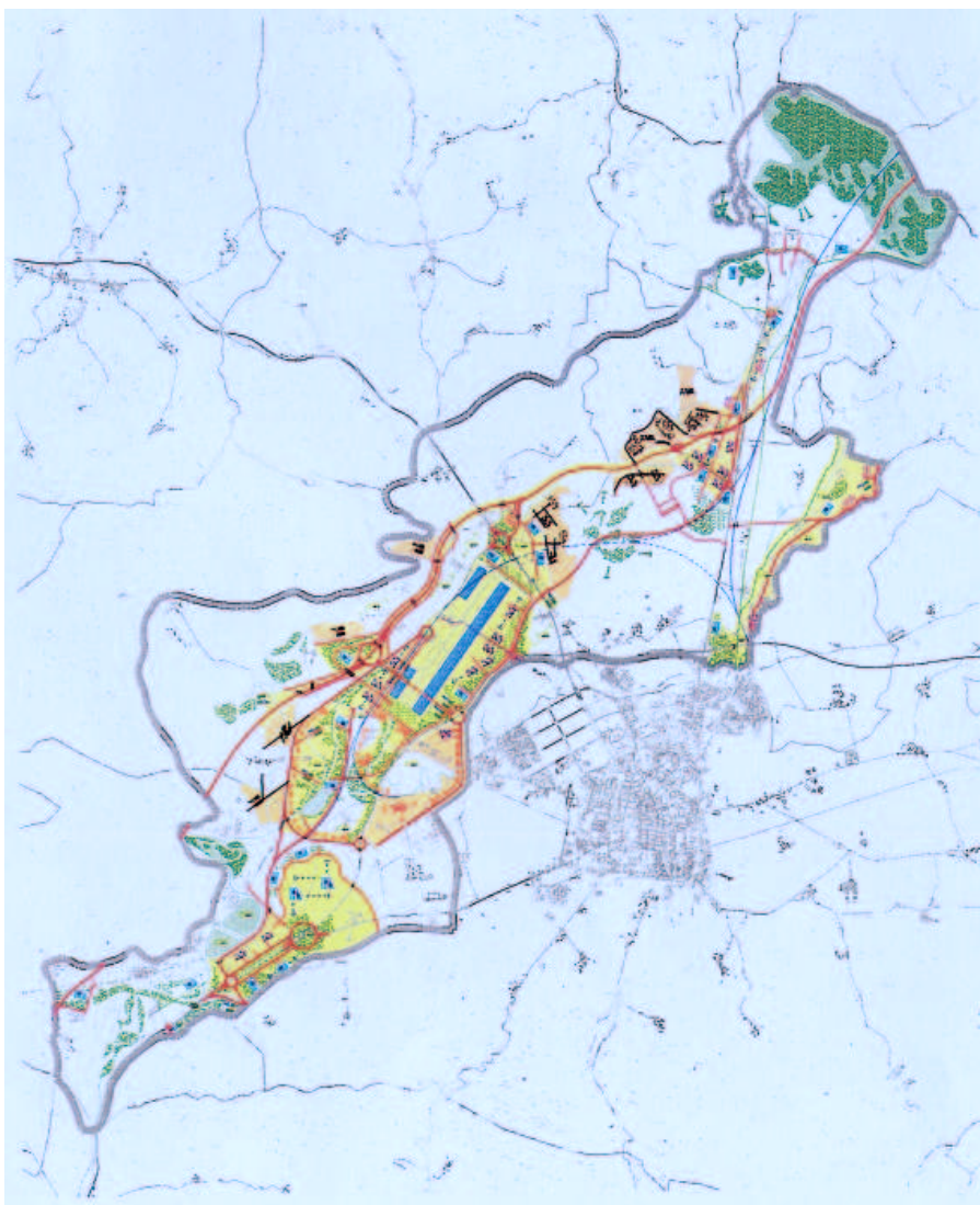
Fig. 1. Fragmento territorial B-3, que incluye el Arco de la Innovación. Espacio estratégico que funcionaría como motor del desarrollo económico territorial alavés

favor de su realización. Los que se posicionan a favor de ella argumentan que una red transeuropea no puede seguir manteniéndose por la N-1 por la saturación que supone el cuello de botella del Puerto de Etxegarate, incluso haciéndose el desdoblamiento que ya se está llevando a cabo, y por la N-1 desde Beasain hasta Donostia, en tanto en cuanto es una vía que también es utilizada para los movimientos de agitación regionales y urbanos. Dados los proyectos que se