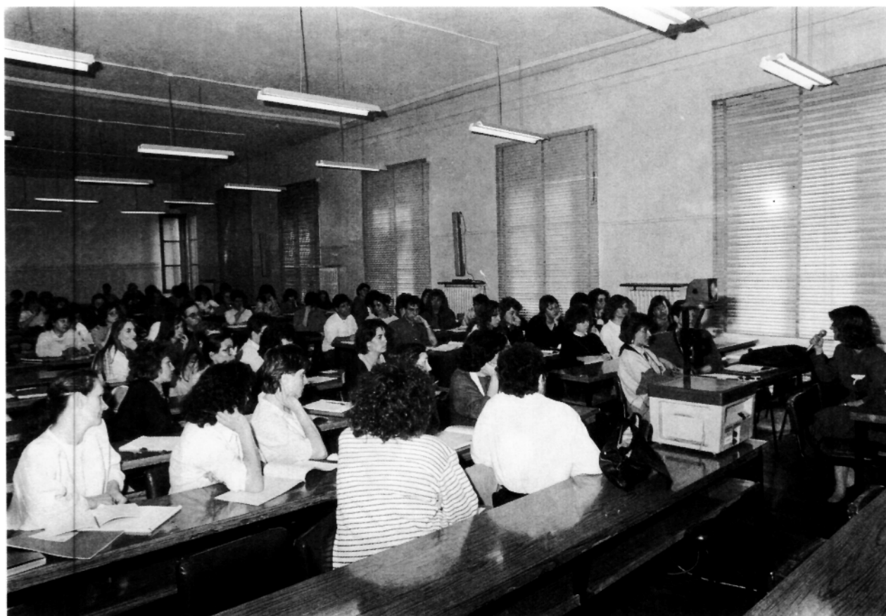
Comunicación y posterior debate en una de las Salas del X Congreso.

Instituto de Conservación y Restauración de Bienes Culturales. Madrid.