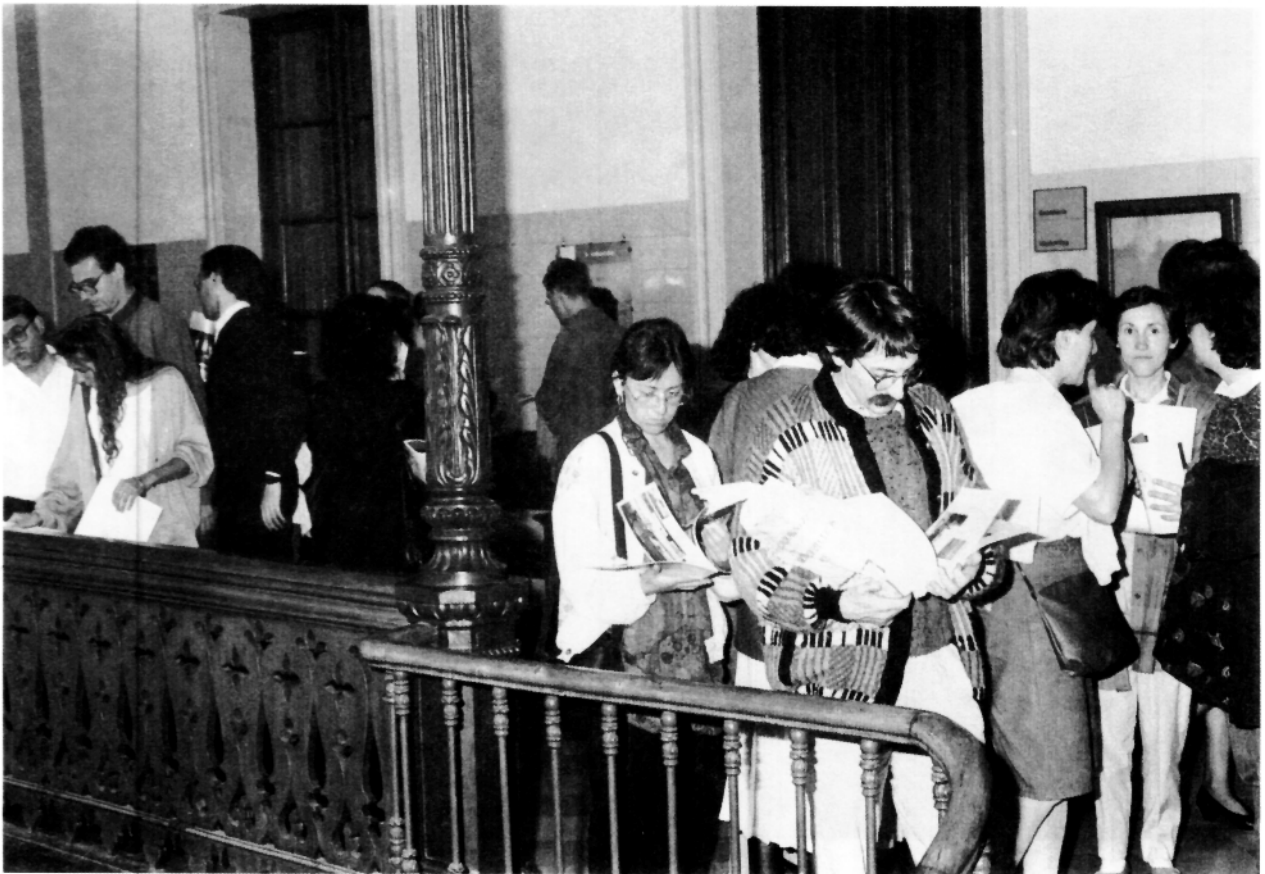
Los Congressistas y participantes asistieron masivamente a casi todas las Jornadas del X Congreso.

A) Clásicos griegos, romanos, castellanos e italianos, libros de caballería, crónicas, humanistas navarros en los primeros doscientos años de la Imprenta Navarra 1489-1689.