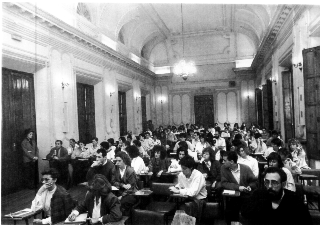
Aspecto de la Sala Principal - Salón de Actos de la Escuela Universitaria de Estudios Empresariales de Pamplona durante una de las Sesiones del X Congreso.

Las sesiones de trabajo de cada día se desarrollaron según el Programa adjunto y la asistencia a todas las sesiones fue muy regular con número aproximado de 421 Congresistas, siendo en su mayoría bibliotecarios, archiveros, museólogos, restauradores y técnicos de las diversas disciplinas congresistas. La sala de proyecciones y de vídeos contó también con una notable presencia de congresistas.