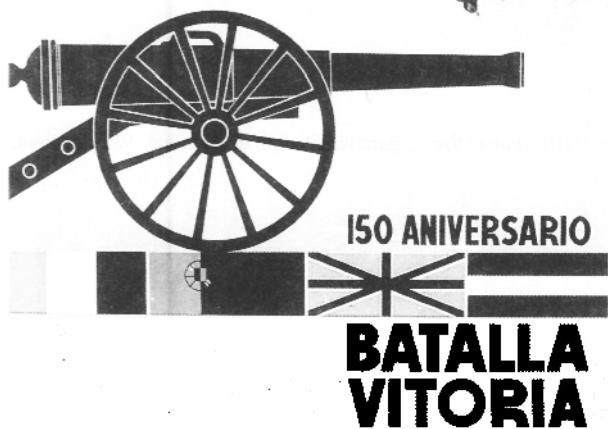
C. ZARZEÑO. Cartel conmemorativo. Vitoria, H. Fournier, 1963. 49x33,5 cms.