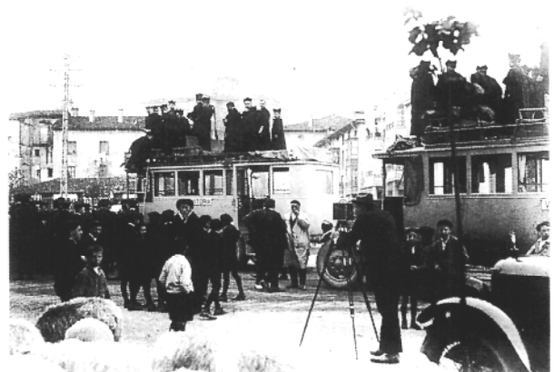
C. YANGUAS, El fotógrafo E. Guinea realizando uno de sus trabajos. Vitoria, ca. 1920. Negativo orig. 10x15 cms.

Se trata de un grupo de mucho menor volumen que los dos anteriores y, por tanto, mucho menos significativo pero que sin embargo, consideramos de interés, ya que la progresiva recogida de material de los tipos indicados (se trata de una Sub-sección de creación muy reciente) permitirá disponer de una panorámica completa en los distintos aspectos de la iconografía local.