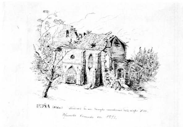
ANONIMO, Ruinas...1871 . Tinta china sobre papel 32x38 cms.