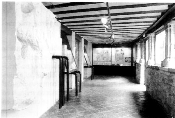
Museo de Arqueología de Alava. Museo Monográfico).

El Museo Provincial de Arqueología de Alava está ubicado en una casa-armera del s. XVI. Recoge materiales procedentes de excavaciones, prospecciones y hallazgos aislados del territorio alavés. Abierto en 1966 como Museo de Arqueología y Armería, se convierte en monográfico de Arqueología en 1975. Es, pues, un Museo de creación reciente.