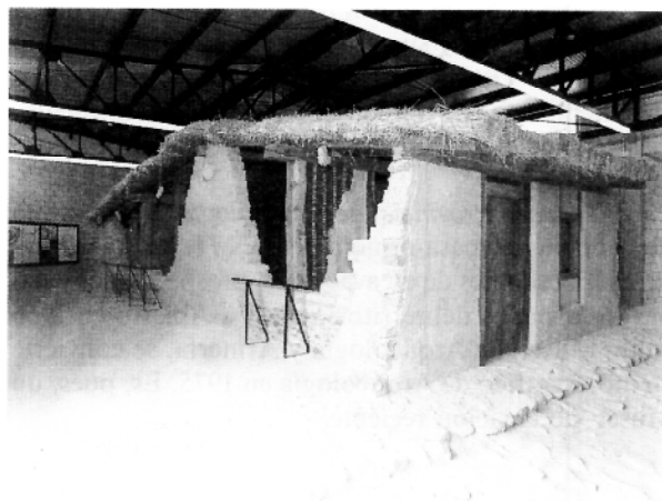
Museo del Poblado de La Hoya. Laguardia (Alava). Museo de “sitio” o de yacimiento.

El Museo cuenta con laboratorio y almacén donde reciben los primeros tratamientos los materiales de las excavaciones en curso. Este Museo es también propiedad de la Diputación Foral de Alava. Su horario de apertura al público es: De noviembre a abril de 11 a 15 horas. De mayo a octubre los laborables de 11 a 14 y de 16 a 20 horas, los festivos y domingos de 10 a 15. Los lunes cerrado.