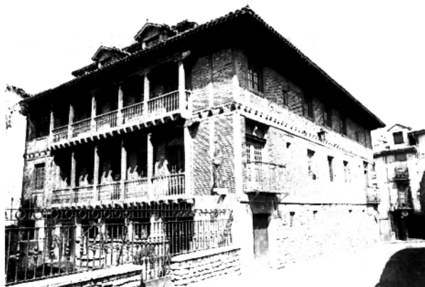
Museo de Arqueología de Alava. Museo Monográfico. (Foto archivo Museo).

También en Vizcaya se publica CUADERNOS DE ARQUEOLOGIA DE DEUSTO, patrocinada por la Universidad de Deusto, que recoge trabajos monográficos sobre Arqueología. No es de aparición periódica. Nació en 1974 y hasta la actualidad han aparecido 9 volúmenes.