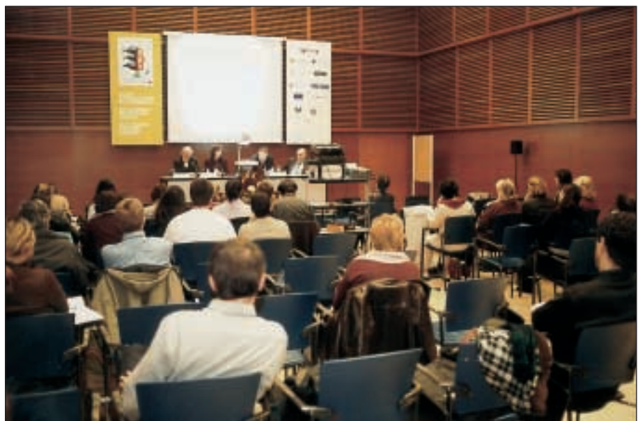
Sección 2. Aspecto de la sala durante una de las conferencias