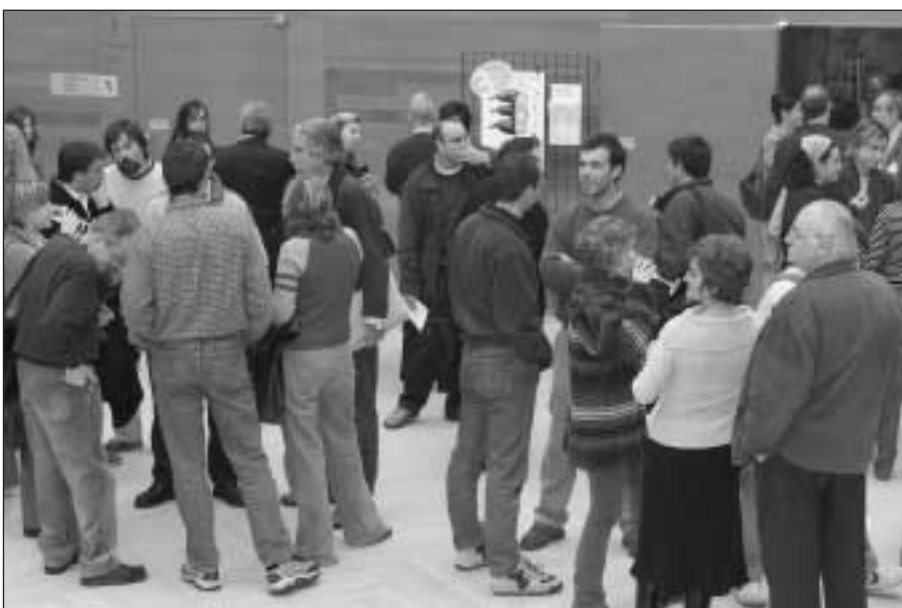
Aspecto del hall durante el descanso de una de las sesiones