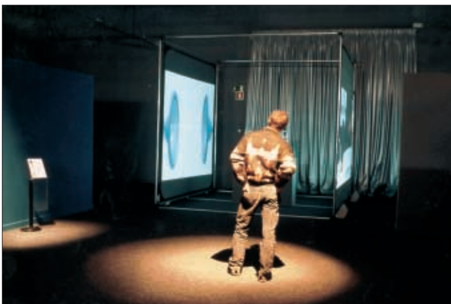
Exposición Arte Electrónico en Euskal Herria

Textos del catálogo a cargo de: Josu Rekalde, Gabriel Villota, Natxo Rodríguez y Lourdes Silleruelo.