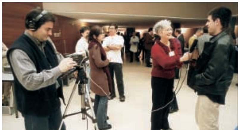
La Sección de Cinematografía realizando el vídeo del Congreso

Reseñar por último que diariamente se publicó un número extraordinario de la revista Asmoztza Jakitez con informaciones alusivas a la marcha del Congreso.