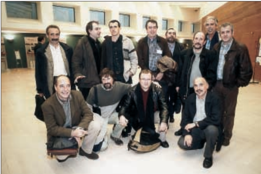
Secciones 3 y 4. Participantes y coordinadores de las secciones