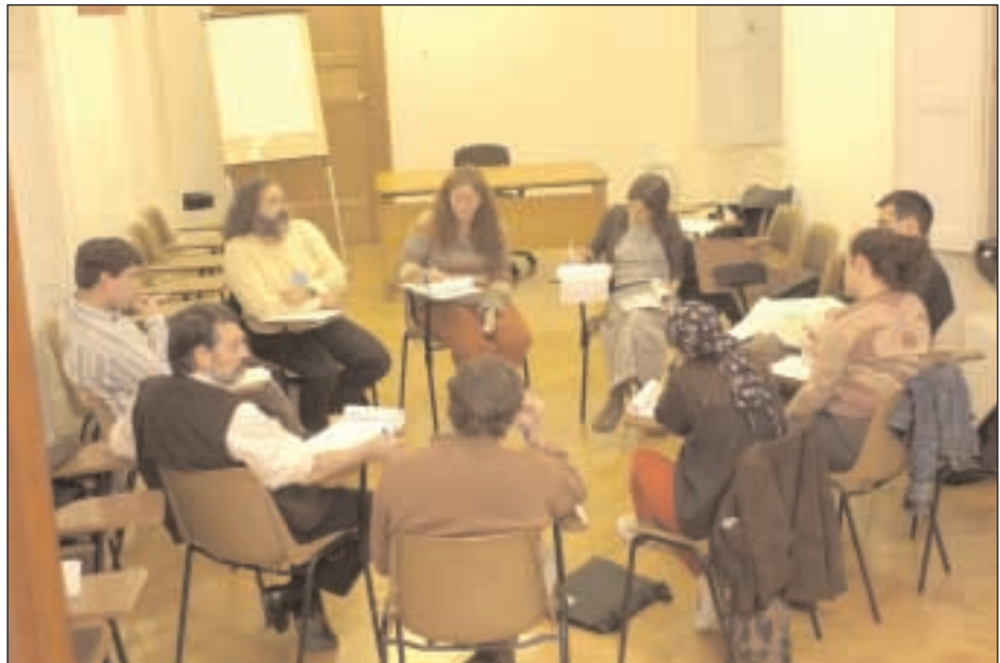
Sección 3. Uno de los talleres de trabajo