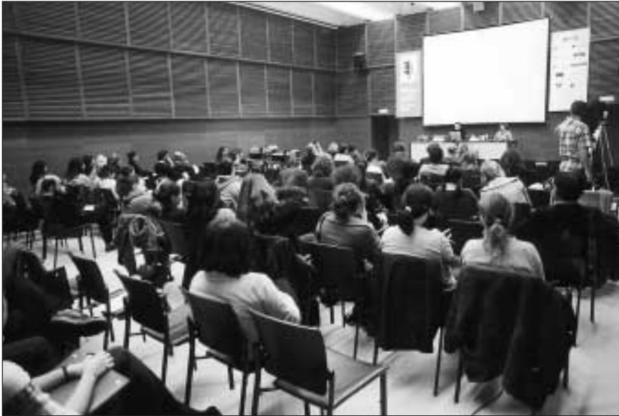
Sección 1. Aspecto de la sala durante una de las conferencias