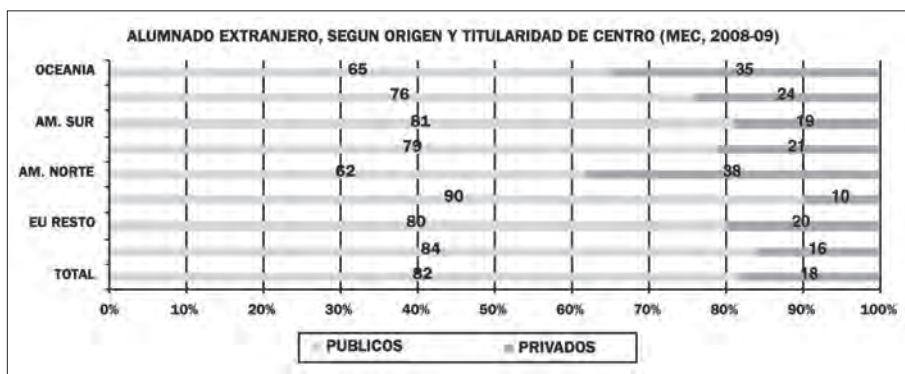
Gráfico 1. Alumnos extranjeros según origen y tipo de centro

Si tenemos en cuenta el alumnado inmigrante, la escolarización en los dos tipos de centro (MEC, 2009) para el curso 2008-2009, se realiza de la siguiente manera: centros públicos 82% y centros privados 18%. Es decir, los alumnos inmigrantes se escolarizan en mayor medida que la media estatal en los centros públicos (15 puntos por encima).