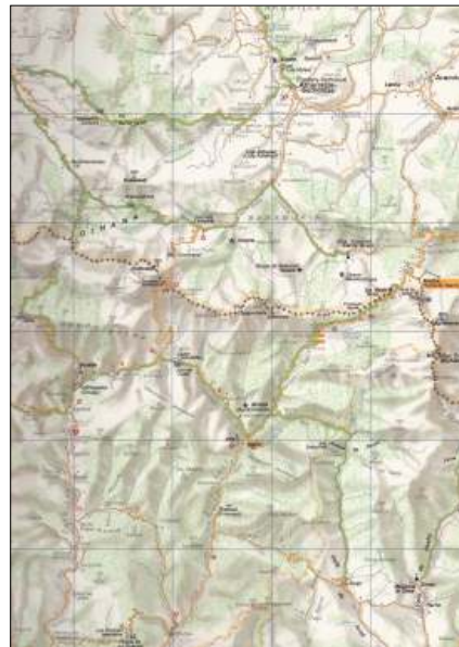
Ruta de la trashumancia de Altzürükü a los pastos de Ahüzki.

La fiesta de la trashumancia a los prados de Ahüzki es singular por varias razones. Concierno al traslado de reses de la raza Blonde d'Aquitania, que se crían para carne. Los ganaderos que participan son los socios de la cooperativa Axuria, con sede en el Matadero de Mauleón donde se elaboran las viandas que luego los ganaderos mismos venden directamente al consumidor bajo la denominación Idikia. La fiesta se celebra un sábado de Junio, se anuncia en los