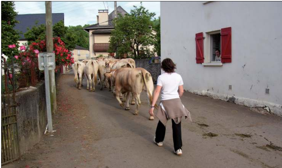
Atravesando Altzürükü de camino al bosque Arbaillak (Kepa Fdez. de Larrinoa).

Según el marco europeo descrito arriba un proceso de patrimonialización consiste en el reconocimiento por parte de la administración de que una esfera de relaciones sociales, o un objeto o conjunto de objetos con significación propia dentro de uno o varios ámbitos de relaciones socio culturales locales, son susceptibles de crear riqueza económica una vez convertidos en mercaderías a circular en un mercado de la cultura, normalmente de mayor amplitud que la circunscripción socio económica de donde proceden, que es limitada y se encuentra particularmente abatida.