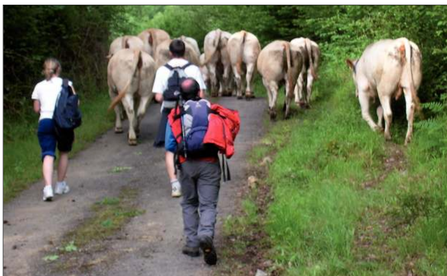
Atravesando el bosque Arbaillak (Kepa Fdez. de Larrinoa).

La seguridad alimenticia es un asunto que requiere de los gobernantes de los países occidentales una atención especial, y llega como consecuencia de los