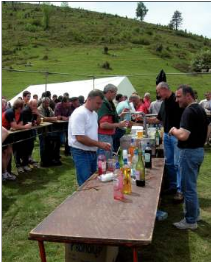
Relaciones socio-comunitarias: aperitivo en las campas de Ahúzki (Kepa Fdez. de Larrinoa).

en que se inserta la confluencia del patrimonio cultural y el desarrollo local; análogamente, después he argumentado que el eje agro técnico y científico contribuye a instaurar imágenes discursivas con que patrocinar la calidad de un alimento; asimismo, ahora señalo que también se fraguan procesos discursivos al ensalzar simultáneamente un comestible y el entorno que le da origen 18 .