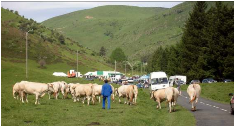
Llegado del hato a Ahüzki (Kepa Fdez. de Larrinoa).

Los promotores de Idikia se apoyan en el cuidado y aseo del proceso técnico de producción, participando vivazmente en un juego de imágenes dicotómicas entre alimentos 'saludables' y 'perniciosos' o 'de riesgo' para la salud humana. Conectan con la retórica contemporánea de los departamentos de agricultura y desarrollo rural europeos que auxilian a los productos locales económica y publicitariamente. Igualmente, quisieran acomodarse en la cesta de la compra de los consumidores que optan por el alimento agro ganadero de elaboración artesanal y familiar frente al industrial y masivo; es decir, llegar a los consumidores que entienden que la industrialización agro ganadera implica el empleo intensivo de sustancias químicas y que éstas devalúan la calidad del producto, haciendo que el riesgo de insalubridad aumente.