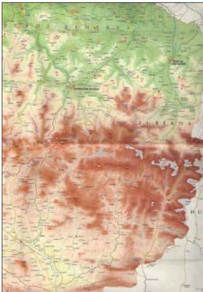
Región suletina y bajonavarra.

Al llegar el verano muchos ganaderos envían sus hatos de ovino, bovino y caballar a los pastos de los puertos de alta montaña. Entre Soule y Baja Navarra, Ahüzki es un lugar donde los pastizales y las majadas delimitan un paisaje cuya ordenación socio cultural responde a los dictados de olha [euskaraz] o cayolar [dicho en lengua francesa], que es un sistema de aprovechamiento ganadero particular de la montaña suletina y otras áreas de la región pirenaica.