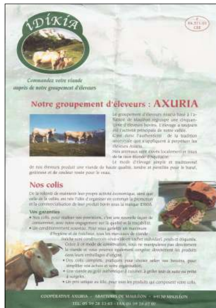
Prospecto publicitario del producto Idikia.

Al mediodía, ya en Ahüzki, se celebra una misa. Seguidamente, bailarines de Altzükü ejecutan danzas suletinas y los presentes se aúnan e interactúan en un espacio habilitado para la toma de refrigerios y bebidas aperitivas. También se instalan carpas que albergan un comedor, cocina y otros servicios. Los asistentes que lo deseen son servidos una comida centrada en los productos de carne Idikia. Y con el tiquete de la comida los comensales recolectan una hoja que explica las virtudes de los alimentos cárnicos Idikia. En las primeras ediciones de la fiesta se incluyó una pequeña exhibición con fotos y paneles explicativos de los sistemas agro pastorales de montaña. Lo novedoso en 2006 fue que tras la comida se programó un recital de cantos suletinos que varios jóvenes de distintas localidades interpretaron ante el público presente.