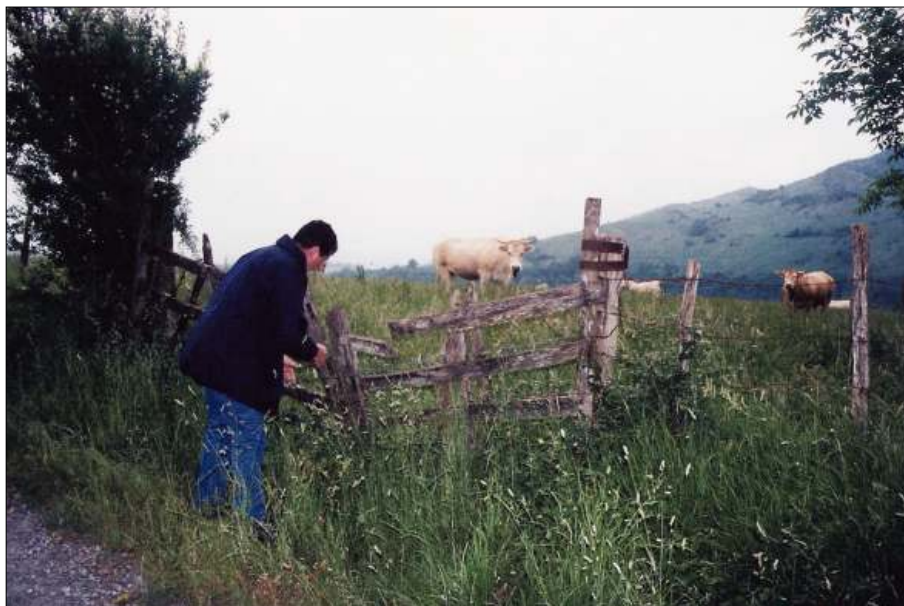
Recogiendo el ganado para la ruta de la trashumancia (Kepa Fdez. de Larrinoa).

He glosado las características de este eje en otro artículo, por lo que ahora simplemente resumo lo escrito entonces 1 . La construcción de la Comunidad Europea ha acarreado mucha actividad administrativa y estructural, al igual que