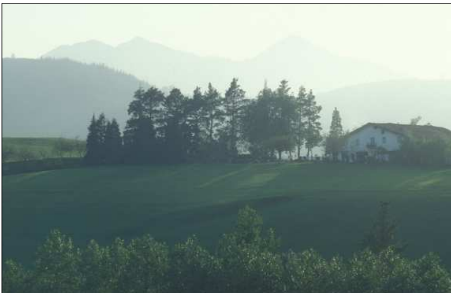
Zelaiaren berde tartean, baserria

Konjuru egitea eliza nagusiko apaiz batek egin ohi zuen eliza ataritik, eta arriskua zetorren aldera begira, ohiturak agintzen zuenez. Gauzak horrela,