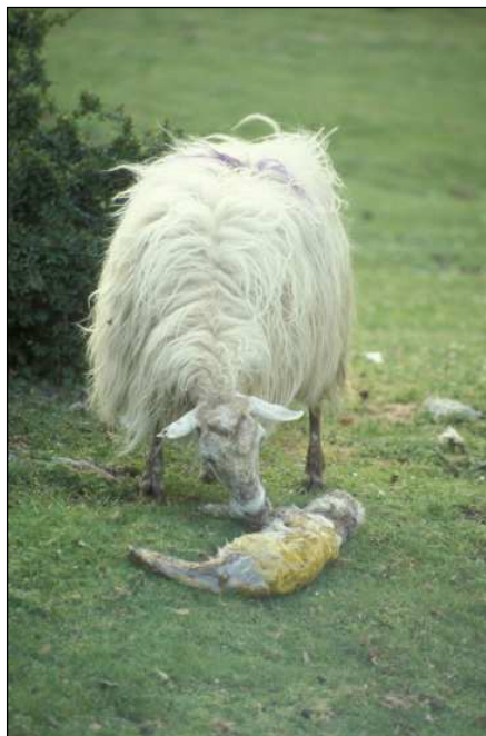
Ardia eta arkumea

«Gorraiz aldera» esapidea oso ezaguna da eskualde honetan, baina konjurugilearen haserrea ez zidaten Imizkora –gaur egun ia biztanlerik ez duen Nafarroako herriska– eginiko bisitaldian aipatu 101 .