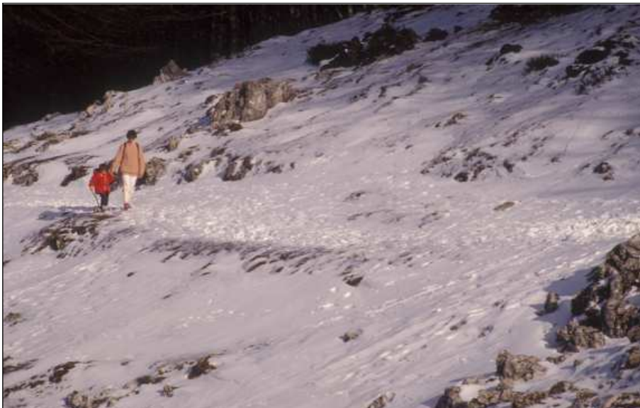
Negua, konjuroen urtaroa