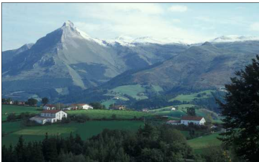
Baserriak mendiaren babesean

Xedapen zahar hori irakurrita –bertan biltzen da maiatzeko Gurutze Santuaren egunetik iraileko Gurutze Santuaren egunera konjuruak egin beharra–, gogora etorri zait Arabako Done Bikendi Harana herrian egin izan den mayo-