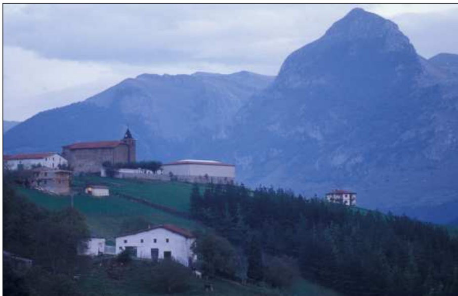
Txindoki eta bere misterioa

apaiz batek akolito batek lagundurik baserriz baserri egiten zituen konjuruak. Akolitoaren ardurapean, bi saski handi garraiatzen zituen astoa. Asto saski horietan haragia, arrautzak, babarrunak eta abar biltzen zituen apaizak konjuruaren ordain moduan. Adierazitakoaz gain, familia bakoitzak oilasko parea eramaten zuen konjurugilearen etxera, eta hala esaten zuten: «Konjuruaren partez, oilaskoak».