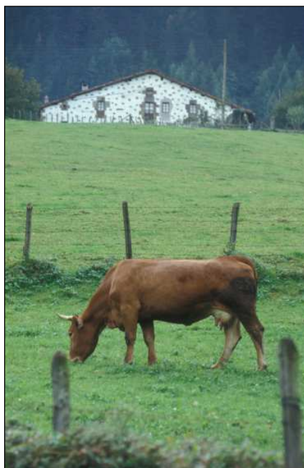
Baserría eta aberea

Euskal Herria aztergai harturik, Azpeitiari dagokion Nuarbe aldean bildu dudanaren arabera –auzo horrek parrokiarik ez zuen garaiaz ari naiz–, udaberrian, Urrestillako