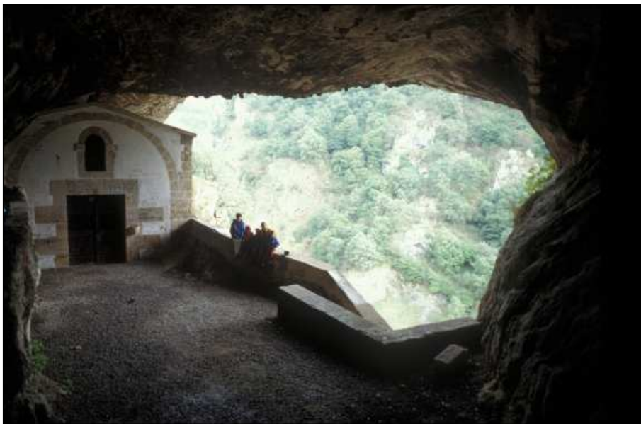
Ermita harkaitzen erdian

«San Tiburtzio egin ezak euria, gainerakoan amuarrainek potroak jango dizkiate». Hurrengo egunean harrijasa erauntsiak soro guztiak txikitu zituen 74 .