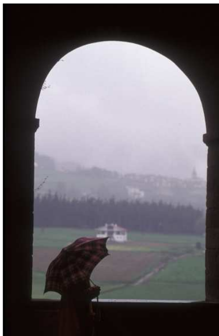
Euria eta konjuroa

Orduan apaizaren erantzuna honela izan zen: «Han, garosailetik egin nian konjurua». Hau entzutean, baserriarrak erantzun: «Nik leihotik bidali nituen oilaskoak» 71 .