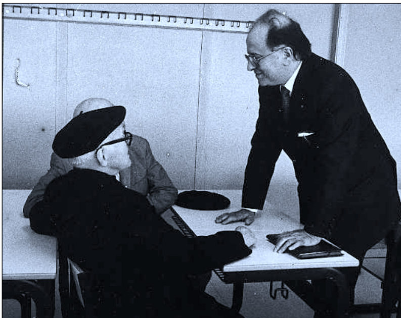
Jardun akademikoa hasi aurretik, egilea Jose Migel Barandiaranekin solasean.