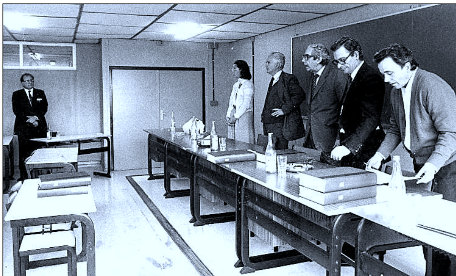
El doctorado ante su tribunal calificador.