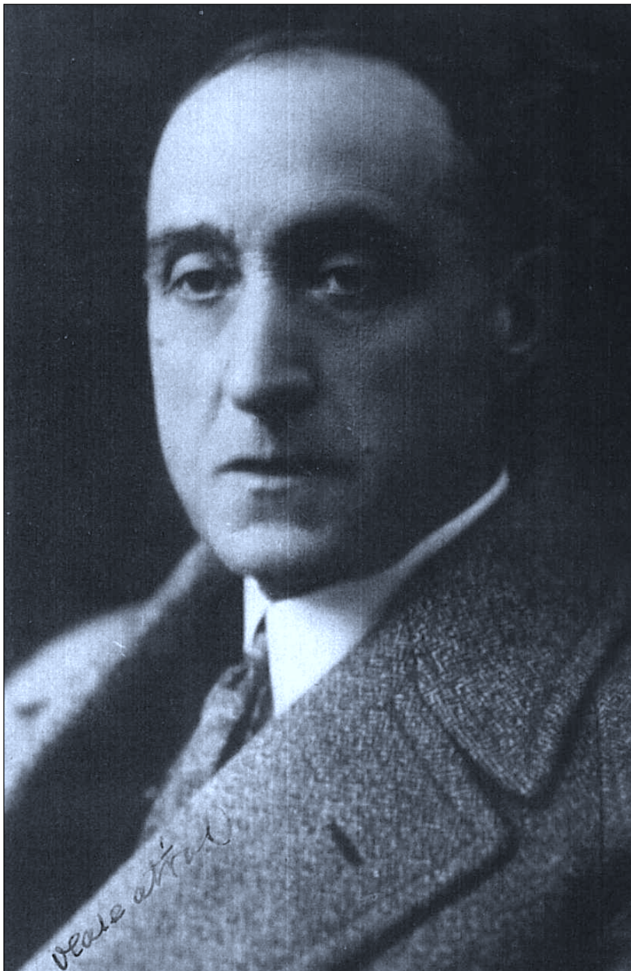
El poeta Emeterio Arrese