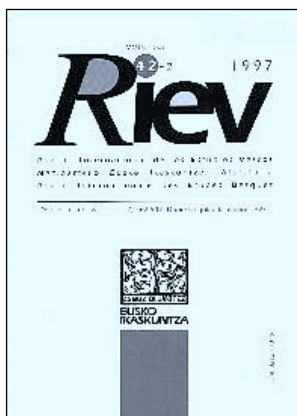
Elizaren gaiak testo zahar baten / Juan Garmendia Larrañaga. - En : Revista Internacional de los Estudios Vascos . - Donostia : Eusko Ikaskuntza. - T. 42, 2 (1997), p. 367-377