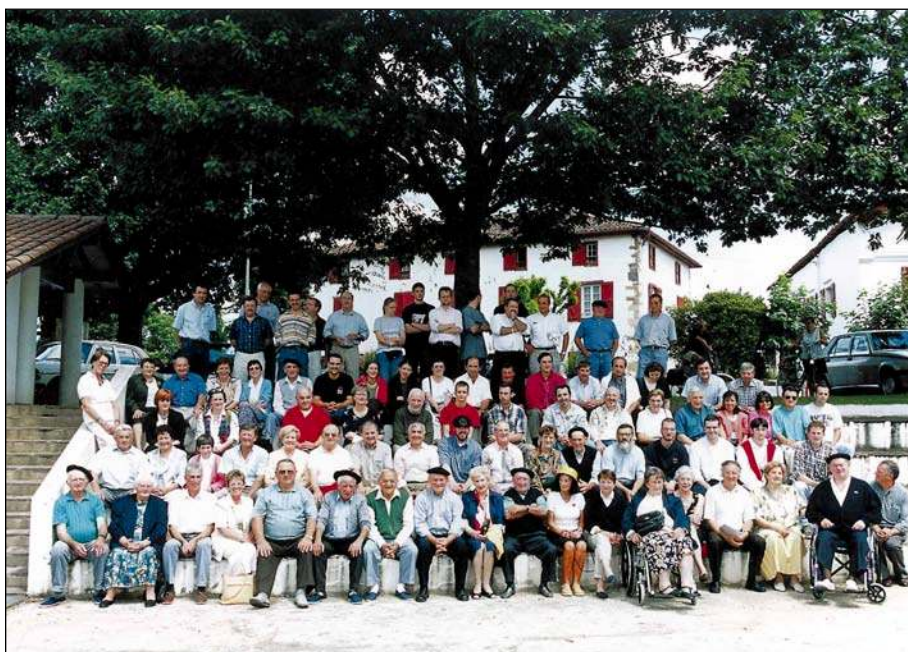
2000garren urteko uztaillaren 16an Senperen bigarren kantu zaharraren eguna, OXTIKENEKOEK antolatua.