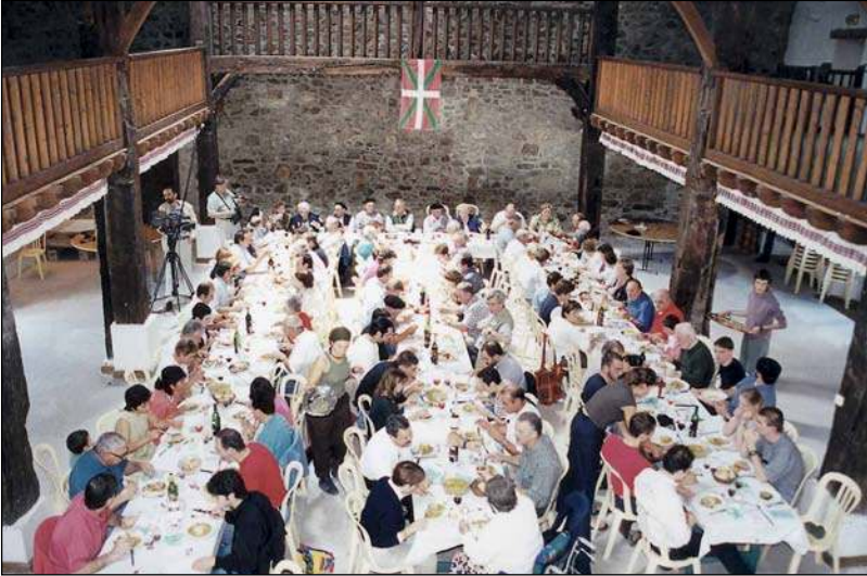
2000.07.16. Kantu zaharraren eguna. Bazkaria