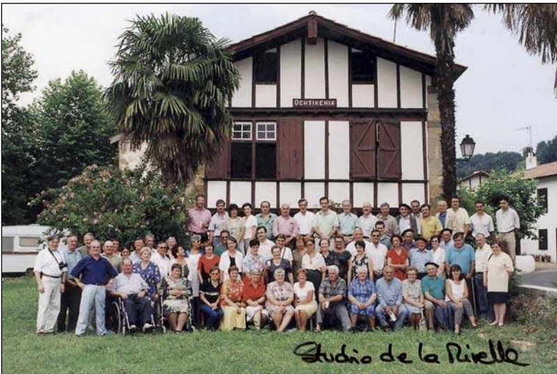
Oxtikenea, 1999.07.11. I. go kantu zaharraren eguna