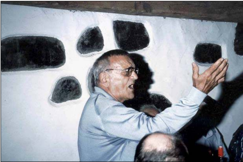
2000.07.16. Bergara Ganizon "Txistu"