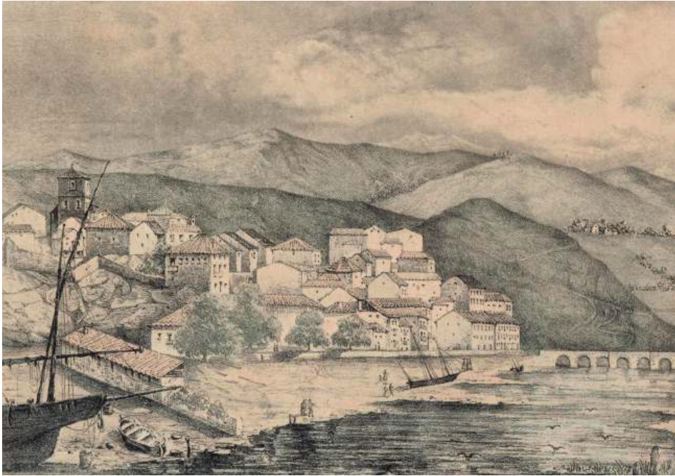
Plentzia, (1846) Juan Eustakio Delmasen marrazkia eta litografia, ondoko liburuan argitaratua: Viaje pintoresco por las provincias Vascongadas: [obra destinada a dar a conocer su historia y sus principales vistas, monumentos y antigüedades, etc., en láminas litografiadas copiadas al daguereotipo y del natural por J.E.D. y acompañadas de texto. Bilbao, Imprenta N. Delmas, 1846. 51 orr.

bizi ohi zen. Orduko familian eguneroko bizipena dugu itsasoen barrena esperientzia globalak izatea eta ezagutzea.