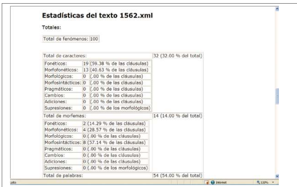
Fig. 6. Ejemplo de visualización de porcentajes extraídos del texto de 1562

Los porcentajes son presentados del siguiente modo: