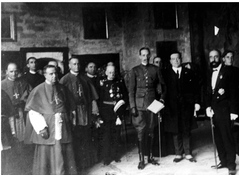
Pamplona, 1920. II Congreso de Estudios Vascos. El Rey Alfonso XIII junto a las autoridades civiles y eclesi3sticas.