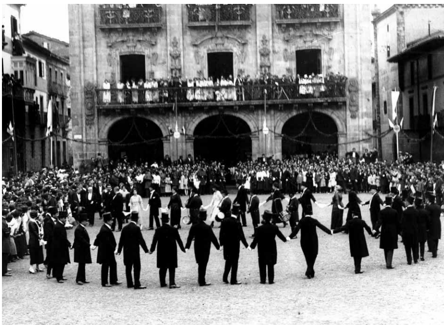
Oñate, 1918. Primer Congreso de Estudios Vascos. Auresku de autoridades (Fototeca Kutxa).

El primer Congreso de Estudios Vascos en septiembre de 1918 significó el acta de fundación de un tipo de articulación de la comunidad científica vasca. Desde 1852, por iniciativa de A. Abbadie, se sucedieron los Juegos Florales, las competiciones poéticas y fiestas euskaras. Los periódicos y revistas culturales desde 1840 alcanzaron una creciente difusión porque nuevos sectores sociales de las ciudades se incorporaron a su consumo. En la Vasconia continental, Eskualtzaleen Biltzarra, (1901) logró la articulación de un grupo singular de estudiosos vascólogos.