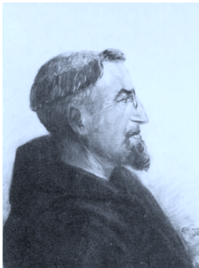
Retrato al óleo realizado por Madame Ducot en Ainhoa. Hotel Ohantza. Septiembre 1934. En la actualidad el cuadro pertenece al Museo Vasco de Bayona.