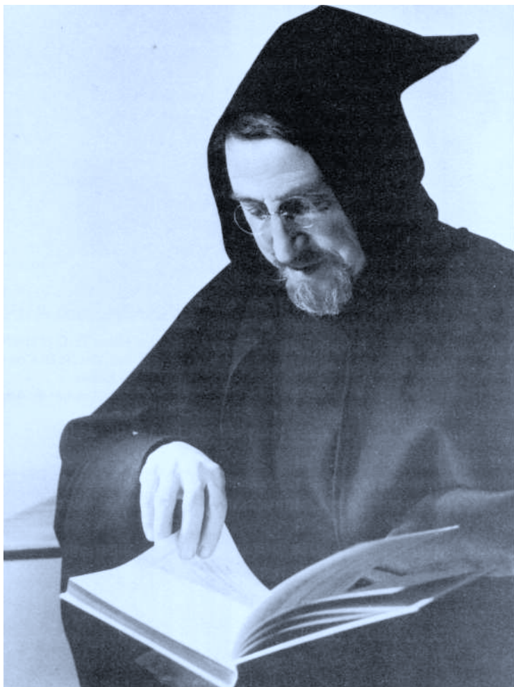
Fotografia: Pedro Mari Irurzun. Pamplona