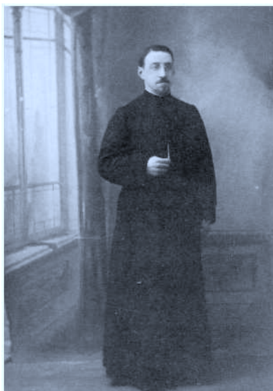
En París el año 1920-21 con dulleta de clérigo francés.