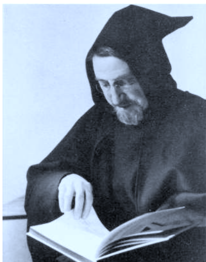
P. Donostia el 25 de Mayo de 1944. Fotografía: Pedro M.ª Irurzun. Pamplona.