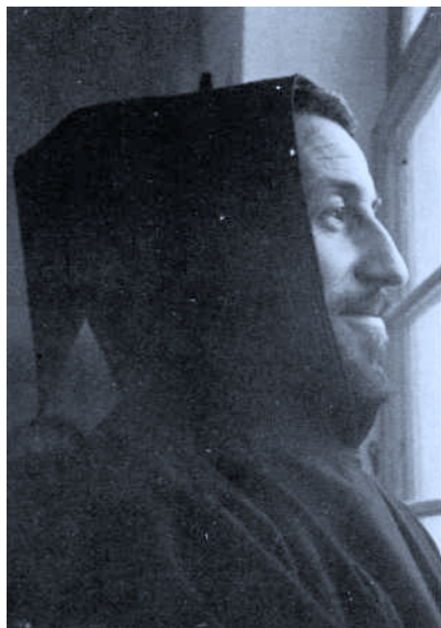
Primeros planos del P. Donostia. Madrid. 1922-23.