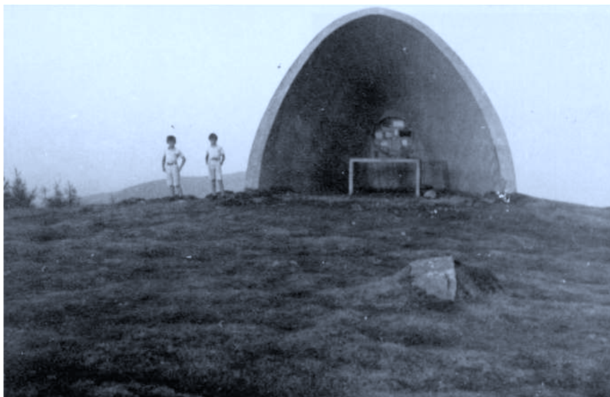
Monumento al P. Donostia en Aguiña. Oyarzun. Arquitecto: Luis Vallet.