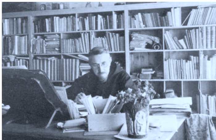
El P. Donostia en su estudio de Lekaroz. 1926-30.