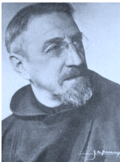
Primeros planos del P. Donostia. Madrid. 1922-23.