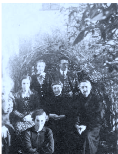
En Askain, con su madre, hermanos y sobrinas.