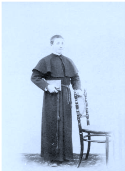
Recién ingresado en Lekaroz con su hábito de estudiante. Año 1898.