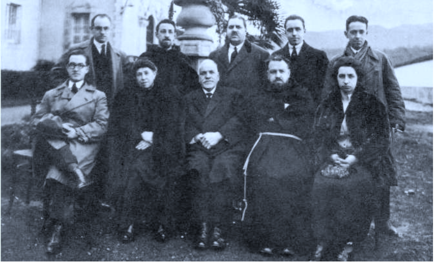
El P. Donostia con su familia, padres y hermanos.