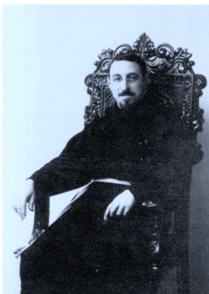
El P. José Antonio de Donostia en 1915 cuando conoció al Maestro Pedrell.