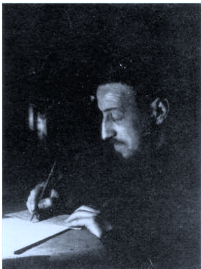
El P. Donostia en su celda del Convento de Madrid. 1926.