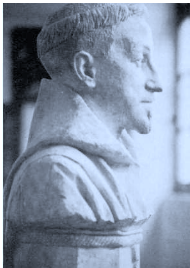
Busto del P. Donostia realizado por Marta Spitzer, judía de origen alemán. 1920-21. Colegio de Lekaroz. Fotografía: Fernando Larruquert.