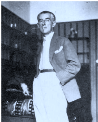
Fotografía de Maurice Ravel dedicada al P. Donostia.