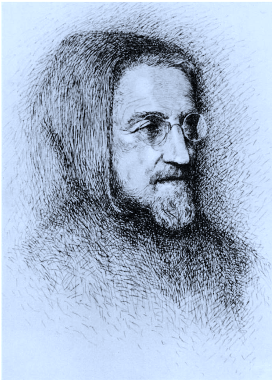
Grabado del P. Donostia de J.V. Latour sobre dibujo de M. Ribas, realizado hacia 1956.