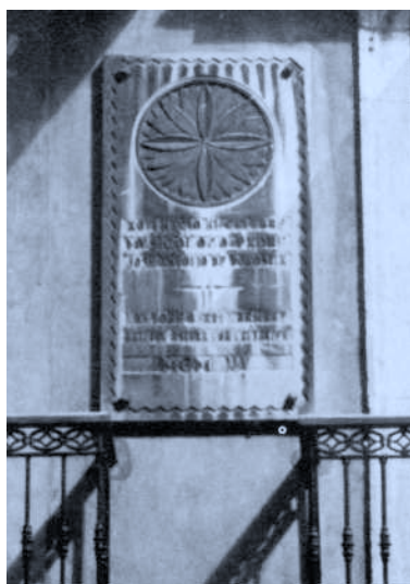
Placa conmemorativa de la Casa nativa del P. Donostia, calle Idiáquez, 5-1.º de Donostia.