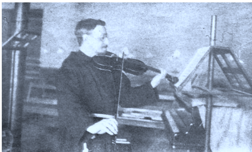
El músico tocando el violín en su estudio de Lekaroz.