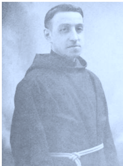
P. Donostia. Hacia 1910-12 en el Colegio de Ntra. Sra. del Buen Consejo. Lekaroz.