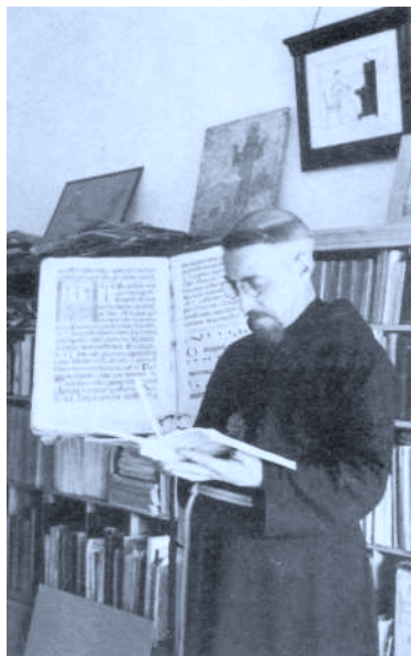
El P. Donostia en su estudio de Lekaroz. 1926-30.