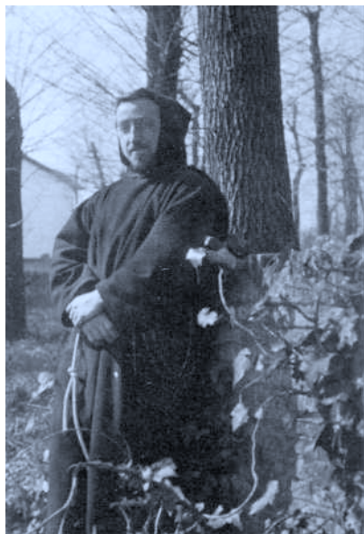
El P. Donostia en el Correccional de Carabanchel dirigido por los PP. Terciarios Capuchinos. Madrid. 1922-23.