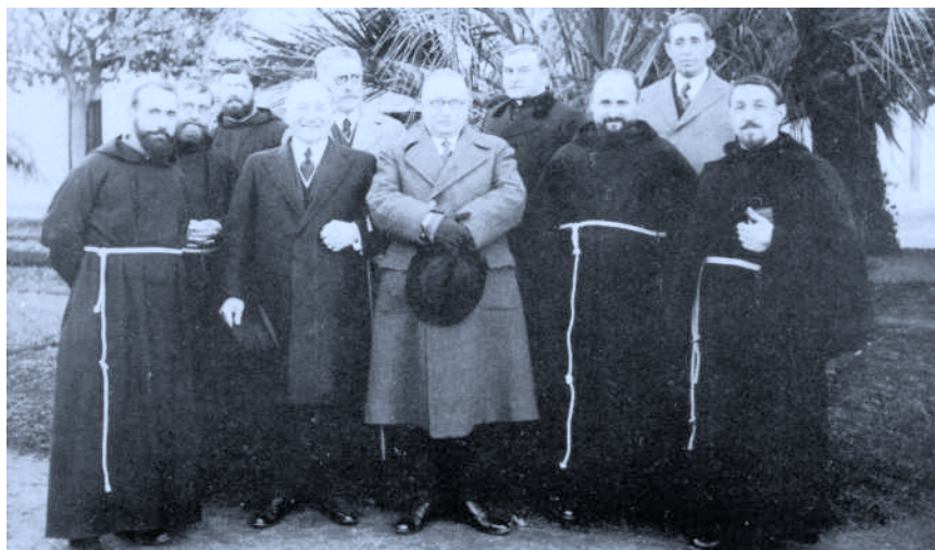
El P. Donostia en su viaje a la Argentina en el Colegio de Euskal-Etxea rodeado de profesores y miembros de la Comisión Directiva. Año 1924.