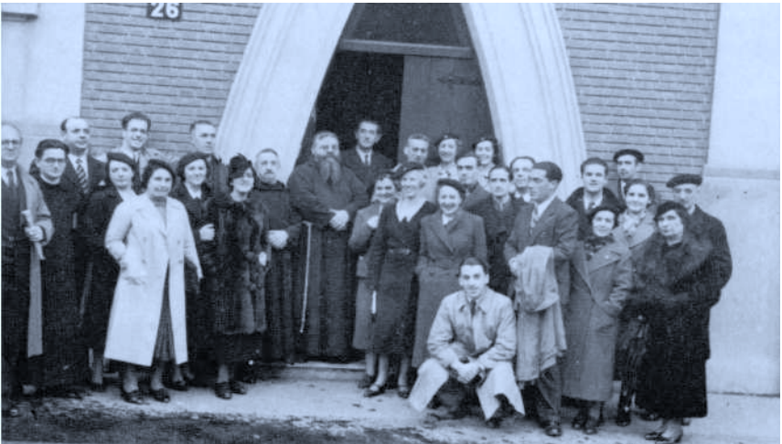
El P. Donostia con la Coral Eresoinka en Paris. 22 de Mayo de 1938. En la puerta del Convento de los PP. Capuchinos de Rue Boissonade.