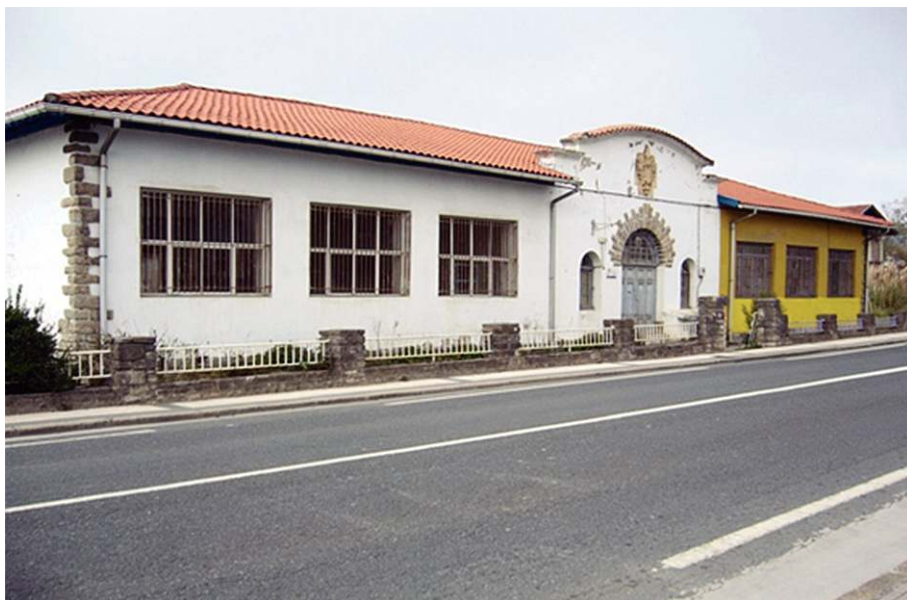
1go. ir. 2006ko irudia, bertan ikus daiteke elkartearen eraikina kontzertu aretoa eraiki baino lehen. Horiz margotutako zatia, taldeen entsegu lokalak dauden zatia da.

Elkartea udalak eskainitako eskola zahar baten eraikinean kokatuta dago. Garai horretan elkarteak eskolaren eraikinaren erdia suposatzen zuen bakarrik, beste erdia lan hezkuntzarako erakunde batek erabiltzen zuen, iturgintza, igeltserotza, etabarreko ikastaroak emateko. Baina erakunde honek eraikinaren beste erdi hori utzi eta elkarteko zenbait kideri bururatu zitzairen beste erdi hori erabili zitekeela elkartearen proiektu berrirako. Proiektu berri horretan, kontzertu areto bat, grabazio estudio bat eta irrati bat sartzen zirelarik. Horrekin batera taberna txiki bat sartzen zen, kontzertuetan dirua lortzeko asmoarekin. Baina helburu hori betetzeko dirua behar zen eta diru hori bakarrik erakunde publikoek eskaini zezaketen eta horretarako proiektu bat aurkeztu behar zitzairen. Baina nola lortu zezaketen proiektu erakargarri bat dirutza gastatu gabe?