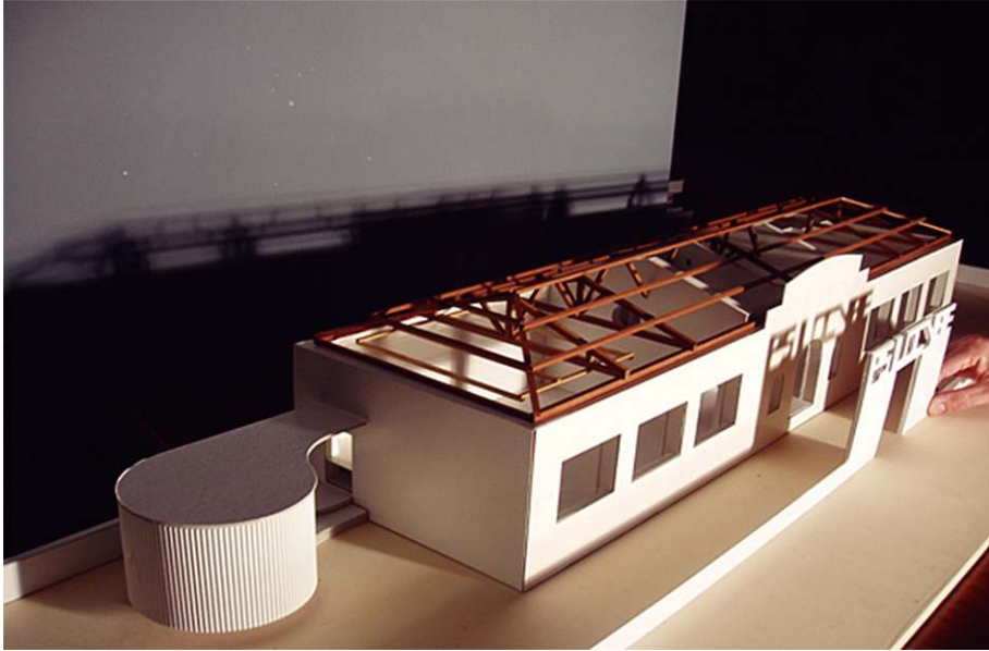
3. ir. Proiektuaren maketaren irudia. Bertan ikus daiteken eraikin zirkularra, irudiaren ezker aldean, irratria eta taldeen aldageletara zuzendutako eraikina da. (Santiago Noainek eskainitako irudia, 2006).

Elkartearen etorkizuna oparoa da, musikak bere sareak etengabe zabalzen dituelako, gainera elkartearen indarra bere irabazi asmorik gabeko izarran datza. Inork ez du dirua irabazten elkartearentzako egiten duen lanagatik, baina etekin handiak lortzen ditu. Gainera, elkarteko kide izateko jadanik ez da beharrezko musikaria izatea edo musika jotzea, musika bere zentzu zabalenean sortzeko gogoia nahikoa da eta horrek eragin zuzena izan du musika jotzen ez duen jende asko elkartera hurbildu dadin. Azken finean musika egiteko eragile asko behar baitira.