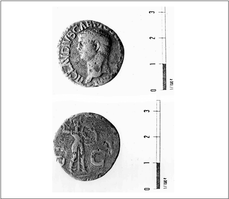
Fig. 1. Anverso y reverso de la moneda.

Estas acuñaciones fueron denominadas “de imitación”, pues al estudiar las emisiones realizadas en Britannia y Gallia, se pudo comprobar su tosquedad y falta de calidad respecto de las de la ceca de Roma. Sin embargo, J.M. Gurt prefiere hablar para las emisiones realizadas en Hispania de monedas “de acuñación local” por ser de un estilo bastante mejor.