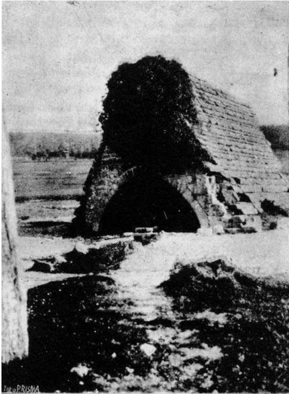
Pozo público en Tajonar (Navarra)

larmente? Y aun más sencillo: ¿Por qué no disponer una cubierta a dos vertientes cuya cresta se apoyase en la de la bóveda apuntada interior? Esto es lo normal en Navarra y he aquí el motivo por el cual esa construcción atrae nuestra atención desde el principio. Esa