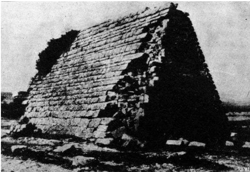
Pozo público en Tajonar (Navarra)

La construcción de que se trata es simplemente la cubierta del pozo que abastece de agua potable a Tajonar. En una de las foto-