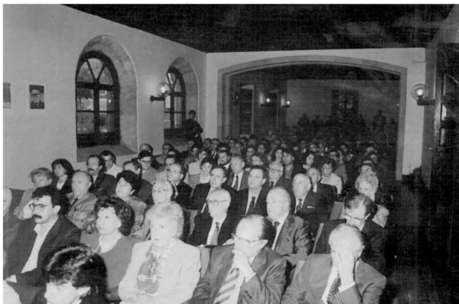
Euskal Herriko Ikerketa eta Zientzi Zentrueri buruzko Kongresuaren aurkezpena. Presentación del Congreso sobre los Centros de Investigación y Ciencia de Euskal Herria.