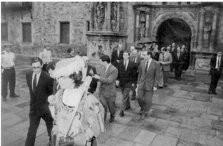
Ibilaldi zibikoa Unibertsitatetik Santa Ana Auditoriumera. Procesión cívica de la Universidad al Auditorium Santa Ana