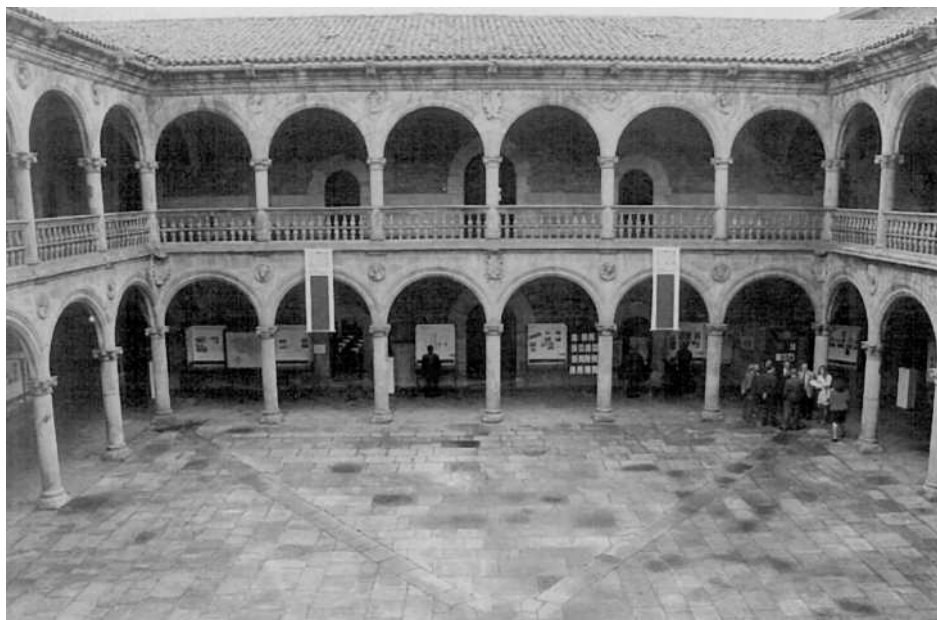
Eusko Ikaskuntzaren Iragana, oraina eta geroaren erakusketa Oñatiko Unibetisitatego klaustroan. Exposición de Eusko Ikaskuntza: Pasado presente y futuro, en el claustro de la Universidad de Oñati.