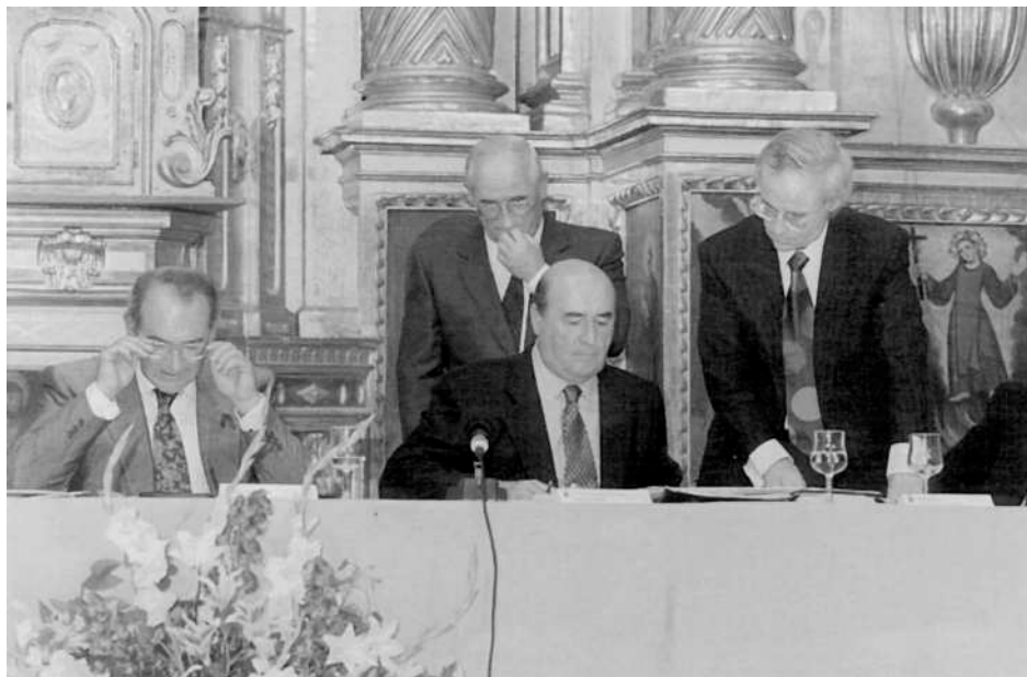
Araba, Bizkaia eta Gipuzkoako Merkatal Ganbarekin hitzarmenaren sinaketa. Firma de convenios con las Cámaras de Comercio de Alava, Bizkaia y Gipuzkoa.