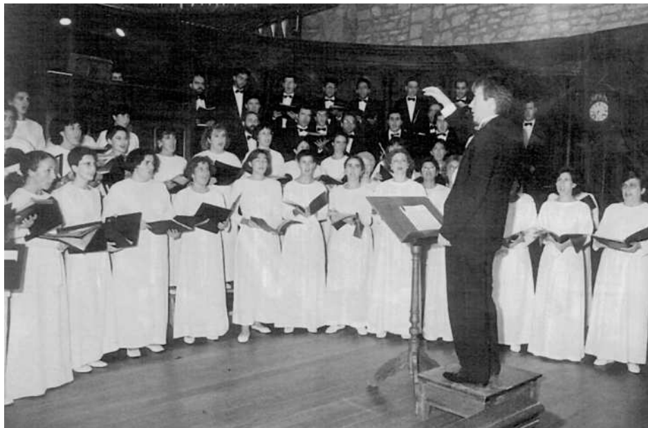
Donostiako Orfeoiaren kontzertua. Concierto del Orfeón Donostiarra.