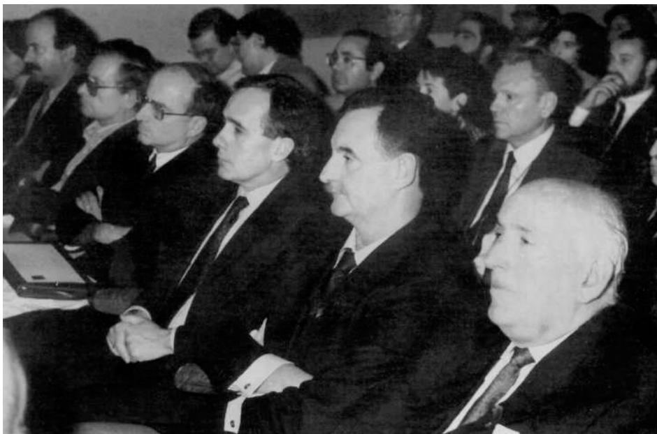
Euskal Herriko Ikerketa eta Zientzi Zentruen buruzko Kongresuaren aurkezpena. Presentación del Congreso sobre los Centros de Investigación y Ciencia de Euskal Herria