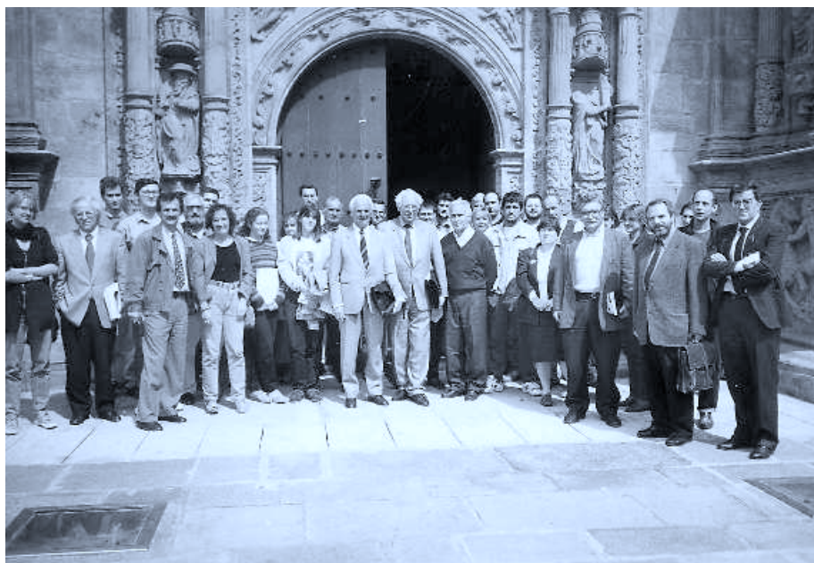
Oñati, 1995.09.06. Participantes del Curso W. von Humboldt: Un puente entre dos pueblos en la entrada de la Universidad de Oñati.