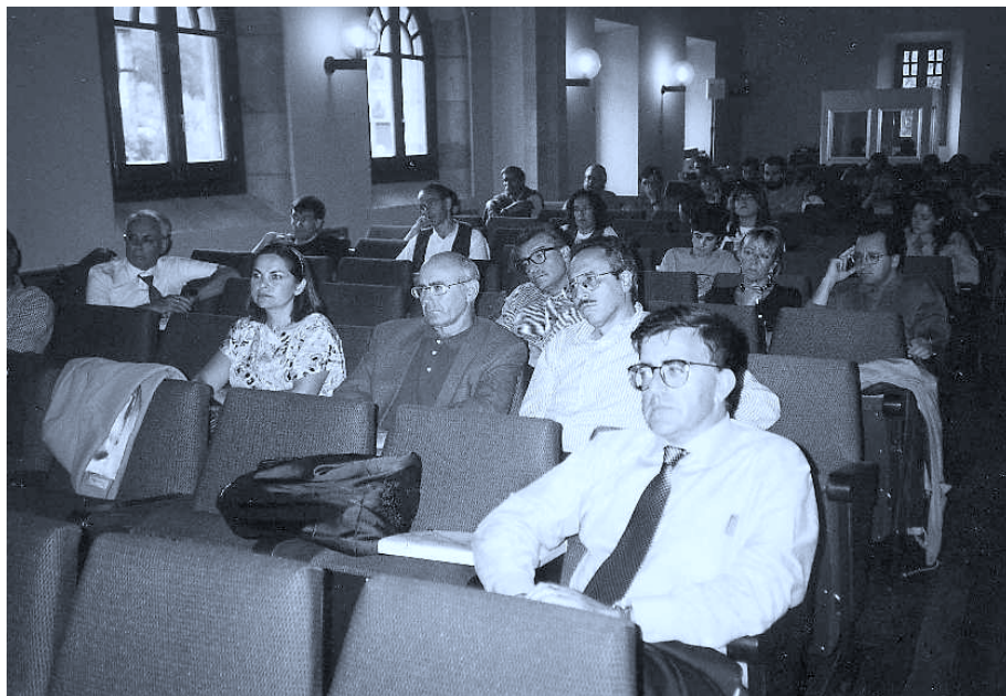
Oñati, 1995.09.05. Aspecto de la Sala