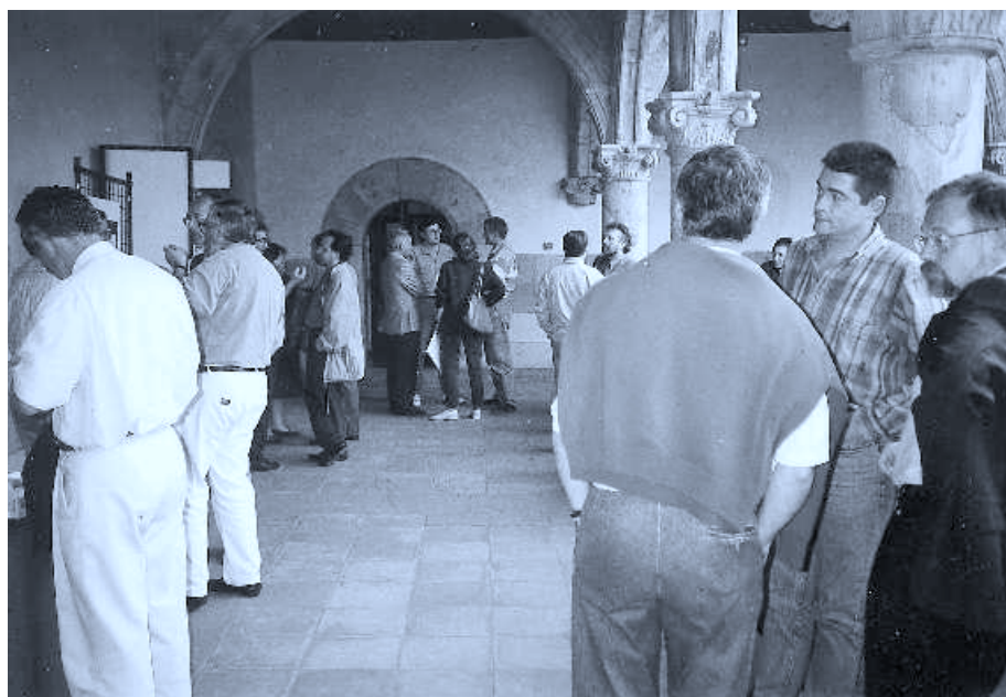
Oñati, 1995.09.06. Descanso del Curso