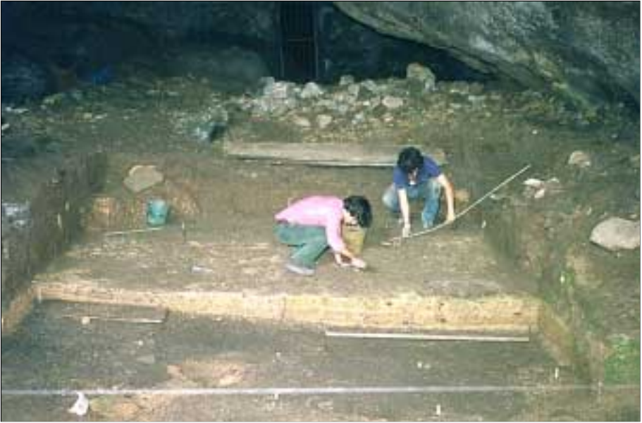
Excavaciones en Arenaza (Bizkaia). Campaña de 1974.

ha aparecido la Carta Arqueológica de Bizkaia (L. Marcos 1982 y J. Gorrochategui & M. J. Yarritu 1984).