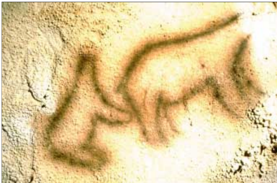
Pareja de osos del santuario de Ekain (Gipuzkoa).

1987 y 1988 se le dedicaron 11 meses. Estas excavaciones proporcionaron un rico y excepcional material paleontológico, así como industrias pertenecientes a los comienzos del Paleolítico Superior. El trabajo interdisciplinar referente a estos materiales está a punto de concluir y se publicará en 1999, como suplemento de Munibe (Antropología-Arkeología) .