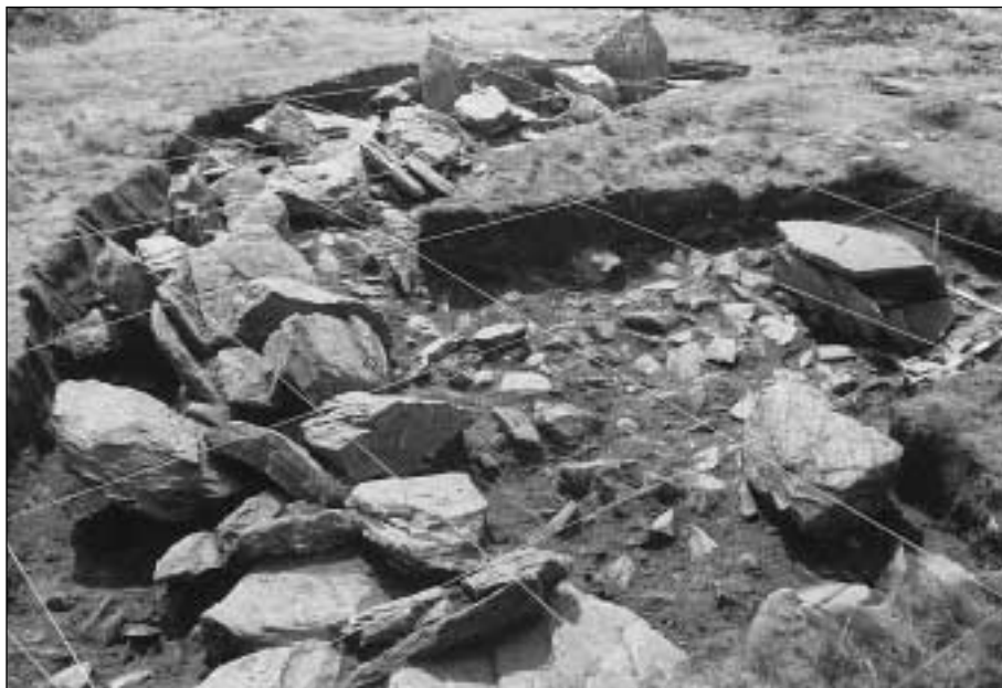
Excavaciones dirigidas por J. Blot en el cromlech de Mendizabale 7 (Lapurdi).

mándose en las Universidades citadas y en otros Centros de investigación. Una mirada a la docena de revistas de Arqueología que se publican en el País muestra claramente lo que decimos.