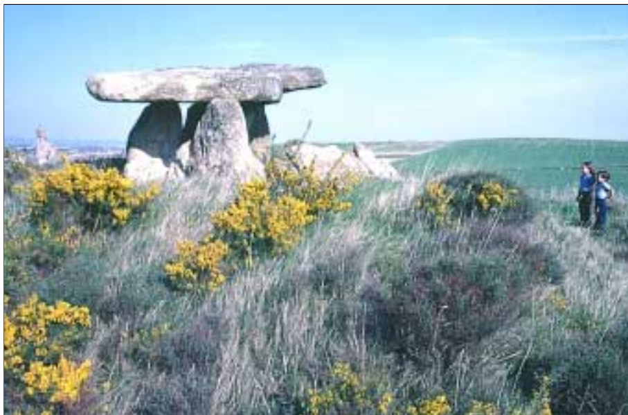
Dolmen de Elvillar (Rioja alavesa) excavado y reconstruido por J.M. Apellániz.

restos óseos animales descubiertos en estas excavaciones fue publicado por nosotros (Altuna 1980, Altuna & Mariezkurrena 1990).