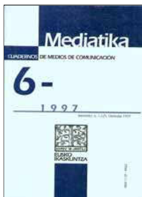
MEDIATIKA. Cuadernos de Medios de Comunicación Donostia : Eusko Ikaskuntza. - N° 6 (1998), N° 7 (1999)

MEDIATIKA : un espacio abierto para la investigación y el debate sobre comunicación.