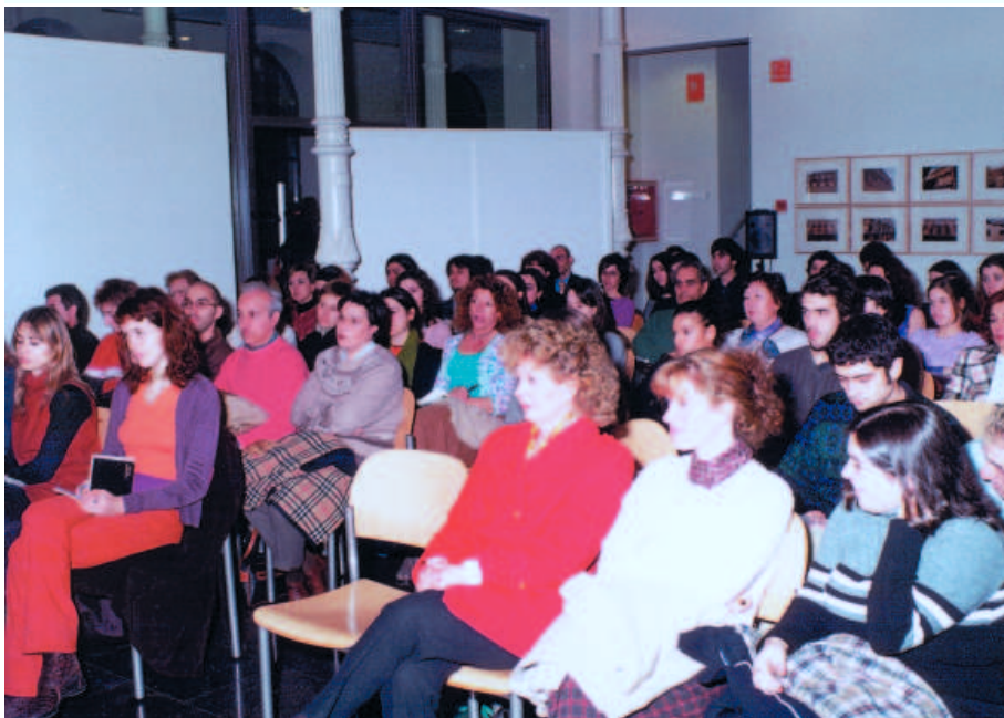
Bilbao, 2001.03.05. Jornadas Arte Contemporáneo: Aperturas Liminares.