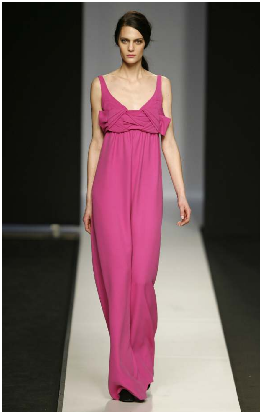
Un modelo de la colección otoño-invierno 2008/09 de Miguel Palacio