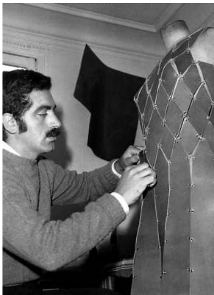
Paco Rabanne en plena tarea, 1966. Kamitsis, Lydia. Universo de moda. Paco Rabanne . Paris: Assouline, 1998

Arquitecto de formación –“hay esculturas que están hechas para mirarlas con los ojos del corazón”, según él–, es uno de los admiradores de primera hora de Balenciaga.