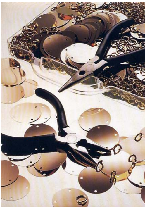
Kit para crear uno mismo un modelo de Rabanne, década de los 90. Kamitsis, Lydia. Universo de moda. Paco Rabanne . París: Assouline, 1998

Mirar atrás nos permite repasar la amplia y sobre todo variada paleta de fragancias que han visto la luz bajo el sello Paco Rabanne. Un nombre de lo más español y un apellido de lo más afrancesado –recuerden que de Rabaneda pasó a Rabanne–: Calandre , su primera eau de toilette para mujer, vio la luz en 1969. Atemporal, con un frasco inspirado en los rascacielos de Nueva York, aún clasicismo y modernidad. Cuatro años más tarde, los caballeros podían perfumarse con Paco Rabanne pour Homme , donde destacan la bergamota y la lavanda, entre otros componentes. Es en la década de los setenta cuando se inaugura la fábrica de perfumes en Chartres, no muy lejos de París, lo que asegurará una mayor producción.