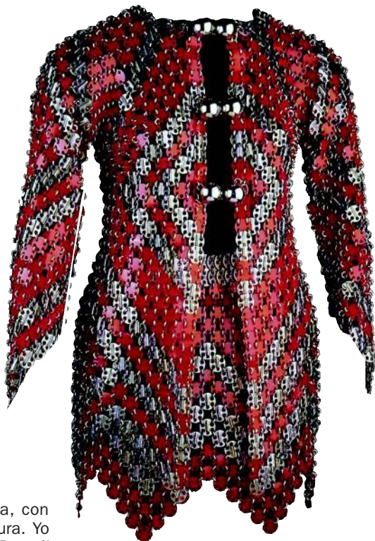
Conjunto de lo más rabanniano , 1969. Foto: Stéphane Cicerone. Kamitsis, Lydia. Universo de moda. Paco Rabanne . Paris: Assouline, 1998

Para Rabanne, la elegancia “es una actitud interior, no una manera de vestir. Es un gesto, una mirada. Se puede hacer de alguien una persona elegante”. En sus reflexiones, también hay lugar para la crítica: se queja de que a veces haya “mal gusto en la moda”. En cuanto al estilo, explica que