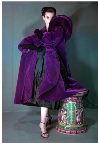
Suntuosa propuesta del costurero vasco, 1951.

Es una lástima que las obras del museo estén en punto muerto, por culpa de turbios asuntos económicos, por oscuras manos que al parecer se aprovecharon sin escrúpulos y ante quienes el peso de la ley ha de caer con todas sus consecuencias. En honor a la verdad y al más grande de los maestros de la costura. Después, que se culminen las obras con éxito y se pueda exponer parte del incommensurable arte de don Cristóbal.