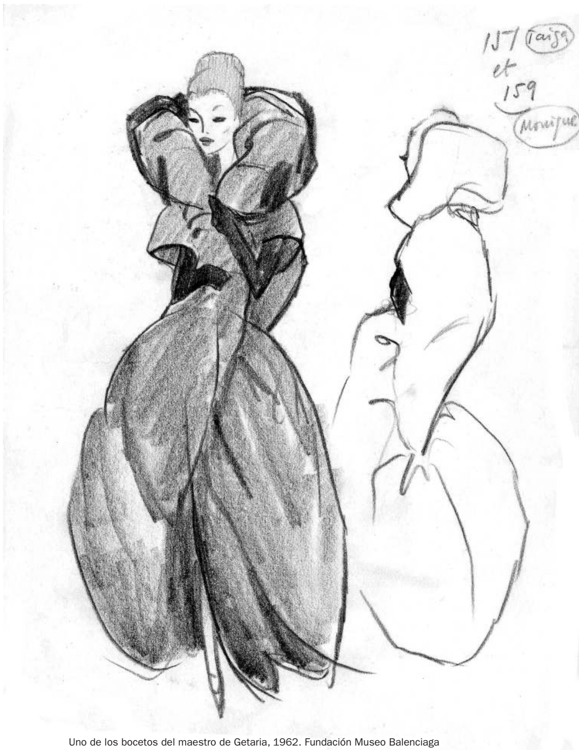
Uno de los bocetos del maestro de Getaria, 1962. Fundación Museo Balenciaga