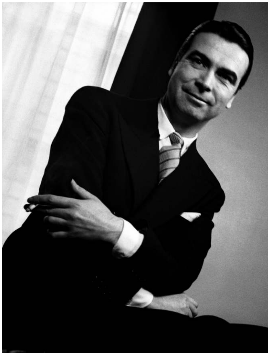
Retrato de Cristóbal de Balenciaga, hacia 1937.