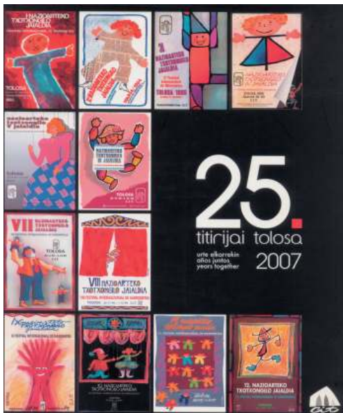
25. Titirijai Tolosa 2007