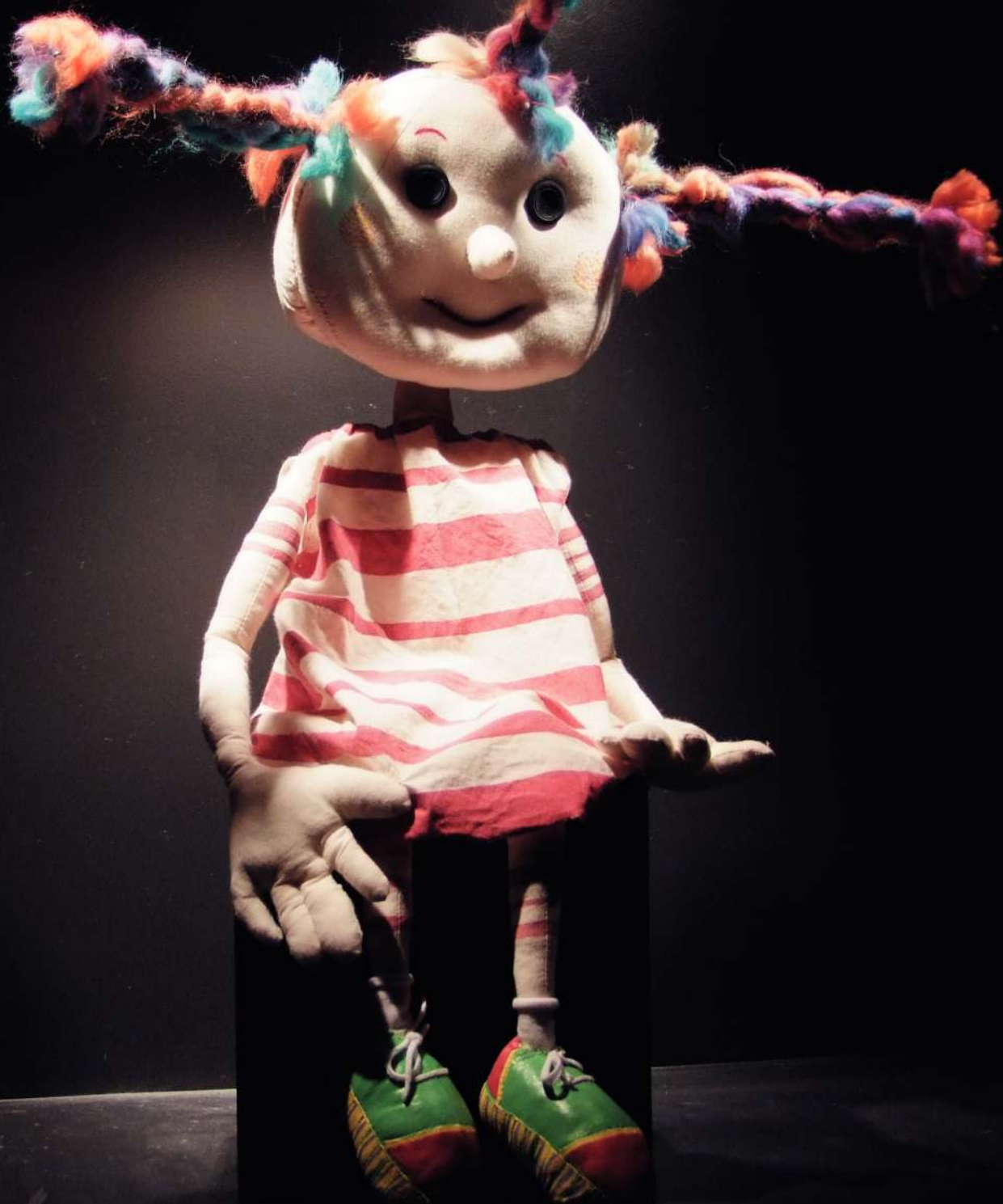
Mariona Topic-eko maskota