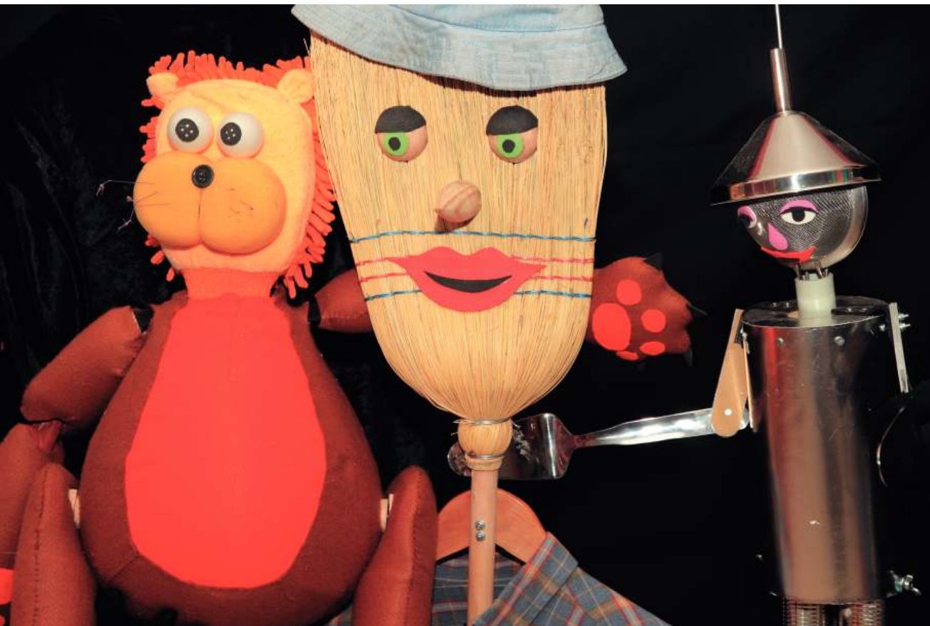
Farres Brothers i Cia. Konpainia kataluniarrak arrakastaz aurkeztu zuen 'Ovni' lana. 2010

Haurrentzako egitaraua bereziki zaintzen du Topic zentroak eta haiei zuzenduriko hainbat ikuskizun ere eskaini ditu txotxongiloen etxeak. Urrian Teatro Plus taldeak "La leyenda de farl" haurrentzako antzezlan eskaini zuen, esaterako.