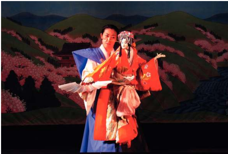
Kuruma Ningyo. Japoniar taldeak 2010ko Titirijai jaialdian parte hartu zuen

Topic, beraz, ez da ezerezetik jaiotzen. (Aurten bere 28. edizioa ospatzen duen Titirijai jaialdiaren ondorio logiko bat da). Konpainien, antzeppen kopuruaren eta agertzen den ikuslegoaren ikuspegitik neurri guztiak agerian jartzen dituen eta gaur errealitate sendo bat den jaialdi bat.