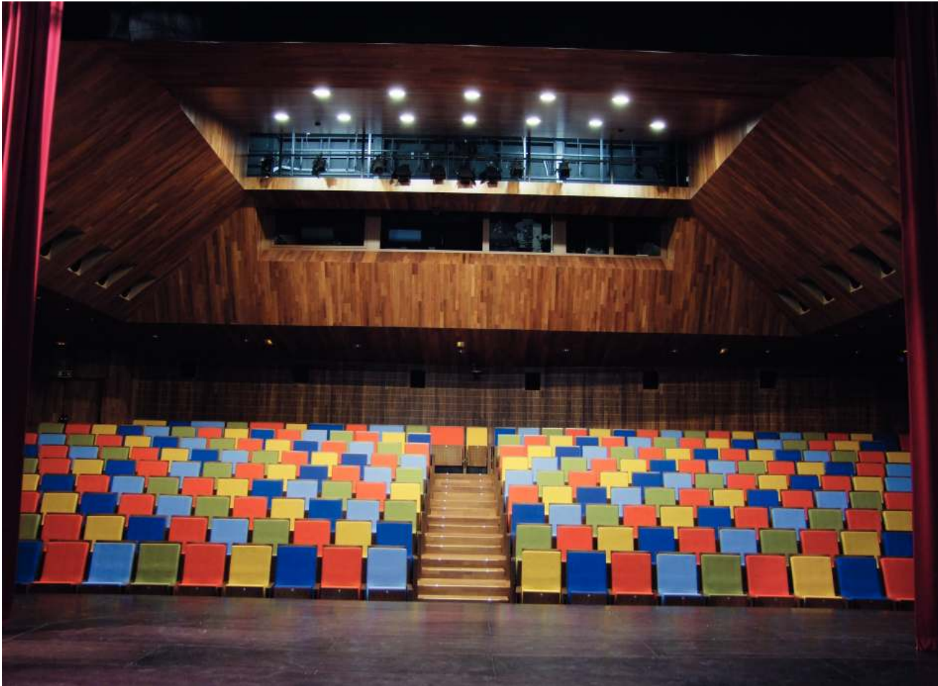
Topic zentroko auditorioa, 250 ikuslerentzat edukia duena. 2009