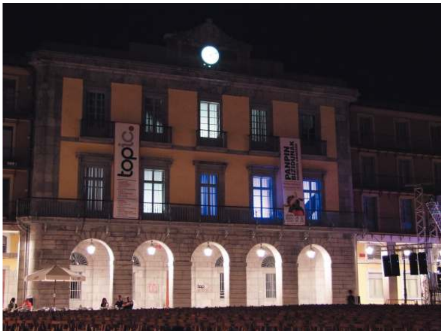
Topic eraikina, gauetz argizatuta. 2009