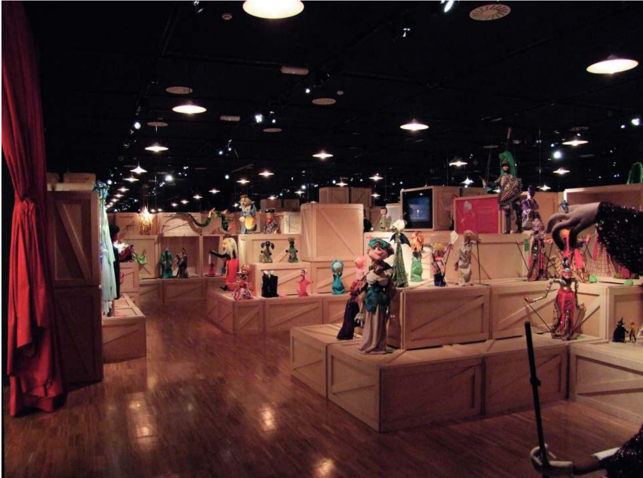
Topic-eko museoak bilduma garrantzitsua gordetzen du mundu osoko txotxongiloekin

guztion eginbeharra da etorkizunean iraganean gertatutako galera edo espoliazioak saihestea.