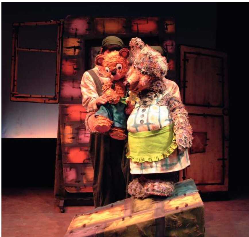
Puppet Theatre Puk. Japoniar taldearen 'Woof el osito' obra. 2010

Topic zentroko dokumentu fondoa mundu osoko txotxongiloen 1.500 bideo eta DVD biltzen ditu; 1.800 kartel; 15.000 argazki; 2.500 konpainien literatura dokumentazioa eta diziplina artistiko honetan espezializatua dagoen 900 liburu biltzen dituen liburutegia. Dokumentazio guzti hau digitalizatuta dago erabat eta internet bitartez eskuragarri dago, Gipuzkoako Foru Aldundiak eskainitako laguntzari esker.