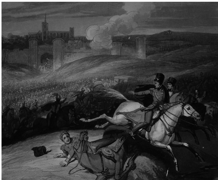
Gasteizko Bataila (Westall R.A., R.; Fielding, T. (grabatzailea) Victories of the Duke of Wellington , Printed for Rodwell and Martin, London, 1819, Koldo Mitxelena Kulturunea. Gipuzkoako Foru Aldundia / Koldo Mitxelena Kulturunea, 094 WES VIC, pág. 28-29).

tainiar-portugaldarren zati batek Maucuneren gizonak Beasaindik kanporatu zituzten, 200 hildako utzita, eta beste zati batek, berriz, italiarrak, 90 hildako edo zauritu eraginez. Horren ondorioz, Foy jeneralaren indar guztiek Tolosarantz egin zuten. Bide hori hartu zuten ere Grahamek, Longak eta Gironek, eta Castrotik eta Azpeititik zetorren Mendizabalek ere.