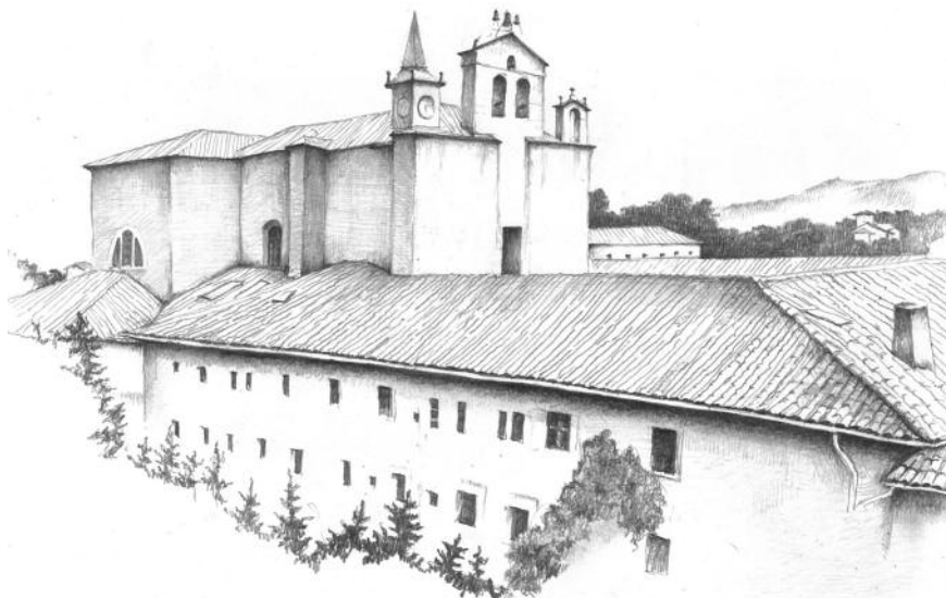
Convento de Franciscanos en Zarautz (Ilustración: Jorge García Alegría)