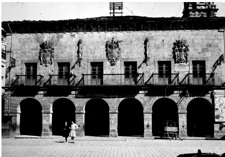
Figura 3. Casa consistorial de Bergara. Indalecio Ojanguren, 1920ca. (Fuente: Archivo General de Gipuzkoa. Licencia: CC BY-SA)

Hasta este momento, el siguiente hito en la secuencia era el ayuntamiento de Oiartzun (1672), construido por el maestro cantero Nicolás de Zumaeta, donde arquería, soportal y sala del concejo forman una estructura claramente definida. La casa consistorial toma una forma cúbica en sillería, con una arquería al frente y rematada por un amplio alero de madera recto. 18 Su planta cuadrada está dividida en dos las crujías canónicas de este tipo de edificios, con la escalera y estancias al fondo y el soportal con la sala de plenos al frente. Sin embargo, la composición del alzado muestra las dificultades para acordar la escala de los dos elementos de representación al frente – arquerías del soportal y ventanas del salón principal – con un interior dividido en tres plantas: las dos primeras alturas de la crujía trasera elevan demasiado el techo del soportal, obligando que este elemento tome en alzado una doble altura y reduciendo el espacio de la sala del concejo al tercer nivel del edificio, resultando en una clara desproporción del frente principal. 19