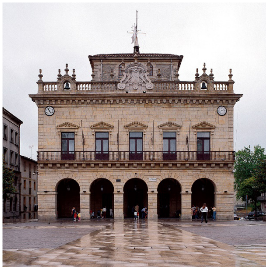
Figura 7. Casa consistorial de Irun. 1756.