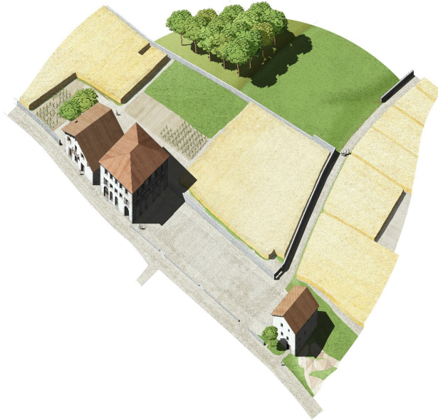
Figura 12. Axonometría de la plaza de Andoain en 1675 tras la construcción de la casa consistorial. (Dibujo del autor)

Con el fin de dar una lectura unitaria a los dos pisos inferiores, la arquería extendía su influencia en altura para tratar de unificar los dos primeros niveles del alzado. Las pilastras lisas de los arcos se prolongaban hasta la base del balcón de segunda planta, englobando las ventanas del piso primero en una suerte de cajeados que generaban contradicciones en los tramos laterales pronunciados de la fachada. Al mismo tiempo, la altura del arco central se duplicaba, rompiendo el ritmo de las ventanas de la primera planta y generando evidentes problemas de composición y de espacio para el hueco central del piso primero. La resolución del tercer nivel era más clara, con un cuerpo central con balcón corrido y tres huecos centrales, flanqueado entre dos tramos laterales adelantados con un tratamiento en “bugnato gentile”, todo ello rematado por una rotunda cornisa recta en piedra sobre la que se colocaba una amplia cubierta a cuatro aguas sin alero.