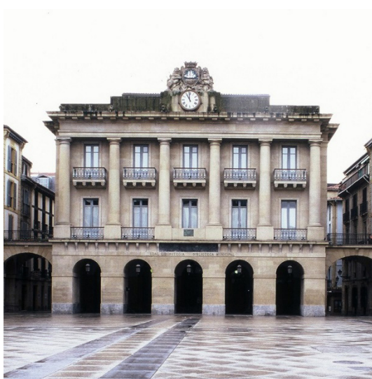
Figura 8. Casa consistorial de Donostia. 1819.