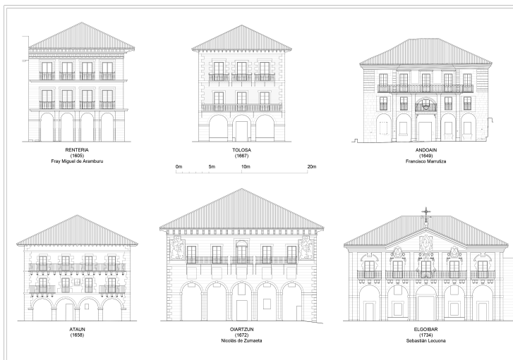
Figura 4. Elenco de alzados con parte de la secuencia de casas consistoriales vascas.