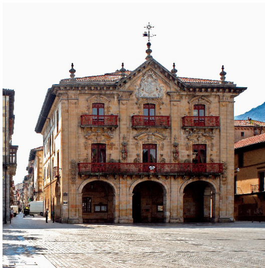
Figura 5. Casa consistorial de Oñati. 1763.