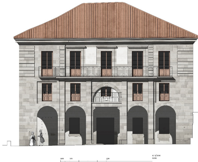
Figura 11. Alzado original de la consistorial de Andoain. (Dibujo del autor)

Para la fachada principal, se tomó la misma fórmula del edificio sobre arcos del modelo errenteriarra, pero liberándola de la estructura compositiva en niveles del ayuntamiento de Aramburu, con un lenguaje más austero. La forma cúbica del edificio, con su volumen severo y compacto, primaba sobre la lógica de la fachada, construida enteramente en sillería y con los flancos levemente resaltados sobre los tres tramos del centro. La arquería de cinco tramos del soportal comenzaba a tomar autonomía propia, superando los límites de los pisos interiores mediante una estructura de impostas y pilastras que recuerda a los ayuntamientos de Oviedo (1621) o de Madrid (1640), este último construido por el herrero J. Gómez de Mora 43 . Sin embargo, la solución de este edificio estaba lejos de la claridad de estos dos ejemplos y resultaba también mucho más confuso en su composición que las fachadas de los ayuntamientos vascos de las décadas posteriores. El alzado trataba de reducir su expresión a los dos elementos principales de representación, la arquería inferior y el balcón corrido ritmado por los huecos de la sala del concejo. Ello se realizaba con un lenguaje elemental, en línea con el severo estilo de pilastras, placas recortadas y recuadros que imperaba en el resto del reino abriendo el camino desde el estilo post-herreriano hacia la arquitectura barroca que reinó en las futuras casas consistoriales vascas 44 .