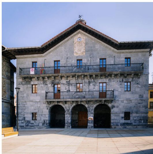
Figura 6. Casa consistorial de Asteasu. 1754.

La intervención de otro ingeniero militar extranjero, Felipe Cramer, marcaría otro hito en esta secuencia al construir la casa consistorial de Irun (1756-1763), una intervención que vuelve a enfatizar la forma cúbica del edificio y que alcanzó una de las soluciones más equilibradas y refinadas tanto en las proporciones globales como en la composición de la fachada. El cuerpo de la