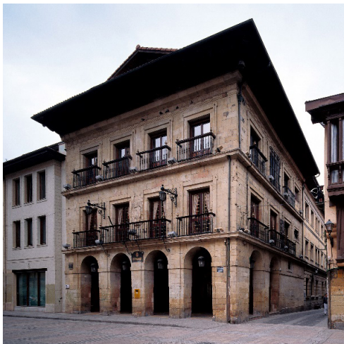
Figura 1. Casa consistorial de Errenteria, 1605. (Fuente: Archivo General de Gipuzkoa. Licencia: CC BY-SA)

Ambas casas consistoriales, la de Durango y Rentería, incorporan por primera vez elementos claves para la futura tipología – como el soportal con arquerías y el salón sobre ellas – con un lenguaje claramente renacentista que definió el camino para este nuevo grupo tipológico en unos edificios que por lo demás, eran continuistas con la estructura de los palacios renacentistas. 17