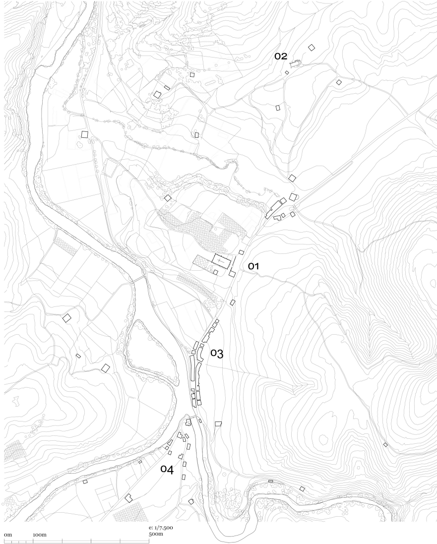
Figura 09. Plano de Andoain en el siglo XVIII señalando el lugar de la casa consistorial junto con la nueva plaza e iglesia. (1) Plaza del ayuntamiento y nueva iglesia de San Martín, (2) Antigua Iglesia de San Martín en el barrio de Buruntza, (3) Nucle urbano de Andoain, (4) Barrio de Leizaur (Dibujo del autor)

Lo que en origen debió ser un llano situado al borde del camino tomó una nueva significación cuando el consistorio adquirió el lugar para convertirlo en un espacio público permanente. Para ello, el consistorio adquirió algunos