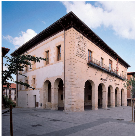
Figura 2. Casa consistorial de Oiartzun, 1678.

En efecto, la significación de estos dos elementos novedosos en la composición del edificio marcó las primeras dificultades del nuevo tipo edilicio. Por un lado, la necesidad de dar una escala urbana a las arquerías – tanto en altura como en profundidad – entraba en contradicción con la secuencia en alturas de plantas de los palacios del momento. Por otro lado, las dimensiones mucho más amplias de la sala del concejo provocaban una distorsión en los espacios tradicionales de los palacios, una alteración que se manifestaba también en la fachada principal, cuya organización tradicional en plantas superpuestas se transformaba necesariamente en la superposición de dos piezas: la arquería a los pies y la sala de plenos en el remate. El encaje de estos dos elementos en la organización de la fachada fue el principal tema compositivo que dio origen a la variedad de soluciones que caracterizan este grupo de casas consistoriales. Por último, la necesidad de dar una presencia clara y diferenciada al edificio del concejo hizo necesario pensar un tipo edificio exento, separado del resto de edificios de las villas, obligando a una reflexión sobre su forma global y su posición en el tejido urbano de las poblaciones.