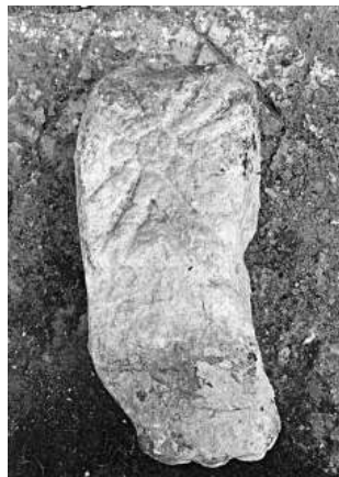
Martialay. Estela nº 2

Decoración anverso: Cruz latina, brazos ligeramente ensanchados en sus extremos, en bajo relieve. Decoración reverso: Rayos de sol, incisos, partiendo