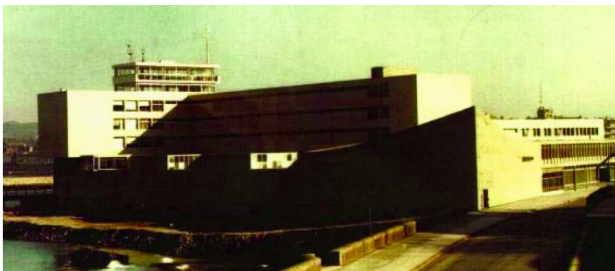
Il. 1. Vista oeste del edificio de la Escuela Oficial de Náutica de Bilbao, en Portugalete, en la actualidad denominada Escuela Técnica Superior de Náutica y Máquinas Navales de la Universidad del País Vasco.

En 1955 el edificio principal de la Escuela en Deusto sufrió una importante obra de ampliación 9 , a pesar de ello, al comienzo de la década de los sesenta demostró ser insuficiente para prestar adecuadamente los servicios de formación náutica requeridos 10 , por lo que se comenzó a buscar un nuevo emplazamiento para el centro 11 .