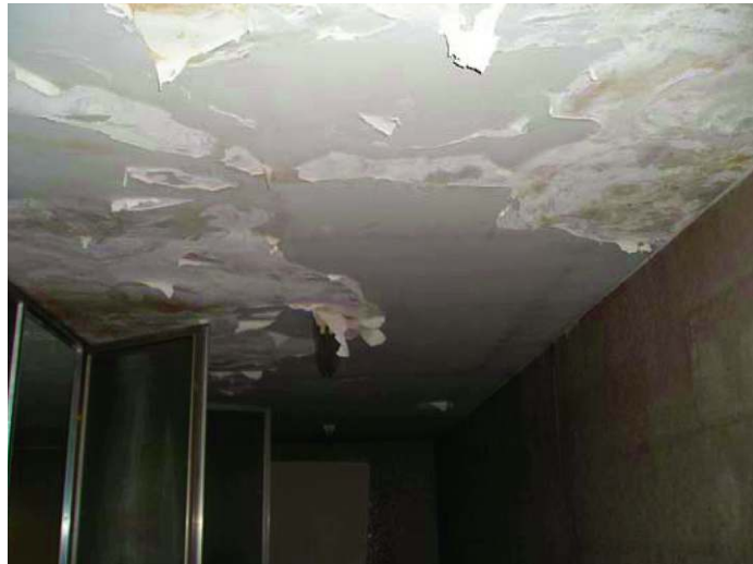
II. 2. Estado del local en la 4ª planta del edificio de Portugalete, donde permaneció el Archivo Histórico hasta el curso 2002-2003.

En 1965 se inició la construcción del nuevo edificio en Portugalete, que fue inaugurado en 1968 12 . El mobiliario, los enseres, los instrumentos, las máquinas, las embarcaciones, la documentación ... fueron trasladados de Deusto a Portugalete, seguidos por el personal y los estudiantes. El archivo histórico se instaló en la cuarta planta del nuevo edificio, en un local en forma de "L", próximo a la escalera principal. Situado bajo cubierta, con ventanas interiores, pronto se manifestaron los problemas de humedad. Ahí estuvo ubicado hasta el curso 2002-2003, durante el cual el Archivo se trasladó a un local en la planta cero, en la zona de Talleres.