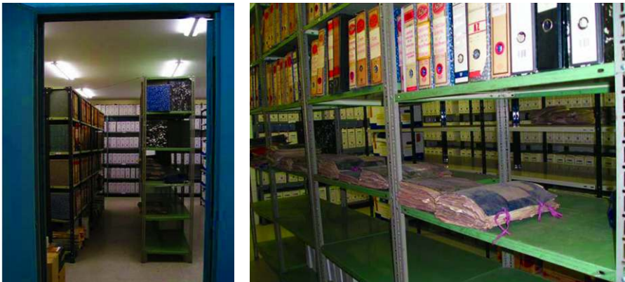
lts. 3 y 4. Vistas del local en la planta cero del edificio de Portugalete, donde actualmente se encuentra ubicado el Archivo Histórico.

real de la documentación en el local que ocupa en la actualidad, nos hicimos dos tipos de consideraciones: