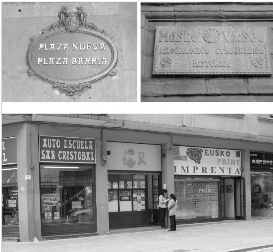
Fig. 4. Placa urbana y placa del Museo Vasco Arqueológico, Etnográfico e Histórico con “letra vasca”. Entorno urbano donde se aprecia el uso de la letra por distintos comerciantes.

titaria, a partir del análisis de sus valores morfológicos referenciales, y de su conexión con los significados que le rodean.