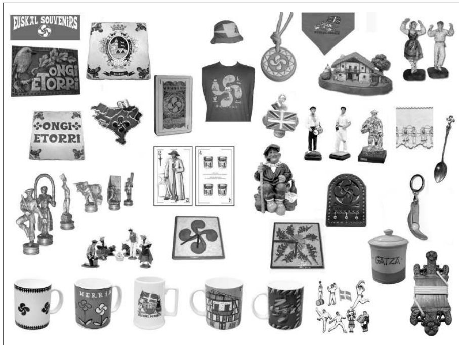
Fig. 8. Productos considerados típicos vascos con referencias al pasado rural del lugar.

imágenes –superficiales y anecdóticas– representan únicamente aspectos de nuestro modo de vida.