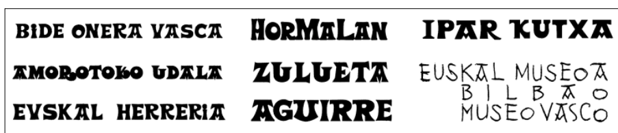
Fig. 3. Signos tipo-icónico-gráficos de identidad visual corporativa de nuestro entorno más cercano representados a través de distintas versiones de la “letra vasca” como ejemplo de una letra portadora de un significado identitario, reconocido y compartido. Estos logotipos son construidos con los caracteres tipográficos en los que podemos encontrar motivaciones de identidad con valores sociales de un pasado, de pertenencia a un “lugar”, y su utilización como seña de identidad local.

Sin embargo, estos esfuerzos de normalización de la “letra vasca” no han contribuido a una adopción oficial uniforme de este carácter tipográfico. La propiedad cultural, aquella que no es exclusivamente material, visible e incapaz de reproducirse por sí misma, debe ser constantemente hecha realidad para que exista verdaderamente, al igual que la escritura necesita ser leída y el discurso ser oído. Si esta memoria es indeterminación viva, no existen dispositivos institucionales que puedan naturalizarla ni soportes establecidos que puedan congelarla (Sachs, 2001).