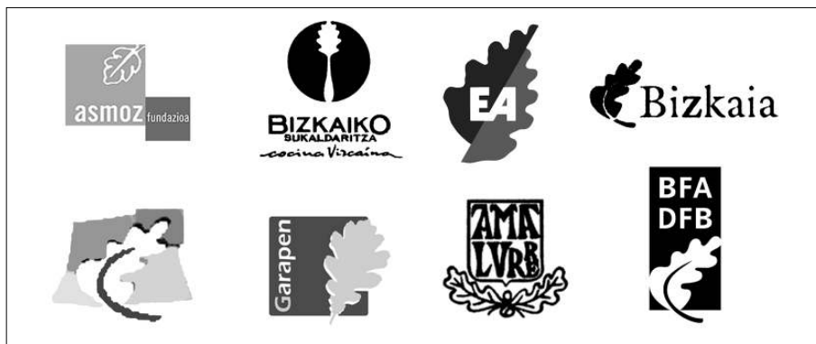
Fig. 2. La hoja de roble como símbolo iconográfico de “lugar” que implica una cultura gráfica local.

El objetivo prioritario es fomentar procesos de creación comunitaria de marca y valor de marca donde se aborde diseños consensuados de signos de identidad visual en términos de un atributo o conjunto de atributos de identidad territorial.