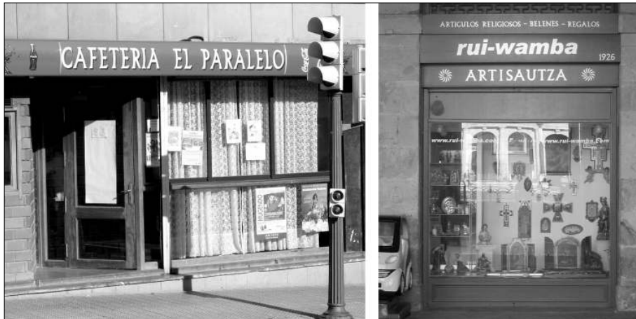
Fig. 6. Ejemplos de aplicación del “Alfabeto Bilbao” sobre distintos rótulos comerciales del espacio urbano de Bilbao.

que orientan sus prácticas. La competencia del ciudadano indica que su uso de la ciudad es una práctica cultural que permite la comunicación no explícita entre los habitantes.