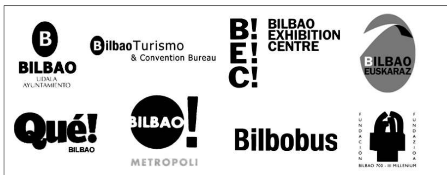
Fig. 1. Distintos signos de identidad de Bilbao que en su conjunto pueden crear una “marca de lugar” o una imagen pública.

Las políticas públicas orientadas a crear, fortalecer o reinstalar la marca de lugares se presentan en ocasiones como un poderoso activo de la gestión contemporánea en el camino del desarrollo de una imagen pública, interna y externa, de aceptación en referencia a la ciudad. De ahí, la importancia de prestar atención a la creciente demanda de respuestas respecto a su construcción y administración con especial atención en la gestión estratégica de la cultura de marca. En este aspecto es fundamental la consideración de diseño de imagen y los procesos de construcción de identidad en la definición de estrategias de desarrollo urbano.