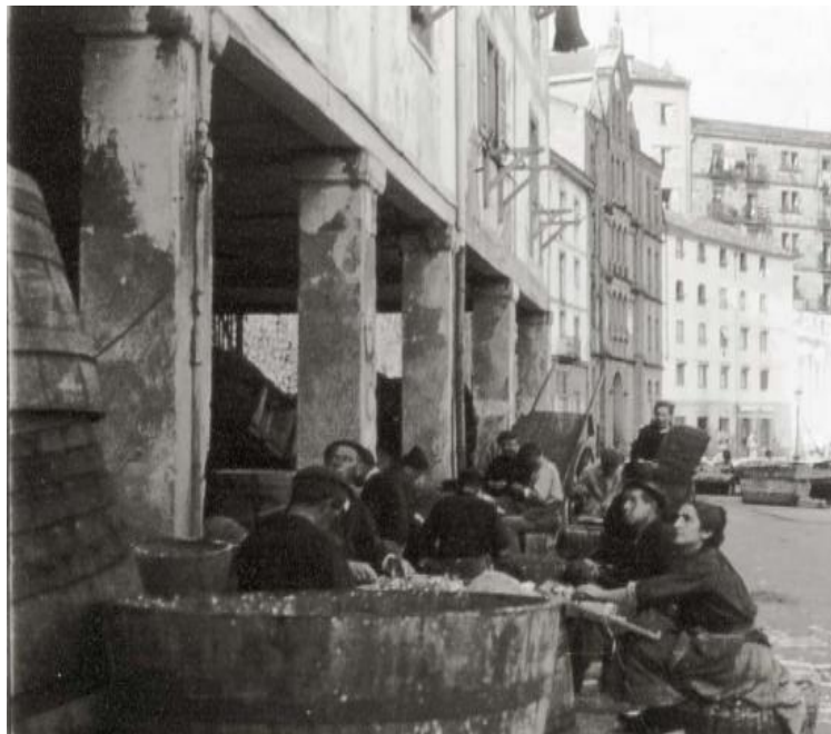
Figura 7. En el barrio pesquero