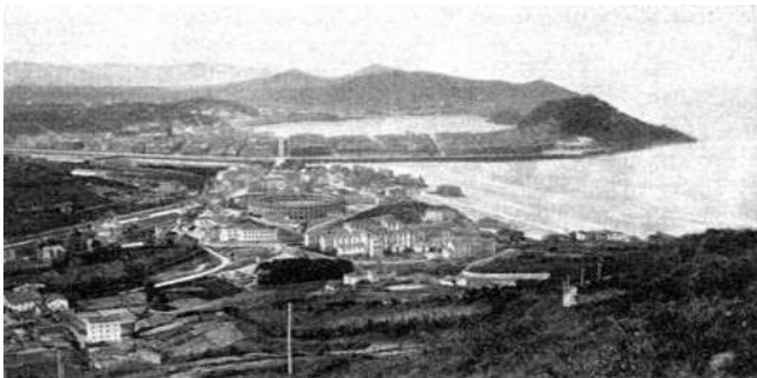
Figura 2. Vista antigua de Donostia

Además de casas, se construyen edificios señoriales. El Hotel María Cristina y el Teatro Victoria Eugenia son inaugurados en 1912 y se crean el Balneario de la Perla y el palacio de Justicia, entre otros. El Paseo Nuevo se inaugura entre 1917 y 1919 –se realiza en dos tramos– y el Monte Urgull se convierte en parque público cuando lo compra el ayuntamiento en 1921. En el barrio de Gros, franceses, belgas y alemanes instalan sus fábricas y talleres y en 1922 se construye el Gran Kursaal.