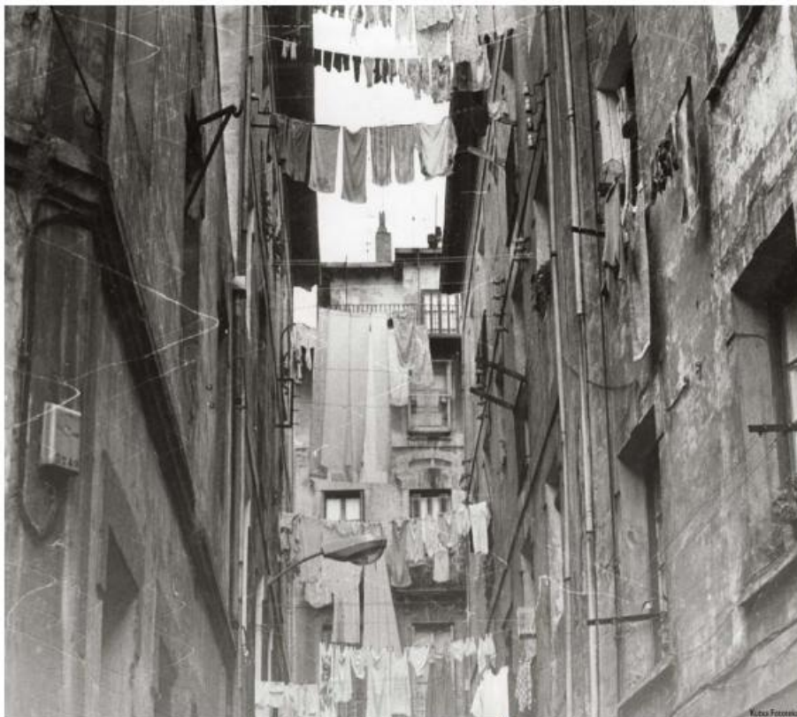
Figura 3. Rincón de la Parte Vieja