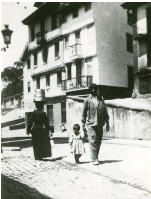
Figura 5. Vecinos de la Parte Vieja de Donostia