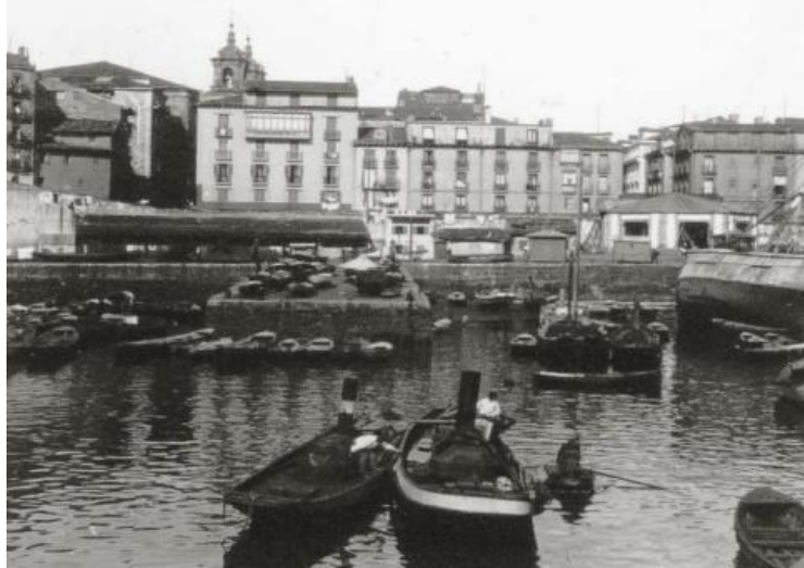
Figura 6. El puerto pesquero