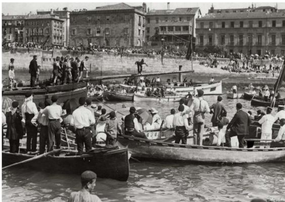
Figura 8. Cucaña en el puerto