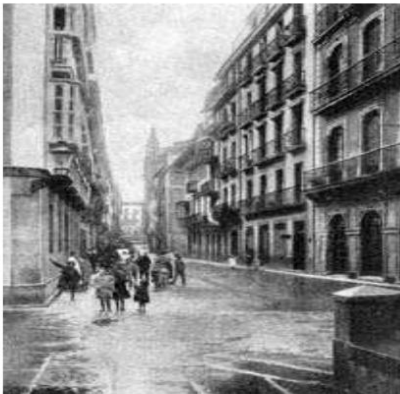
Figura 4. La calle