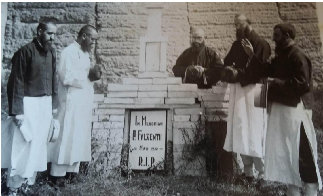
Figura 7. In memoriam de Fulgencio de Barga