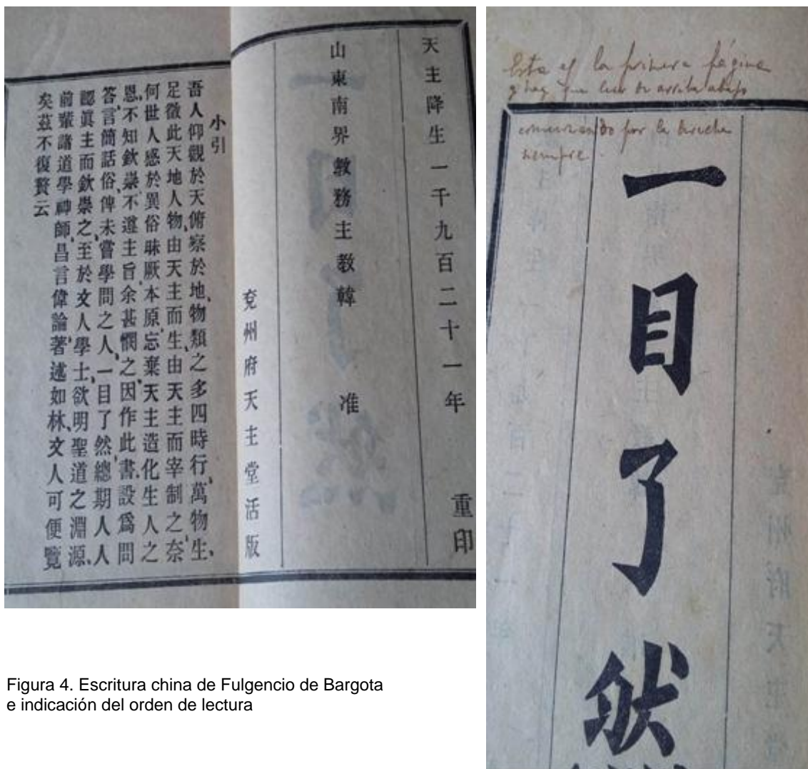
Figura 4. Escritura china de Fulgencio de Bargota e indicación del orden de lectura

Y siempre el interés misionero por encima de todo: la pena ante la escasez de misioneros para tantas ciudades y regiones tan pobladas, con su deseo de aprender cuanto antes el chino para poder transmitir, en la propia lengua, la novedad del evangelio.