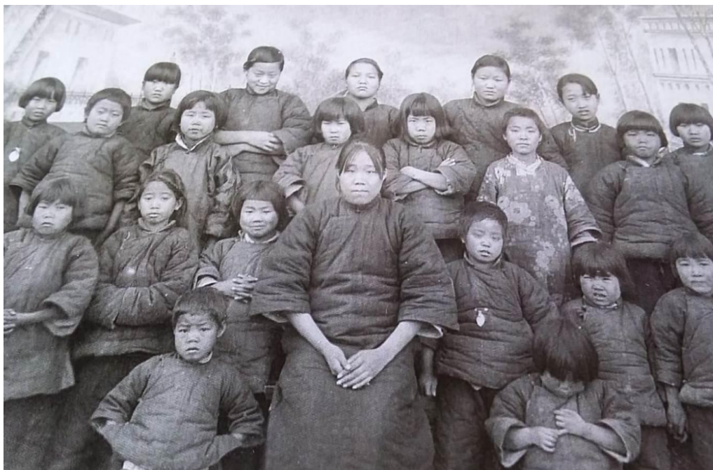
Figura 6. Comunidad de cristianos chinos de la misión de Kansu