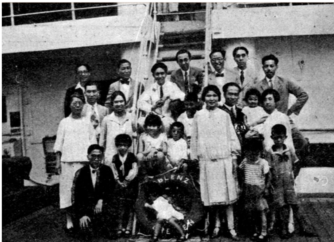
Figura 3. A bordo del Koblenz