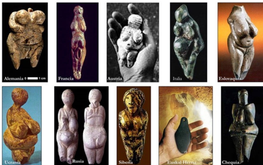
Irudia 3. Mariren adierazpen paleolitiko ustekoak.

Mundu-ikuskera baitarakoien ikuspegitik, irudi hauek barneko errealitatearen kanpoko azalen adierazpenak dira. Indiako Bhaktismoan bada estatuetxo edo irudi hauek adierazten edo irudikatzen duten jainkosarekin berdintzeko taktika baitarakoia, alegia, horiek gurtuz nia jainkosa horiengan urteza da helburua (ikus adibidez; Pechelis, 2014), baina ez dakigu aurrekoen kasuan parekorik gertatzen zenentz.