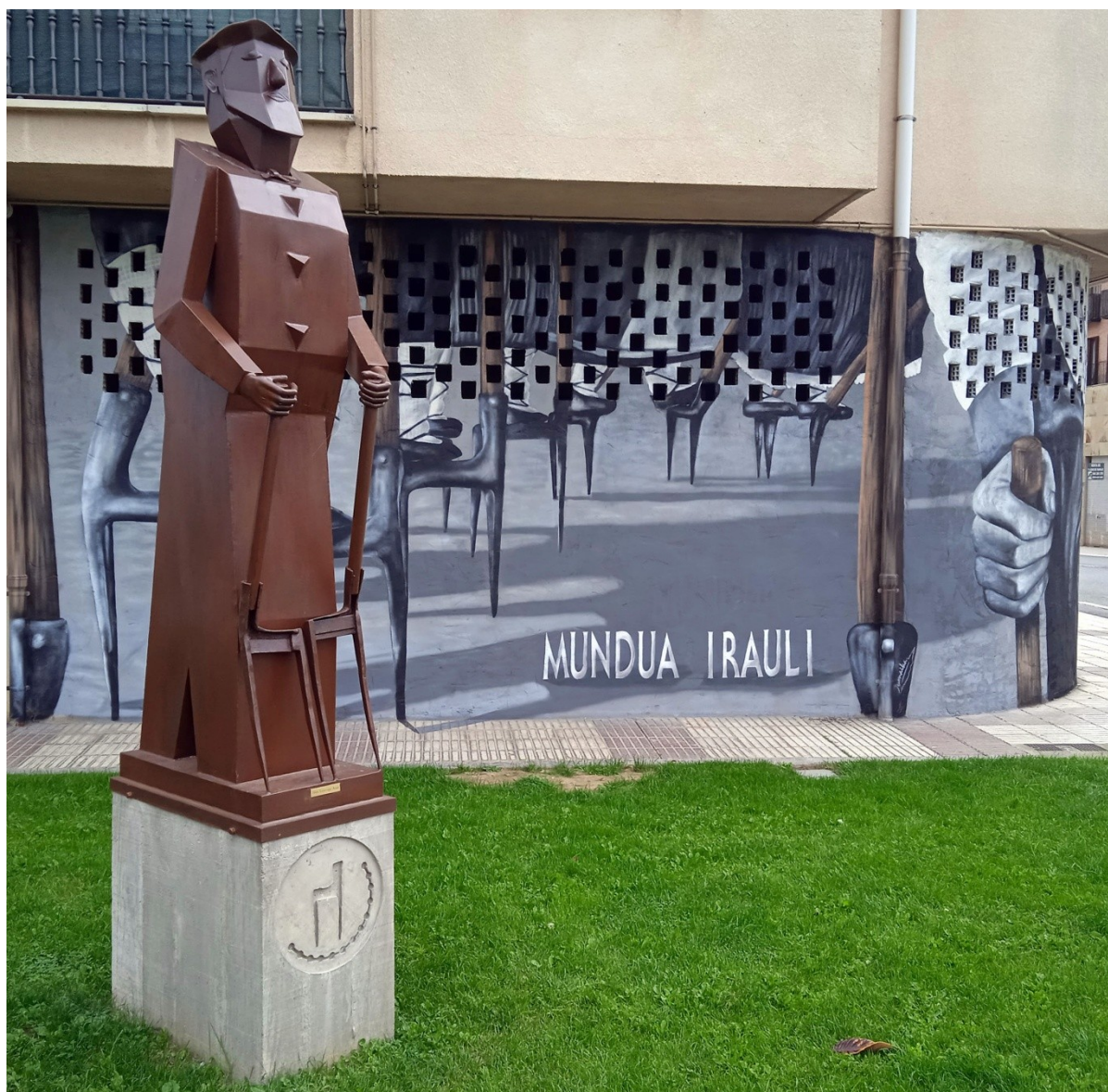
Figura 8 Escultura de Félix Lizarraga ante el mural artístico de Olaia Chocarro y Mikel Herrero

En cualquier caso, lo que sí sobrepasó el marco local de Puente la Reina fue la prueba en sí, pues desde 1993 la juventud de Artajona se animó a organizar su propia carrera. La Subida al Cerco tiene lugar cada año en las fiestas patronales de San Saturnino y los participantes deben acceder al recinto fortificado a través de la calle Eugenio Mendióroz, de piso empedrado y una de las de mayor pendiente de la localidad.