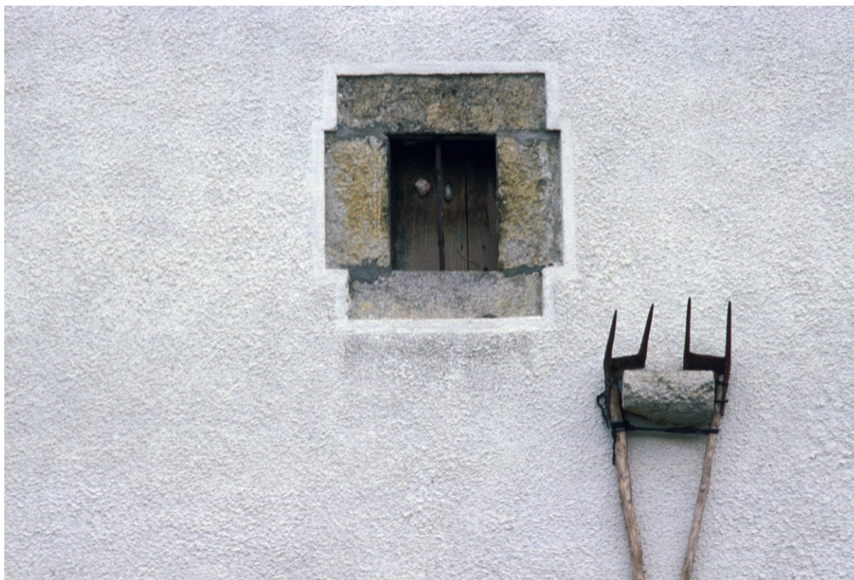
Figura 3 Caserío con layas en Navarra

Si el mantenimiento de una cierta reputación personal o comunitaria no era suficiente estímulo para aventurarse en esta clase de disputas, el componente económico que generalmente iba asociado a las mismas solía acabar por persuadir a aquellos jugadores más indecisos. El dinero que entraba en juego podía proceder de los mismos rivales, pero lo más habitual era que se formaran sociedades de accionistas que reunieran los importes acordados en las apuestas. Por otro lado, además de las cantidades jugadas entre los rivales directos y sus protectores, el público que presenciaba las pruebas también hacía sus propias traviesas.