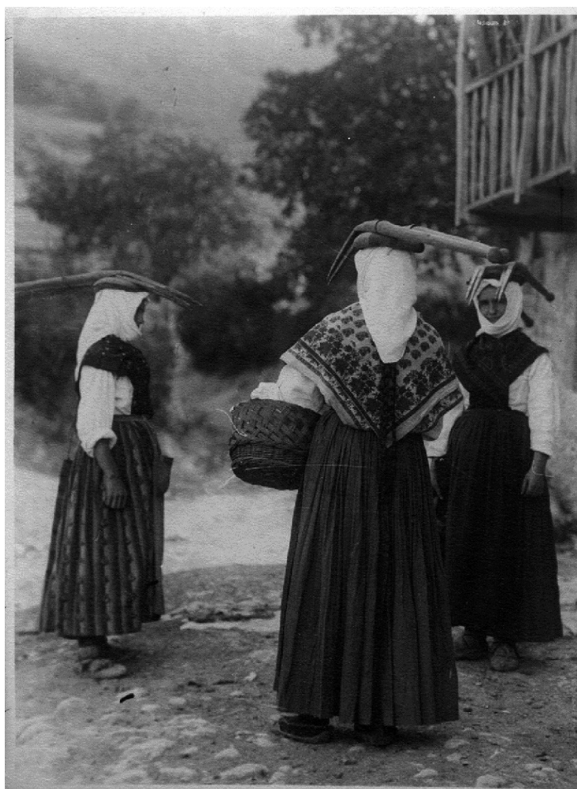
Figura 6 Mujeres de Urdiain portando las layas sobre sus cabezas

Uno de los que se hizo eco de la intervención de las mujeres en las tareas de layado fue el polifacético escritor Augustin Xaho (1933: 147) al exponer las impresiones de su viaje por Navarra en el contexto de la primera Guerra Carlista. Tras referirse a las características de la laya y al modo en cómo se utiliza, el suletino destacaba que «las mujeres y las mozas toman la misma parte que los hombres en este trabajo que se hace marchando hacia atrás, y la laia que manejan sus manos no es ni más pequeña ni menos pesada» (1933: 147). El mismo proceder fue constatado por Miguel de Unamuno (1958: 274) cuando señalaba que los campos se roturaban «con laya y a brazo, no sólo de hombres, sino de mujeres, que los acompañan en todas las faenas agrícolas, aun las más duras».