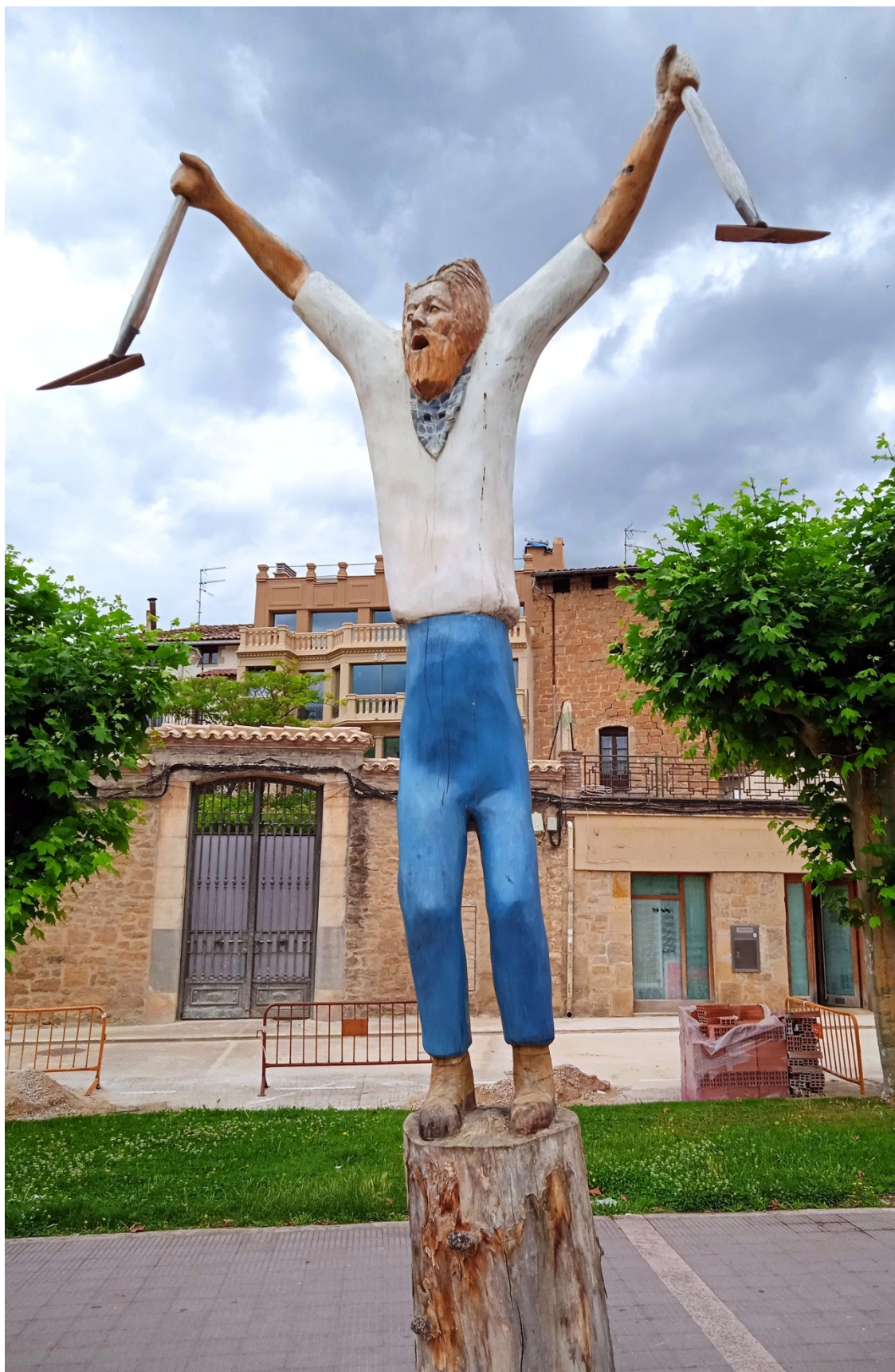
Figura 7 Escultura "Laiari" de Koke Ardaiz